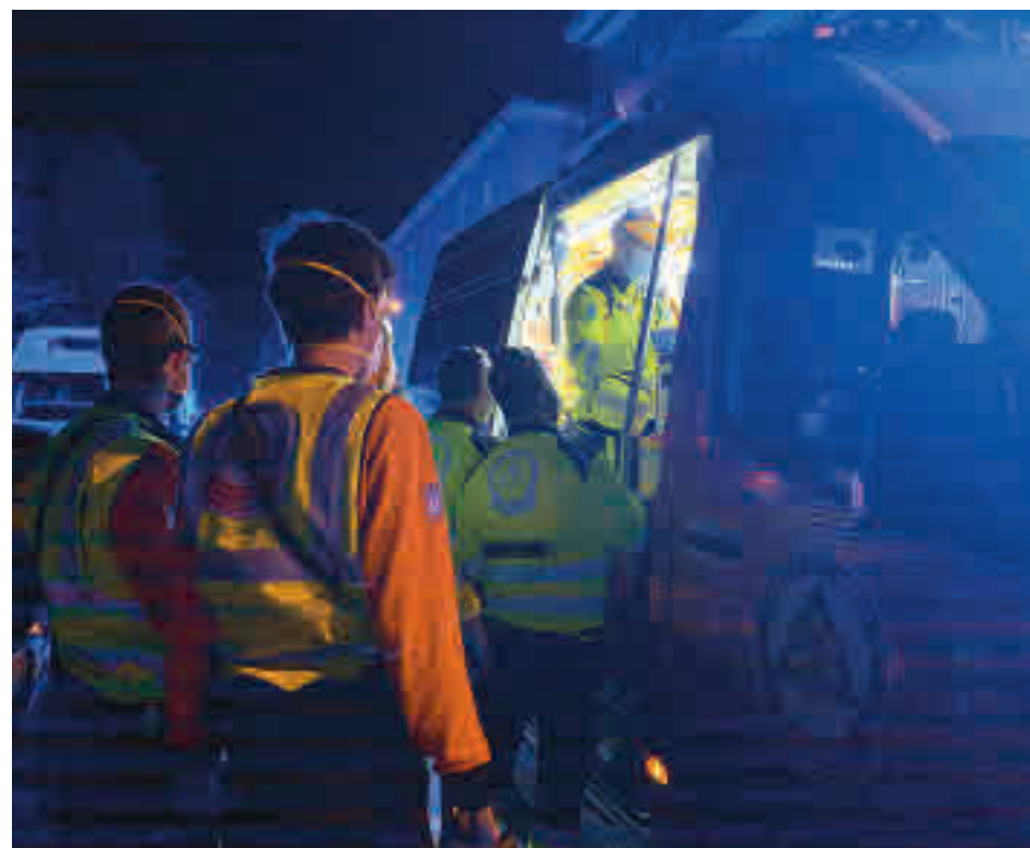
Sanitarios atienden a la víctima de la última agresión en la calle de Estroncio

Toda la actualidad de los distritos de Madrid, en nuestra web