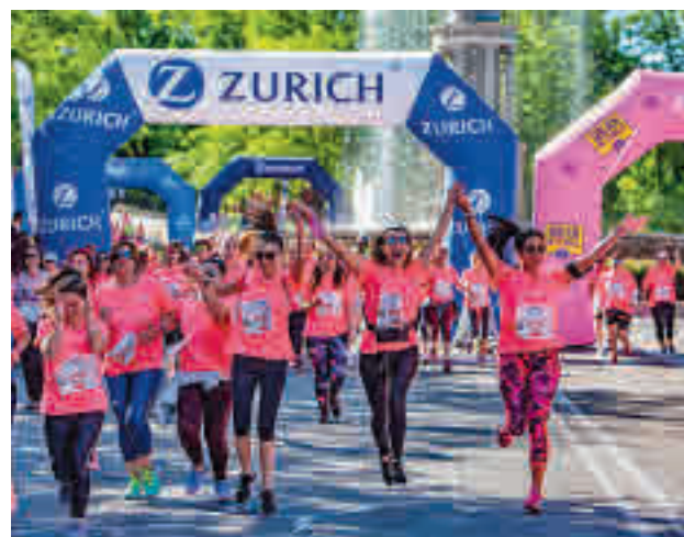
Imagen de otra edición

de siete kilómetros. Las obras en el entorno de Plaza de España han llevado a los organizadores a situar la línea de salida en la calle Serrano para después atravesar Colón, Cibeles y la Puerta de Alcalá antes de cruzar la meta ubicada en el interior del Parque del Oeste.