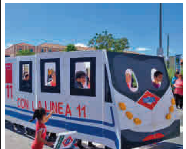
Uno de los actos reivindicativos vecinales

La zona Sur de la capital es frecuentemente el escenario de sus enfrentamientos, el último, el grave apuñalamiento que sufrió un joven de 17 años este mismo miércoles 20 de octubre en la calle de Estroncio (Villaverde). Horas antes, hubo un altercado sin heridos pero con dos detenidos en la estación de Cercanías de Orcasitas (Usera).