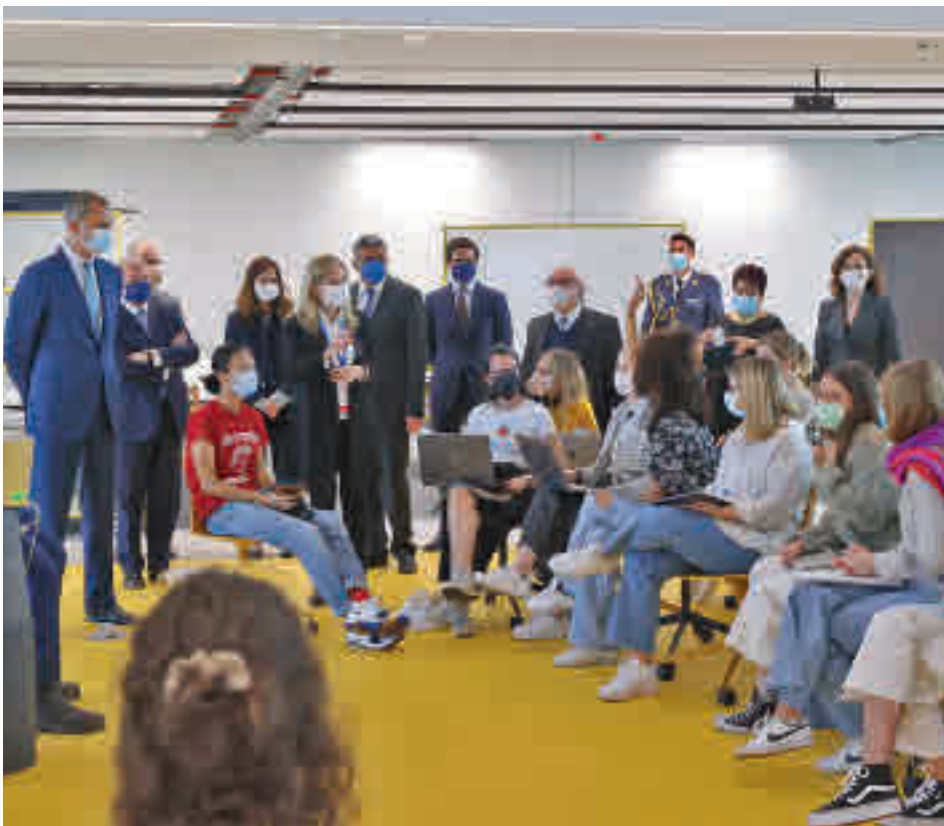
Su Majestad el Rey conversó con los alumnos en el transcurso de una clase