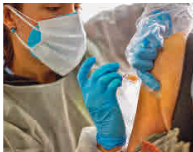
Vacunación contra la gripe

En concreto, el Gobierno regional ha adquirido de cara