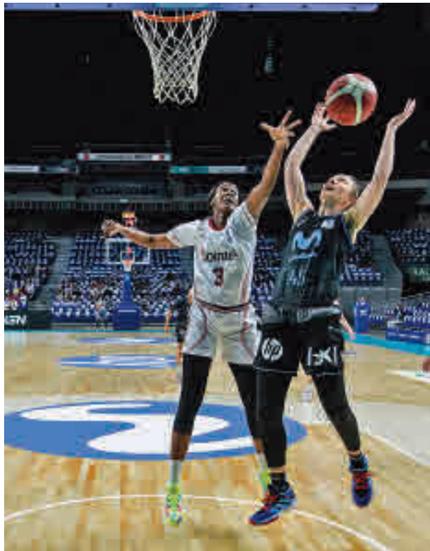
El 'Estu' y el Gernika jugaron en el WIZink Center en marzo

Tras estos resultados, el choque de este sábado 23 (18:30 horas) en el Polideportivo Maloste da la posibilidad al Movistar Estudiantes de igualar en la clasificación a su próximo rival, aunque, por el contrario, una derrota dejaría a las colegiales metidas de lleno en la carrera por elu-