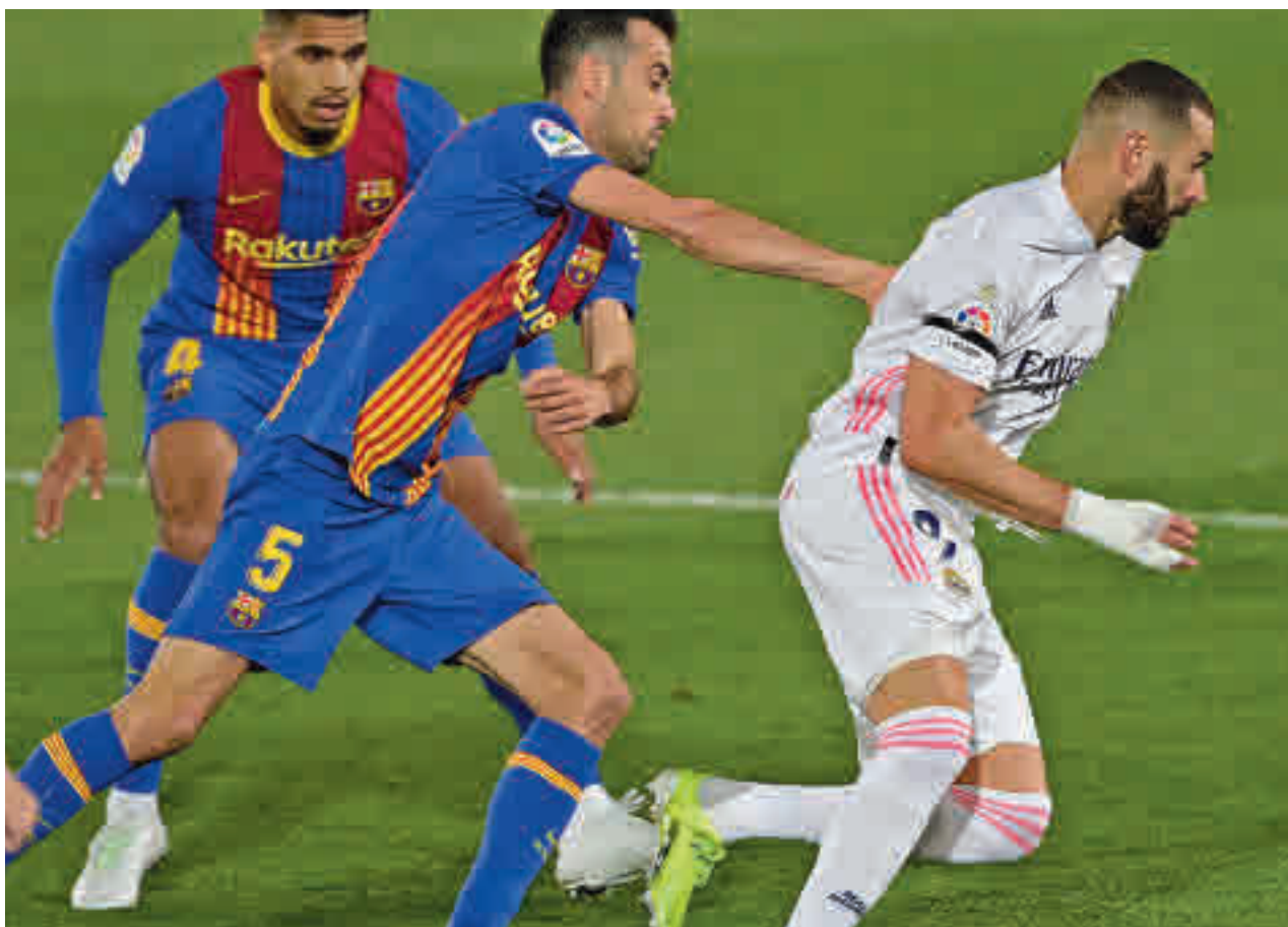
Benzema trata de zafarse de Busquets en el 'Clásico' disputado en abril en Valdebebas