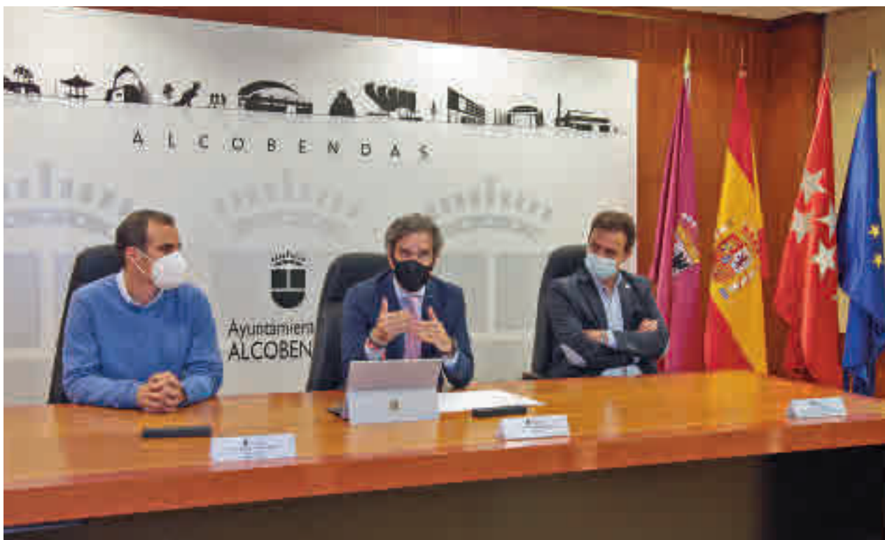
Presentación de la firma del convenio