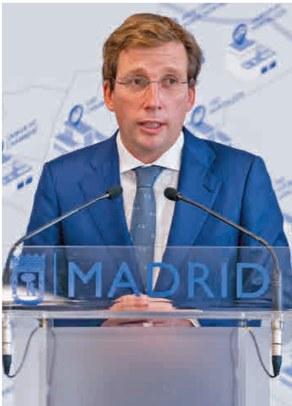
Martínez-Almeida es el alcalde mejor pagado de España

Además, otros 17 regidores madrileños reciben por su desempeño al frente del Ayuntamiento de sus respectivas localidades cantidades por encima de los 50.000 euros. En concreto, entre los 60.000 y los 70.000 euros nos encontramos a los alcaldes de Alcorcón