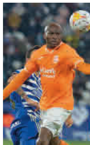
Buen momento del 'Fuenla'

SmartBank a afrontar una larga carrera de fondo, donde, en ocasiones, hay que redoblar esfuerzos. Este fin de semana se celebrará la duodé-