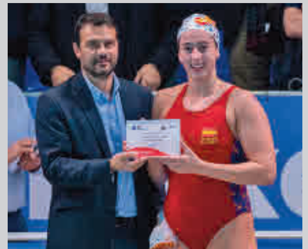
Camus ya brilló en el Cto de Europa sub-17 de 2019

Una derrota en Bilbao deja al Urbas Fuenlabrada como antepenúltimo clasificado a la espera de recibir este domingo (12:30 horas) al BAXI Manresa. A la misma hora, Real Madrid-Gran Canaria.