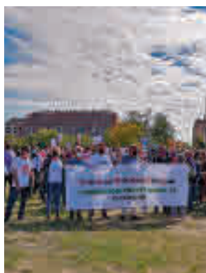
La protesta vecinal

Los residentes denuncian que esta actividad traerá masificación, "un terrible impacto acústico" y problemas de movilidad y contamina-