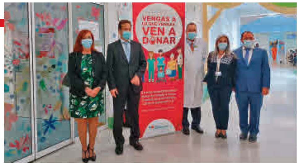
La Comunidad de Madrid pide a los ciudadanos que donen sangre

Las personas interesadas en donar sangre pueden consultar horarios y direcciones de hospitales y unidades móviles en la página web Madrid.org/donarsangre o en el número de teléfono gratuito 900 30 35 30.