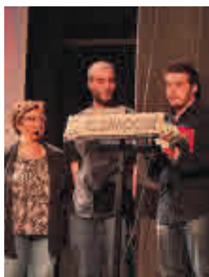
Uno de los premiados

Los cortometrajes finalistas son ‘Amateurs’, ‘Caníba-