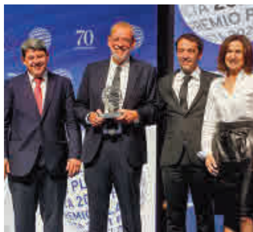
Los ganadores del último Premio Planeta

EL PERIÓDICO GENTE NO SE RESPONSABILIZA NI SE IDENTIFICA CON LAS OPINIONES QUE SUS LECTORES Y COLABORADORES EXPONGAN EN SUS CARTAS Y ARTÍCULOS