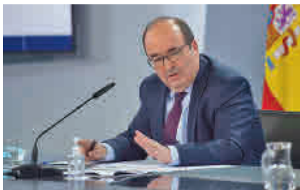
El ministro de Deportes, Miquel Iceta

De este modo reaccionaron ambos a las palabras del ministro de Cultura y Deportes, Miquel Iceta, quien aseguraba que "si Madrid presenta una candidatura a los Juegos Olímpicos va a tener el apoyo total y absoluto del Gobierno de España. No lo dudéis". "Necesitamos retos", lan-