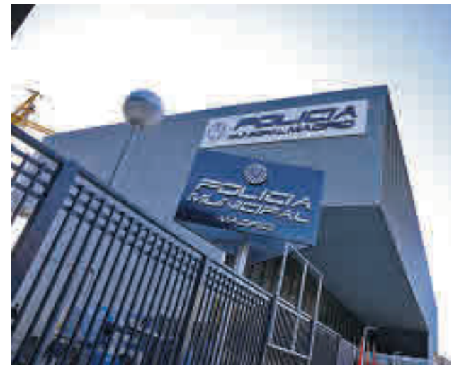
La fachada de las nuevas dependencias

gentedigital.es Toda la actualidad de los distritos de Madrid, en nuestra web.