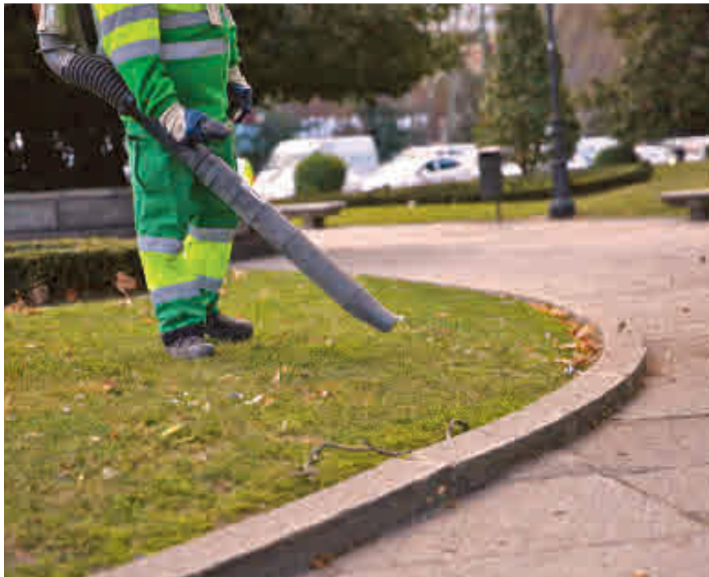
Un barrendero utiliza una sopladora en una calle del Centro de la capital

Los nuevos pliegos de condiciones de prestación del servicio que estarán vigentes durante los próximos seis años, recogen, además, el aumento en un 16% el número de los medios mecánicos y la obligación de que los adjudicatarios tengan la mayor parte de los vehículos y maquinaria cero emisiones y ECO. Por otro lado, y a diferencia del actual contrato