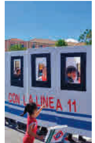
Una de las reivindicaciones

La Asociación de Vecinos Carabanchel Alto critica que las obras del intercambiador de Valdebebas vayan a comenzar antes que las de Conde de Casal y la ampliación de la línea 11 de Metro. “Desde que en 2017 se anunciase las obras de prolongación de la línea 11 de metro, desde Plaza Elíptica a Conde de Casal, y que estaría en funcionamiento en 2023, las autoridades madrileñas no han sido capaces de iniciar dichas obras”, aseguran desde este colectivo. Estos residentes entienden que esta construcción de Valdebebas responde a un “inte-