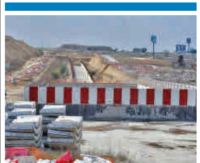
Obras del tren de Móstoles a Navalcarnero

La Policía Local de Valdemoro ha detenido a una mujer por agredir a dos agentes que mediaban en un conflicto por la custodia de una menor.