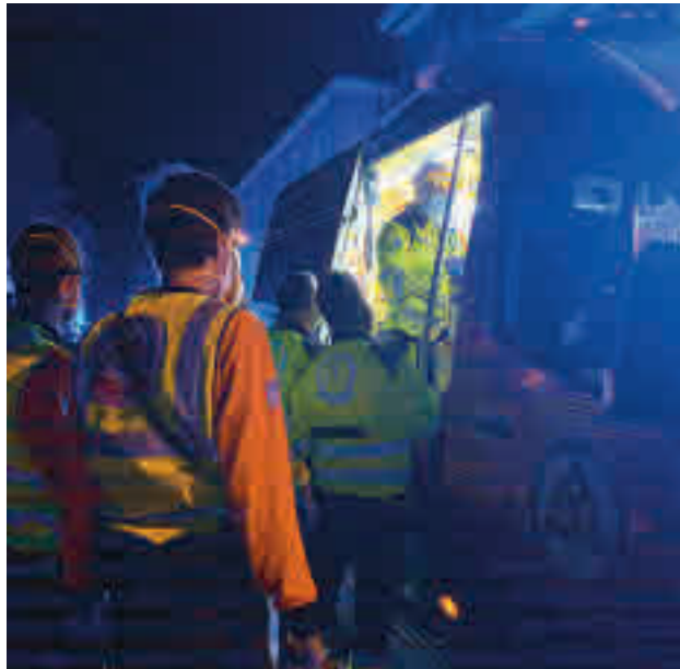
Sanitarios atienden a la víctima de la última agresión

Los entornos de los institutos Celestino Mutis (Villaverde), Ciudad de Jaén, Tierno Galván y San Fermín (Usera) son algunos de los habituales lugares de captación de jóvenes, sobre todo de segundo y tercer curso de la ESO, por parte de las bandas latinas. Otros son el IES Isaac Peral de Torrejón de Ardoz, el Raimundo Lulio de Puente de Vallecas, el Gómez Moreno de San Blas y los colegios Santo Domingo Savio y Jesús María de Si-