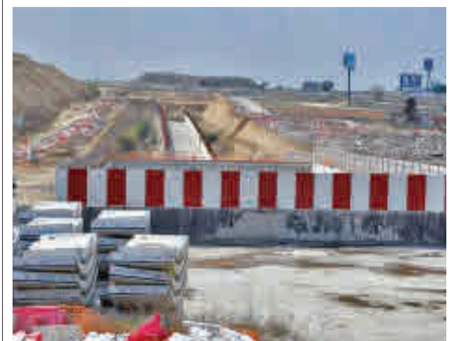
Obras del tren de Móstoles a Navalcarnero

La Policía Local de Valdemoro ha detenido a una mujer por agredir a dos agentes que mediaban en un conflicto por la custodia de una menor.