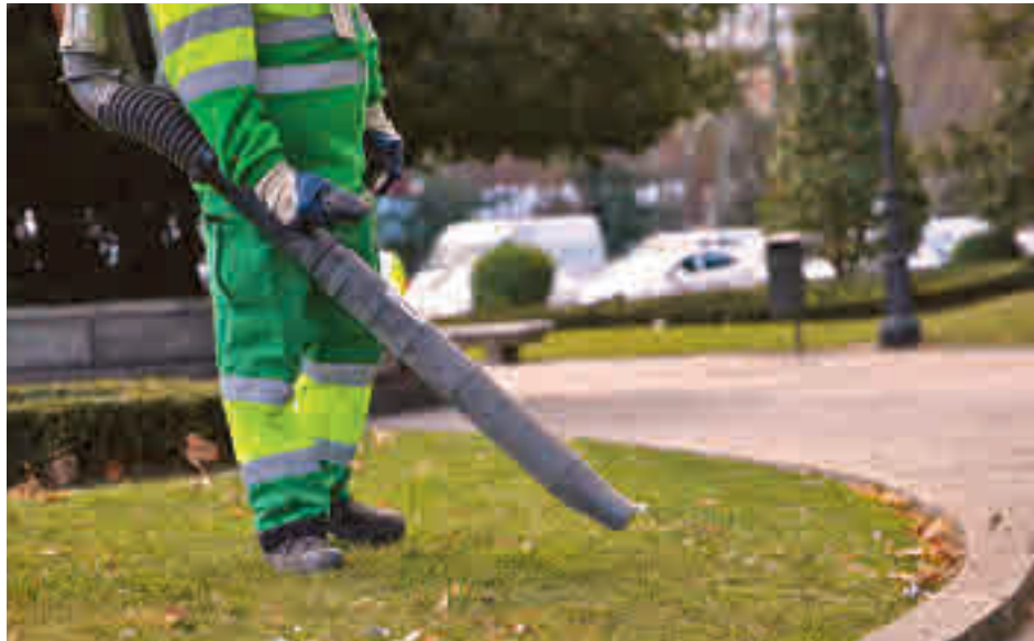
Un barrendero utiliza una sopladora en una calle del Centro de la capital

Cerca de 2.000 trabajadores más en la calle y un incremento presupuestario de un 45% con respecto al actual, que data de 2013 (282 millones anuales), son las señas de identidad del nuevo contrato de limpieza que comenzará a funcionar en la capital el 1 de noviembre, según adelantó el alcalde, José Luis Martínez-Almeida, la semana pasada. “Tenemos vía libre para comenzar su ejecución, que comenzará previsiblemente