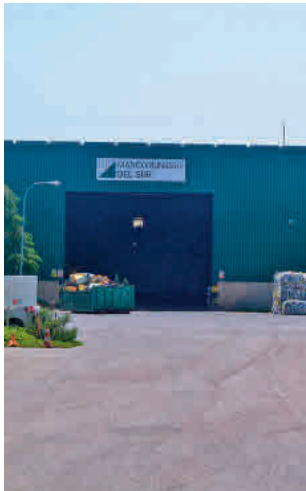
Actual vertedero de Pinto

El acto tendrá lugar a partir de las 19 horas en la plaza de la Piña de esta localidad con el objetivo de reclamar a la Mancomunidad del Sur que renuncie a este proyecto y se apueste por una gestión de residuos inspirada por los principios de la economía circular y a favor de la lucha con-