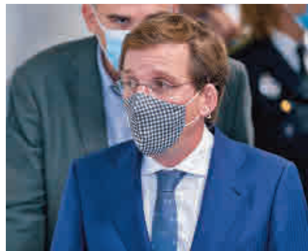
José Luis Martínez-Almeida, alcalde de Madrid