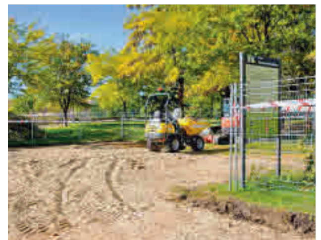
Obras en el parque Hermanos Machado

El importe previsto para la realización de la obra asciende a 310.772,46 euros. Con este, serán 14 los parques remodelados en esta legislatura en Boadilla del Monte.