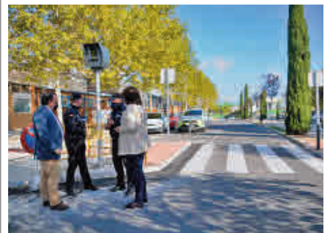
Una de las dos nuevas cajas para podrán alojar el radar móvil

Por último, el acuerdo recoge la habilitación de créditos para la renovación e instalación de juegos infantiles inclusivos en los parques, la redacción de un proyecto de mejora del Parque Forestal Adolfo Suárez, la cubierta de las gradas del campo de fútbol del Pradillo, así como la renovación de vestuarios y sustitución de la valla exterior.