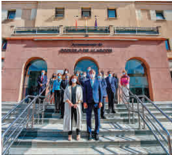
Un momento de la firma del documento

En el texto se recoge el compromiso de realizar las siguientes obras públicas: