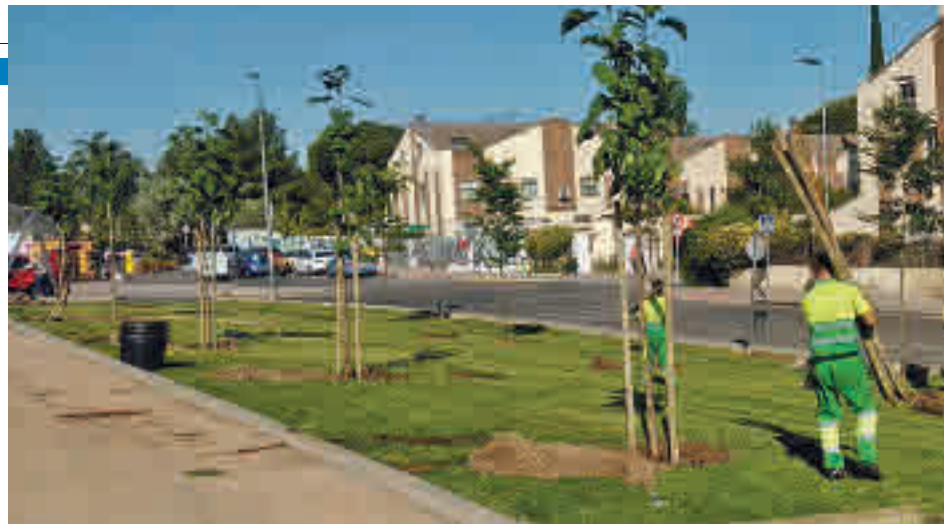
Labores de plantación en Rivas Vaciamadrid

Se repartirán entre calles y parques de la ciudad ● Serán ejemplares de más de treinta especies diferentes