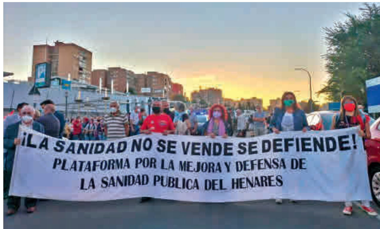
Uno de los mensajes que pudo verse durante la marcha