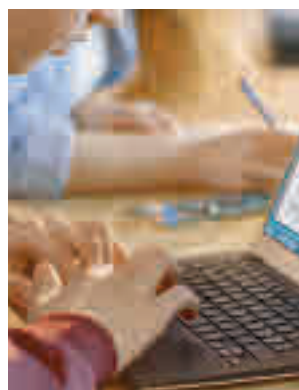
Más recursos tecnológicos

La convocatoria se puso en marcha el pasado 15 de julio con la apertura del proceso para que las personas inte-