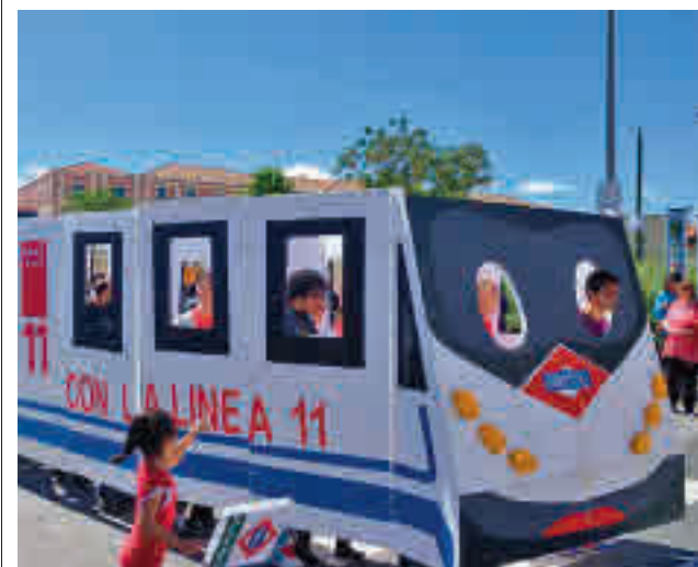
Uno de los actos reivindicativos vecinales

La zona Sur de la capital es frecuentemente el escenario de sus enfrentamientos, el último, el grave apuñalamiento que sufrió un joven de 17 años este mismo miércoles 20 de octubre en la calle de Estroncio (Villaverde). Horas antes, hubo un altercado sin heridos pero con dos detenidos en la estación de Cercanías de Orcasitas (Usera).