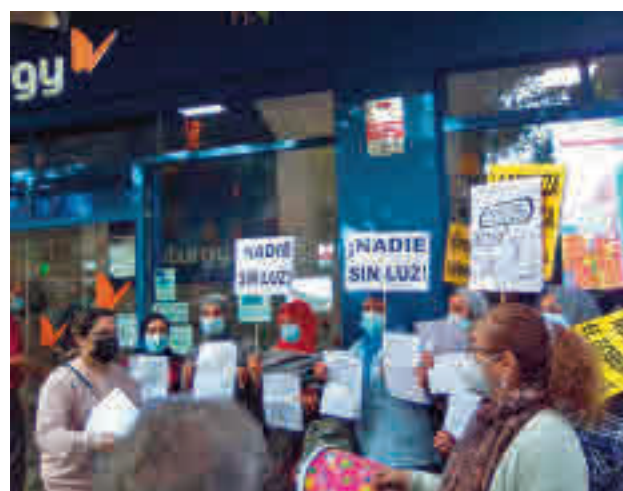
Un momento de la concentración en la calle de Pedro Laborde