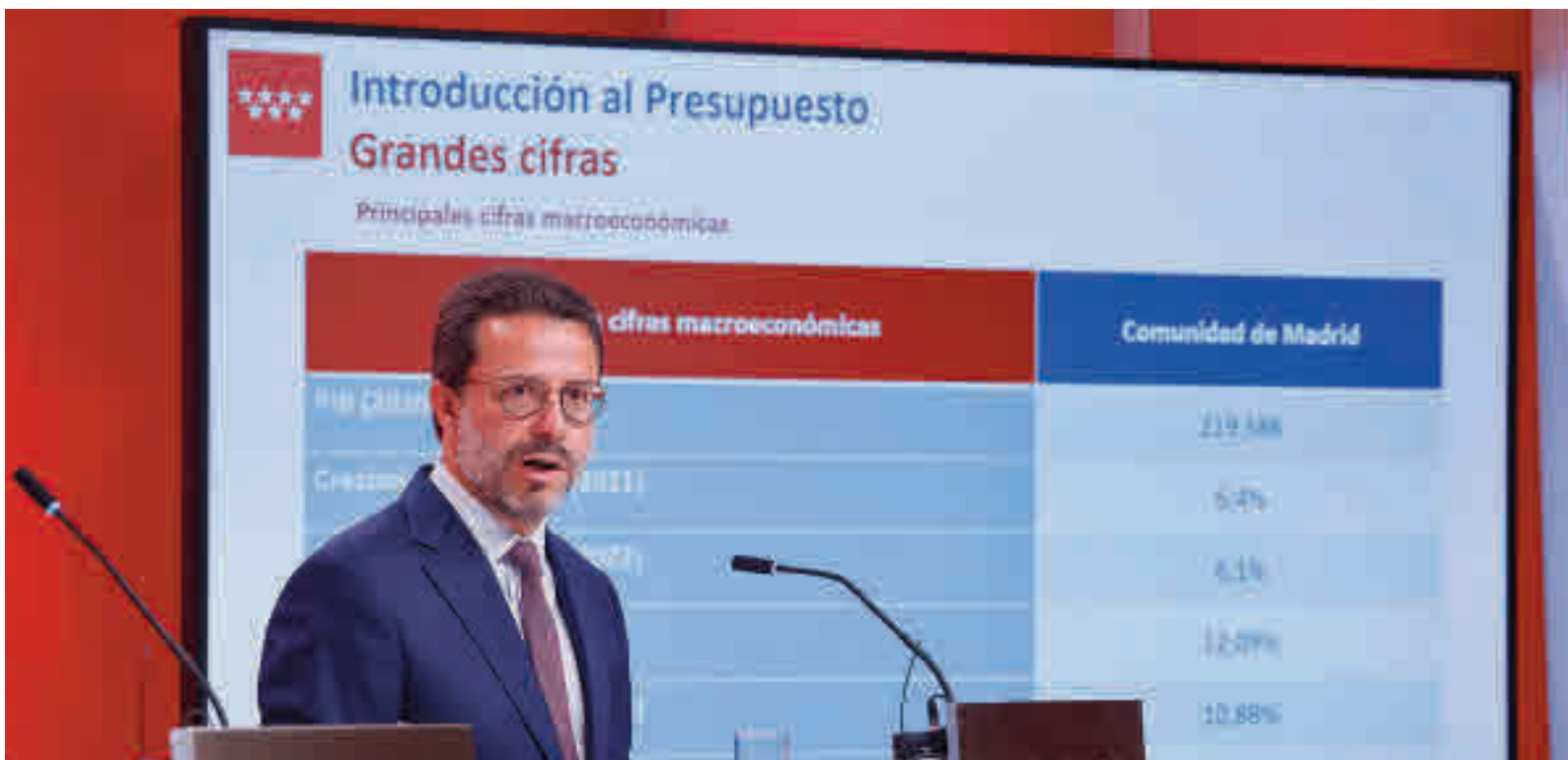
Javier Fernández-Lasquetty presenta el proyecto de presupuestos que se ha enviado a la Asamblea