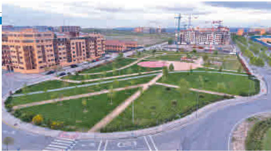
Fue la mayor participación en una consulta de este tipo en la ciudad

Además el alcalde, Pedro del Cura, escribirá una carta a la presidenta de la Comunidad de Madrid, Isabel Díaz Ayuso, en la que tiene previsto pedirle apoyo en este sentido toda vez que varias de las demandas de los vecinos en materia de servicios e infraestructuras dependen del ente regional. "Lo que nos dice esta consulta es que hay