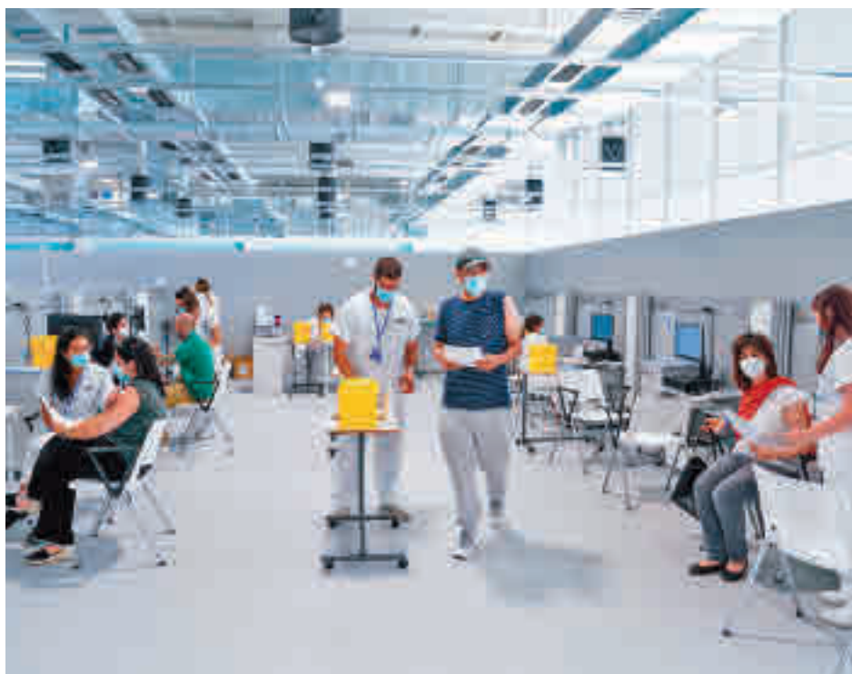
Vacunación en la Comunidad de Madrid