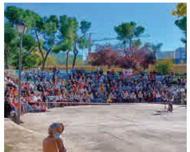
Un momento de la reunión vecinal en el parque Amós Acero

Toda la actualidad de los distritos de Madrid, en nuestra web