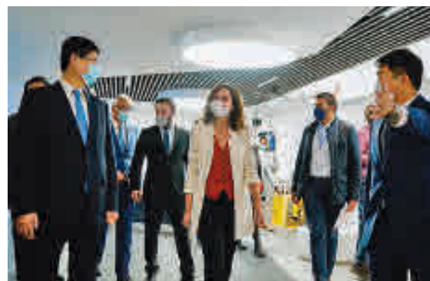
Acto de inauguración

Aprovechando el encuentro, Díaz Ayuso envió un men-