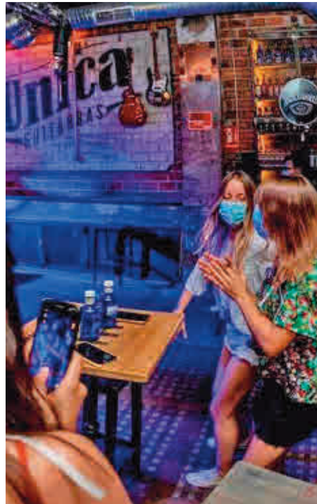
Mujeres en un local de ocio nocturno

“Pero también nos hemos vuelto más virtuales y hemos descubierto nuevos espacios para socializar que son igualmente efectivos y que nos