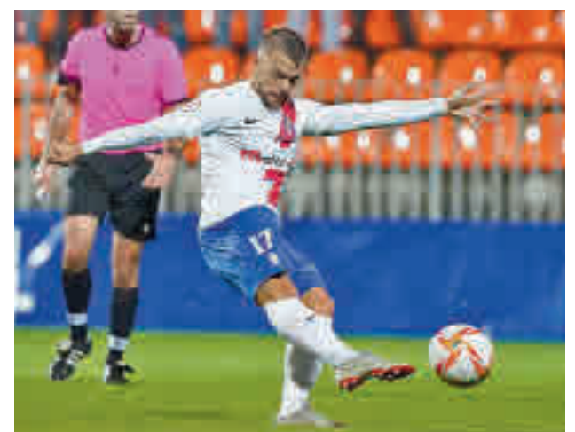
El Rayo cayó como local ante el Racing de Ferrol

Quien sí jugará como local es el San Sebastián de los Reyes, que recibirá (12 horas) al duodécimo clasificado, el Real Unión de Irún.