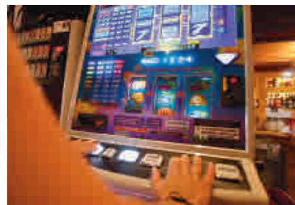
Uno de los impuestos es a las máquinas recreativas

recreativas en establecimientos de hostelería autorizados, del Depósito de Residuos y al recargo sobre el de Actividades Económicas (IAE), que actualmente es del 0%. Este anuncio se hizo hace ya varios meses, pero hasta ahora