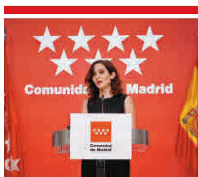
Presentación de la rebaja fiscal