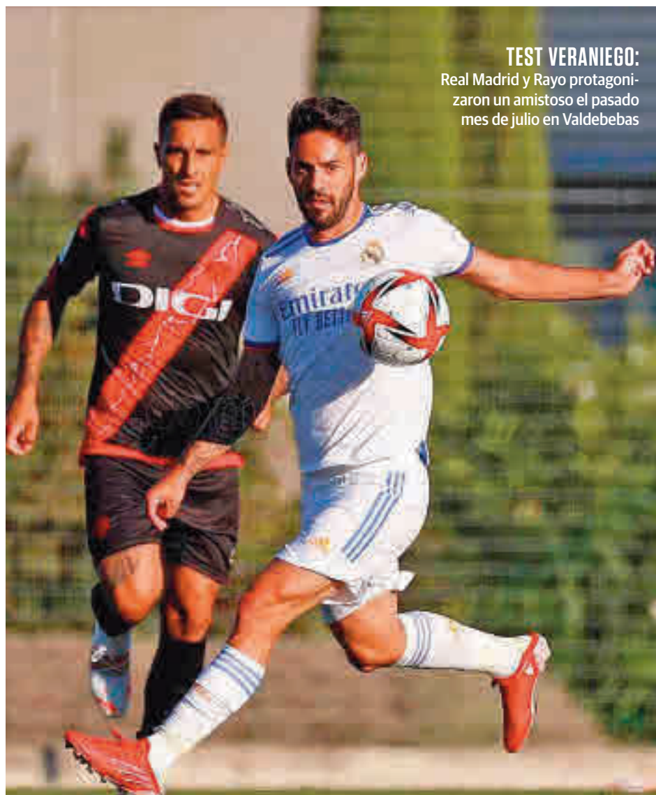
TEST VERANIEGO: Real Madrid y Rayo protagonizaron un amistoso el pasado mes de julio en Valdebebas

Mirando al pasado, este derbi se ha disputado en 18 ocasiones en Primera División en el Santiago Bernabéu, con un balance muy favorable al Real Madrid: 15 triunfos, dos empates y una victoria visitante. En todos esos antecedentes ha habido de todo,