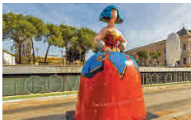
La figura instalada en la Plaza de Colón

diciembre. La cuarta edición de la exposición urbana ‘Meninas Madrid Gallery’ tiene como lema ‘Una ventana al mundo’ y está compuesta de con medio centenar de esculturas de 1,80 metros de altura, interpretadas y patrocinadas de forma solidaria por diferentes empresas y artistas.