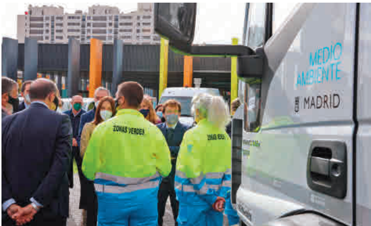
El primer edil conversó con varios trabajadores de limpieza