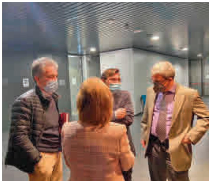
El edil de Carabanchel informó del proyecto a los empresarios

Arrancarán las obras correspondientes a la primera fase que tendrán una duración de cinco meses • Consistirán en el trazado de viales y aceras, zonas verdes y mobiliario urbano