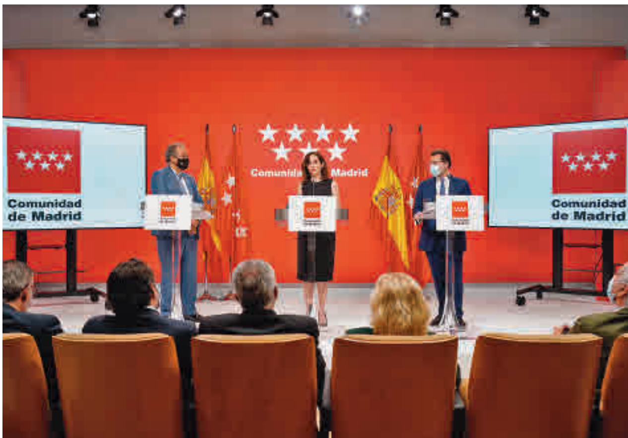
Presentación de la rebaja del IRPF tras el Consejo de Gobierno