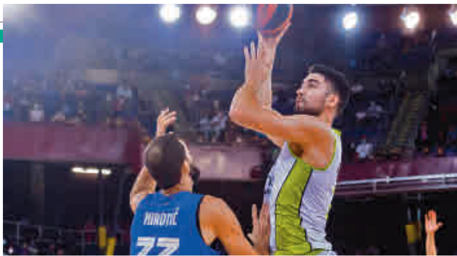
El Urbas dejó buena imagen en Barcelona

Con esa delicada situación en la tabla, al Urbas no le queda más remedio que apelar a su mejor versión para un tramo del calendario realmente complicado: después de la visita al Palau, este sábado (18 horas) abre la jornada viajando a la pista de un UCAM Murcia que es quinto,