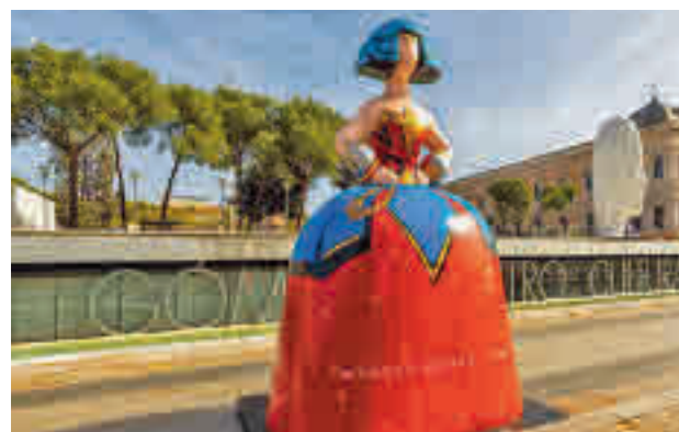
La figura instalada en la Plaza de Colón

diciembre. La cuarta edición de la exposición urbana ‘Meninas Madrid Gallery’ tiene como lema ‘Una ventana al mundo’ y está compuesta de con medio centenar de esculturas de 1,80 metros de altura, interpretadas y patrocinadas de forma solidaria por diferentes empresas y artistas.