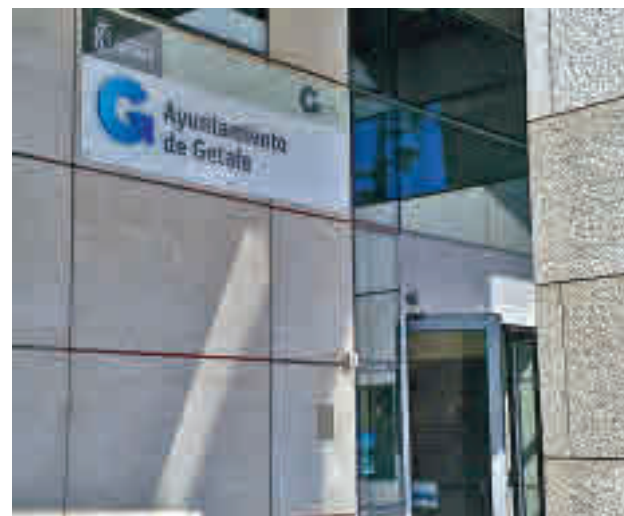
Ayuntamiento de Getafe