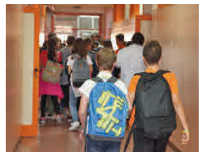
Jóvenes estudiantes de Getafe

Gracias a la participación de 50 establecimientos hosteleros, los ciudadanos tendrán ocasión de degustar a un precio de 1,80 euros, una gran variedad de especialidades culinarias. Cada ciudadano que participe podrá elegir entre los tres mejores pucheros y entrará en un sorteo de cenas para dos personas, visita a una fábrica de cerveza o una noche de hotel.