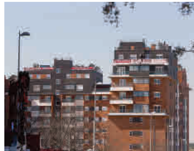
Unas viviendas en venta

También Madrid (17%) ocupa un lugar de privilegio en lo que al medio plazo se refiere al ubicarse en el segundo lugar, únicamente por detrás de Andalucía (18%).