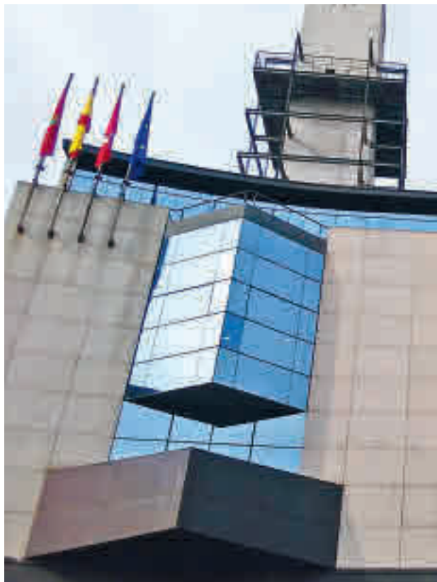
Ayuntamiento de Getafe

deberán ser aprobadas en el Pleno en las próximas semanas y se cimentan en ejes como el empleo, el bienestar social y la mejora de las infraestructuras públicas con el objetivo de "favorecer la recuperación económica y poner en valor el aprendizaje de la pandemia". A las inversiones se destinarán en torno a 36 millones de euros, "recogiendo gran parte de los proyectos que fueron aplazados durante la pandemia mientras se centraban los recursos en las ayudas sociales".