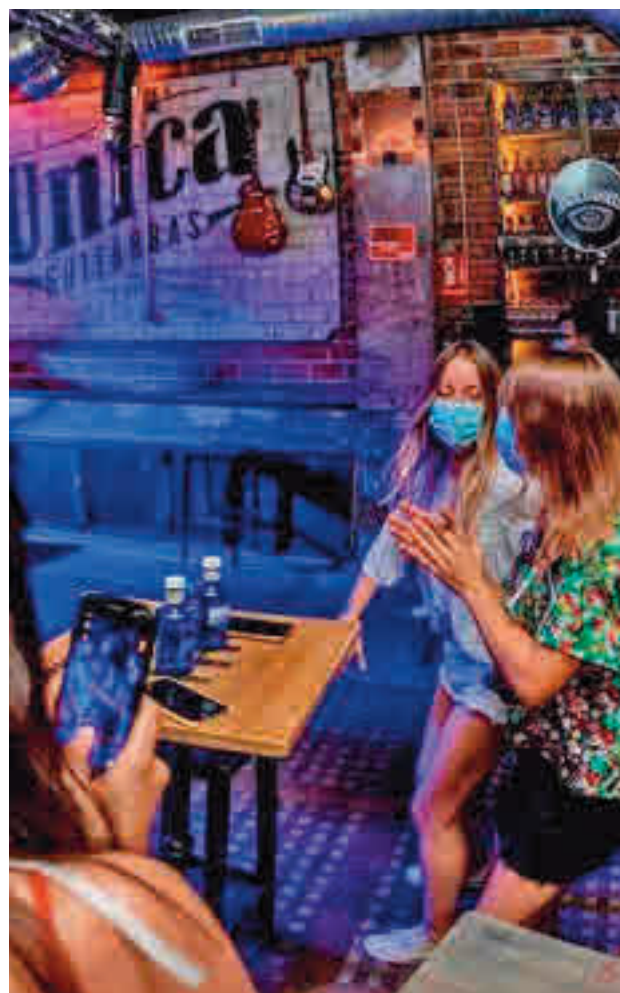
Mujeres en un local de ocio nocturno

"Pero también nos hemos vuelto más virtuales y hemos descubierto nuevos espacios para socializar que son igualmente efectivos y que nos