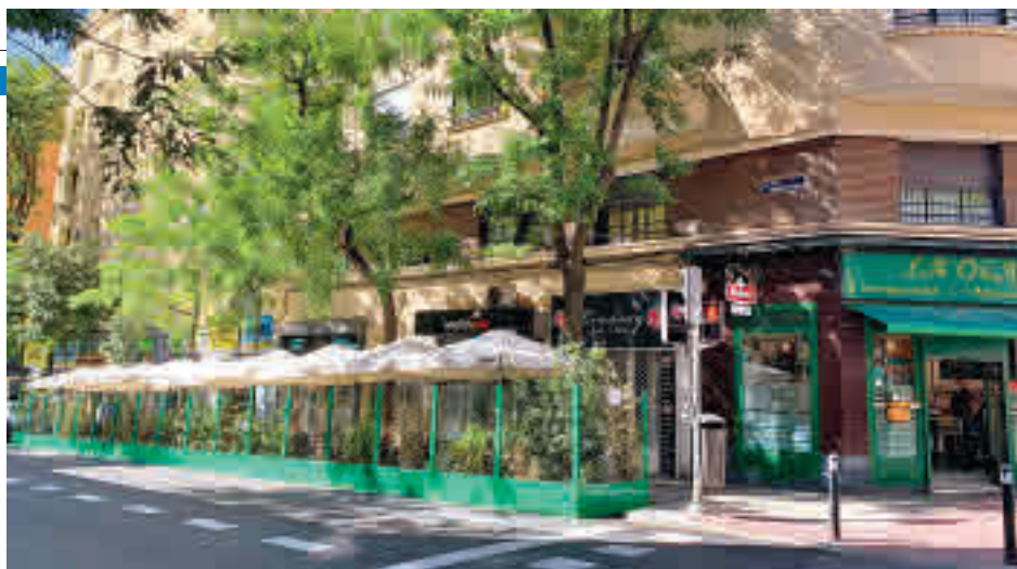
Fue la mayor participación en una consulta de este tipo en la ciudad

El proyecto de ordenanza contempla su desaparición de Ponzano, Santa Engracia o Gaztambide de cara al próximo 2022