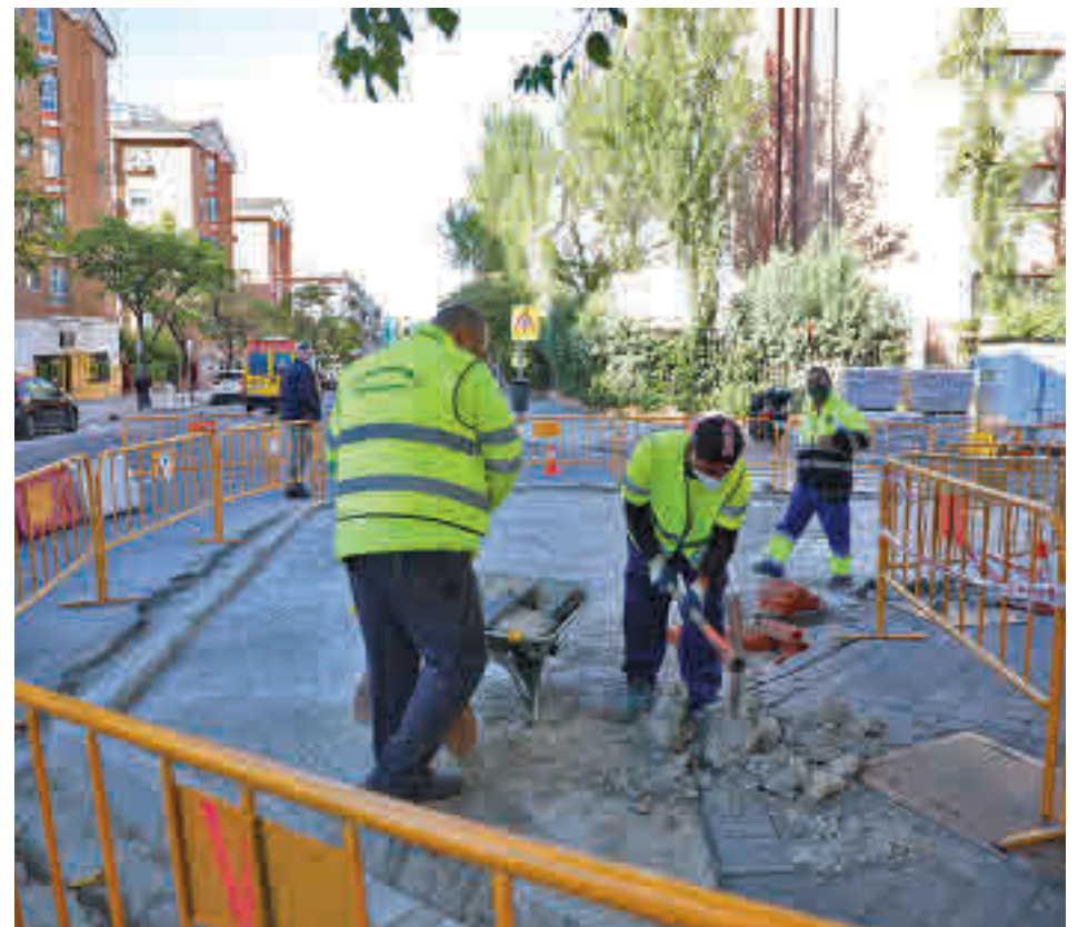
Varios operarios trabajan en la ampliación de una acera en la capital

El proyecto contempla la intervención en aceras, calzadas, aparcamientos y pasos de peatones, así como la señalización de vados en los distritos de Arganzuela, Centro y Chamberí