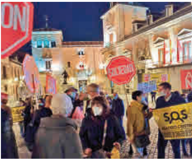
Un momento de la protesta del pasado 10 de noviembre