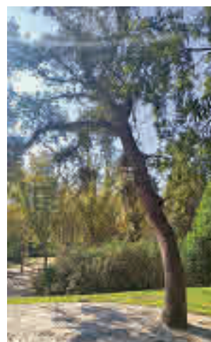
Los árboles del nuevo jardín

vajada” al aparecer rodeadas de cemento varias encinas del jardín situado junto al Meteorológico del parque de El Retiro. “¿Han cementado encinas en el nuevo jardín junto al Meteorológico del Retiro? Sí”, confirma este colecti-