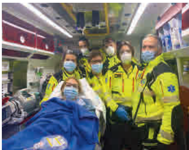
La mamá, junto al equipo médico que le ayudó en el parto

Tanto la madre como su hija, que pesó 3,6 kg y se llamará Olivia, se encuentran en buen estado de salud.