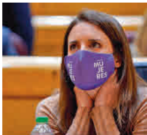
La ministra de Igualdad, Irene Montero

EL PERIÓDICO GENTE NO SE RESPONSABILIZA NI SE IDENTIFICA CON LAS OPINIONES QUE SUS LECTORES Y COLABORADORES EXPONGAN EN SUS CARTAS Y ARTÍCULOS