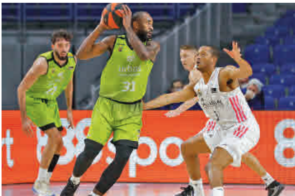
Imagen de uno de los derbis de la pasada temporada