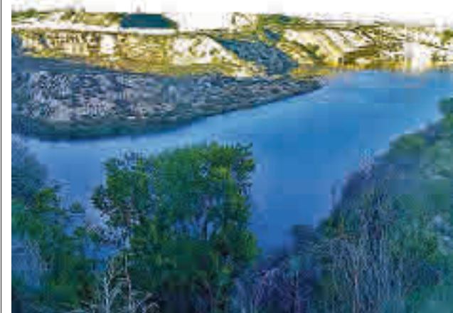
Los humedales surgieron por la extracción de sepollita

Por su parte, Niño se mostró satisfecho de que los vecinos tengan un lugar donde poder formar el talento cultural del futuro y desarrollar actividades de ocio. Asimismo, consideró que este centro "estimulará también la vida de los barrios a su alrededor con actividades y programación musical".