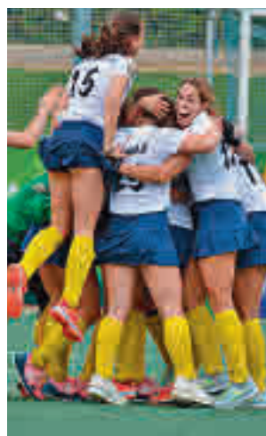
Club de Campo

dor el pasado fin de semana decidiendo la lista final de participantes en la Copa del Rey y la Copa de la Reina que se celebrarán este viernes 12