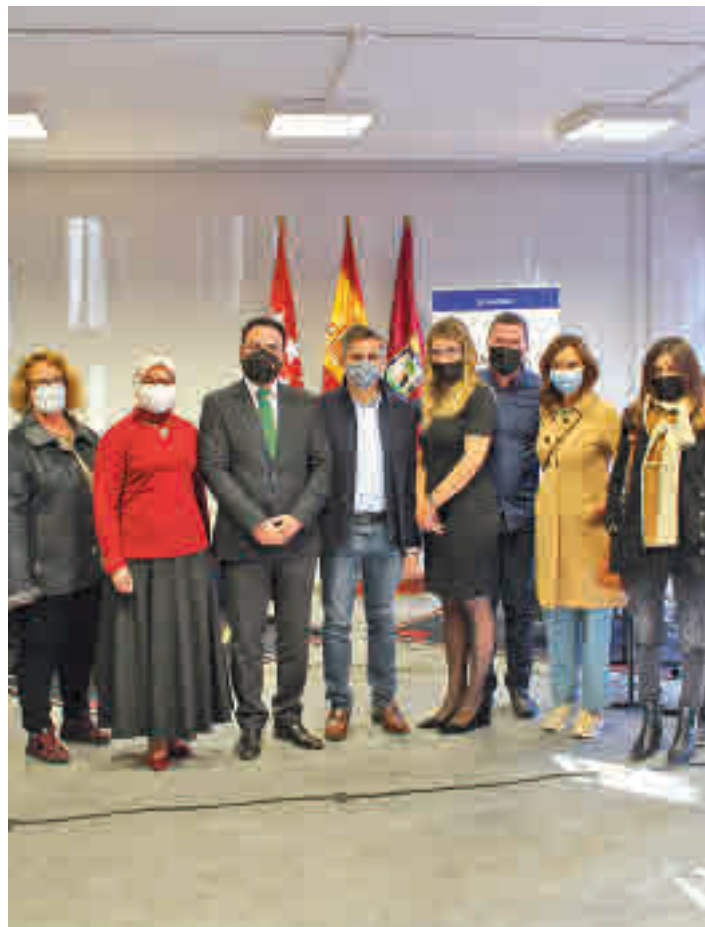
Las autoridades municipales que acudieron al estreno del centro

Para el alumnado de cuatro a siete años, el programa contempla Música y Movimiento, una introducción lúdica a la música que permite el desarrollo de las capacidades necesarias para la posterior práctica instrumental. Durante los seis cursos poste-