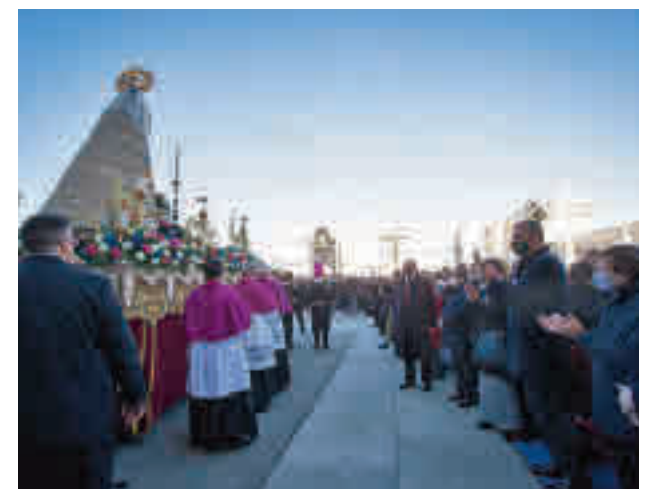
Un momento de la procesión de la patrona de la capital

El regidor expresó además su deseo de que "todos tengamos el corazón abierto para cumplir con nuestro principal compromiso: la atención a las necesidades de los más débiles y desfavorecidos, de manera que ningún madrileño quede desamparado" y para que "cada uno ponga su granito de arena en la construcción de una ciudad más caritativa y más justa".