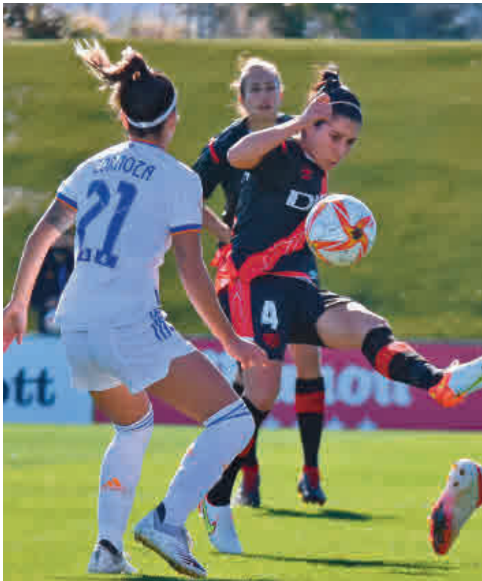
Imagen del derbi disputado el pasado fin de semana en Valdebebas

La situación ha llegado a manos de la Asociación de Futbolistas Españoles (AFE). El sindicato de jugadores ya está trabajando en defensa de la plantilla rayista, quien también reflejaba en su comunicado que trabaja "en un escenario de gran desigualdad, en cuanto a instalaciones, material y personal, en comparación con nuestros compañeros del primer equipo masculino, y es por ello que nos vemos obligadas a denunciar de nuevo, de forma pública, la situación que sufrimos a diario". La escasez de recursos se ha dejado no-