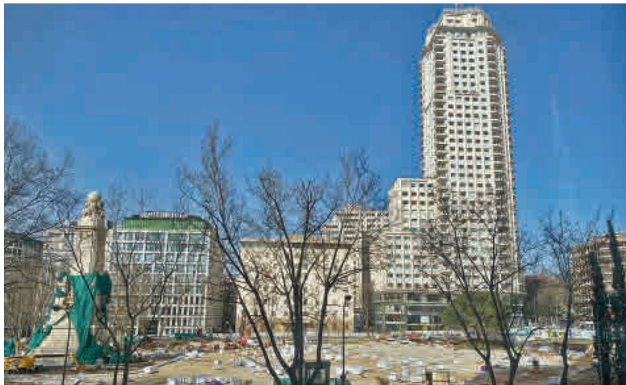
Las obras de reforma de Plaza de España

Un gran abeto natural de 18 metros, que fue instalado en la madrugada del 11 de noviembre, coronará la actuación. El árbol contará con 150 cordones luminosos de microlámparas que suman unos 1.800 metros y 27.000 puntos de luz y será una de las atracciones de la Navidad en la capital, cuyas luces se encenderán el próximo 26 de noviembre.