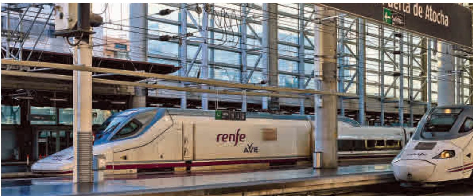
Trenes de alta velocidad en la estación de Puerta de Atocha