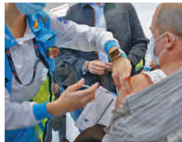
Vacunación en la Comunidad de Madrid

“El Ministerio de Sanidad, como proveedor de todas las vacunas contra la covid que reciben las CCAA debería haber previsto en su estrategia como país donante también la donación de las dosis de Janssen, tal y como ya hizo con AstraZeneca”, señalan desde la Comunidad.