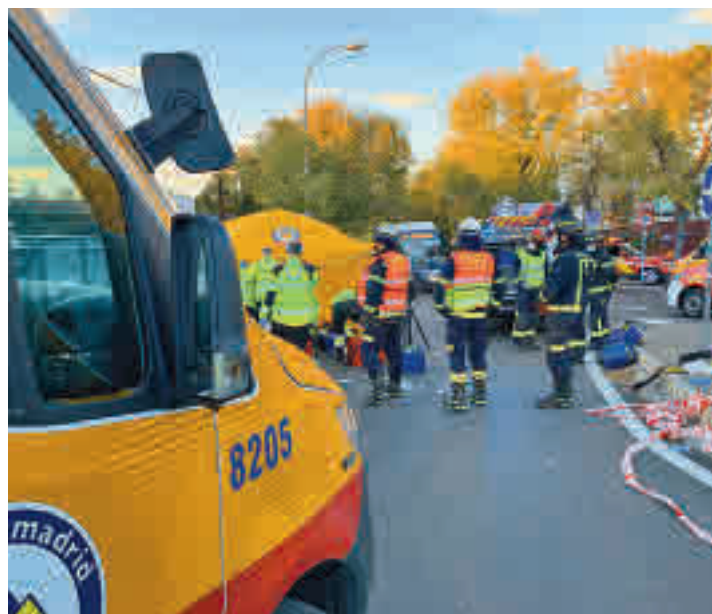
La intervención de los sanitarios a la puerta del centro

Una mujer que recogía a sus hijos embistió por un fallo en las marchas a 3 menores • Una de ellas, de 6 años, falleció casi en el acto y las otras dos, de 10 y 12 años, siguen recuperándose