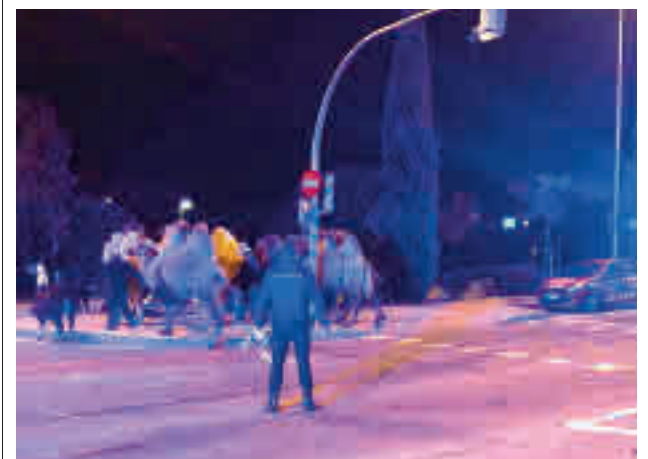
Un momento de la actuación policial

Por otro lado, alertan de la necesidad de dotar de recursos a los servicios públicos sanitarios con un plan específico sobre salud mental. “El centro de salud de San Cristóbal carece de personal y tiene listas de espera indecentes para la problemática que sufrimos”, añaden. Además, demandan un plan especial para personas en situación de calle y extrema pobreza, que habiliten alternativas para poder rehacer una vida digna acorde con los derechos humanos. Por último, frente a la estigmatización que sufre el barrio piden evitar los bulos.