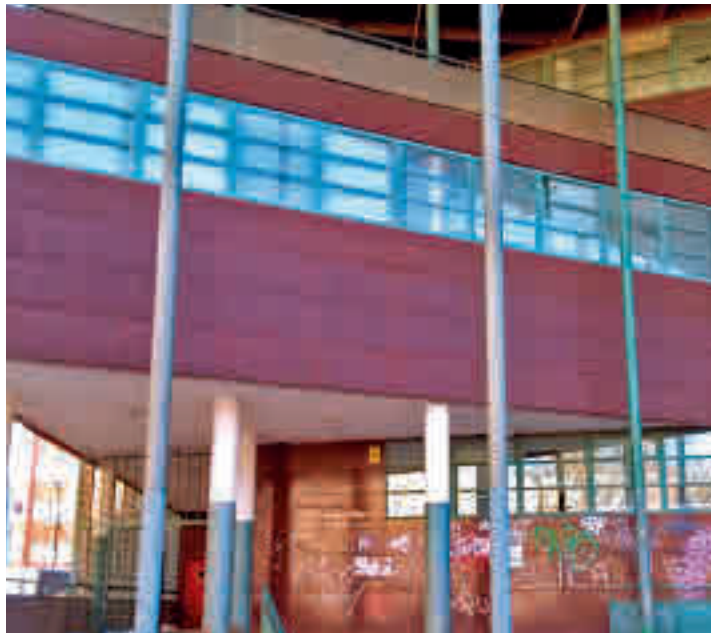
El entorno donde tuvo lugar el suceso el pasado 5 de noviembre

El último suceso acaecido el 5 de noviembre que se saldó con el fallecimiento de un hombre abatido por la Policía Nacional, ha provocado la reacción de los vecinos de San Cristóbal de los Ángeles. En un comunicado, al que se han adherido otros 14 colectivos, la Asociación Vecinal La Unidad denuncia el continuado abandono institucional que sufre su barrio al