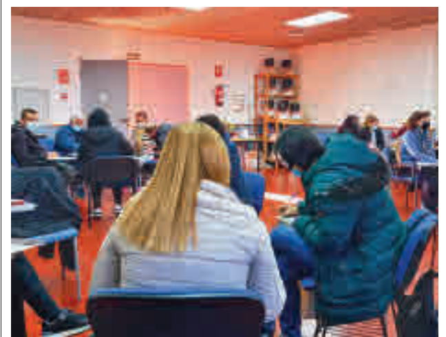
Proceso de selección