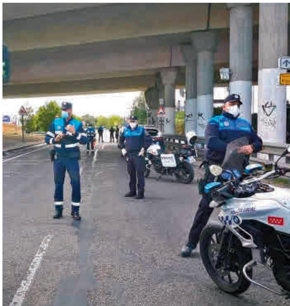
Policía Local de Leganés

Más leve fue el incremento de los robos con violencia e intimidación. De los 169 que se contabilizaron hace un año se ha pasado a 174, lo