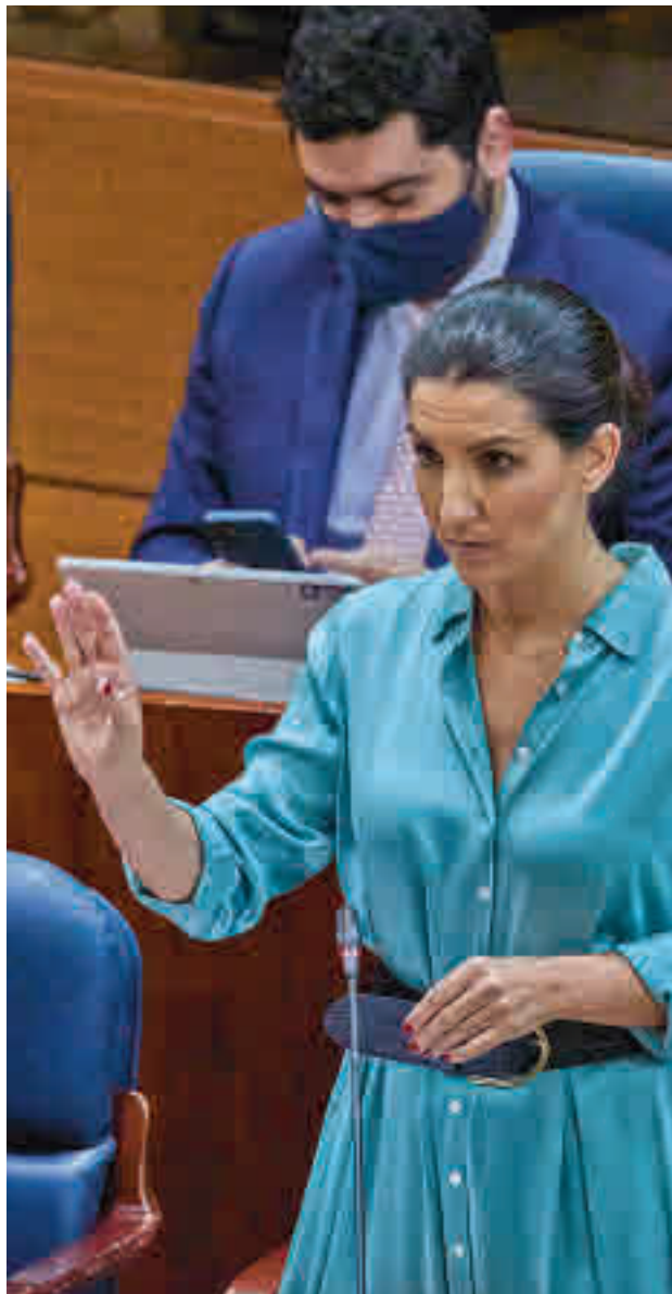
Rocío Monasterio, en la Asamblea de Madrid

Monasterio ha defendido que se conocen sus reclamaciones porque “se han ido registrando propuestas” para que se conozcan sus posiciones, como, por ejemplo, la ‘Ley de Igualdad’ de la formación. Sobre esa mesa de negociación se encuentran los centros de menores, sobre los que ha asegurado que se están usando como “soldados” por grupos para “atraer a la gente de la calle”. La portavoz ha censurado que se gaste “más dinero en promocionar consejerías” que lo que se dedica a las becas para la educación de 0 a 3 años. “Es fundamental también que ningún joven madrileño se quede sin FP o sin Bachillerato, mientras las empresas re-