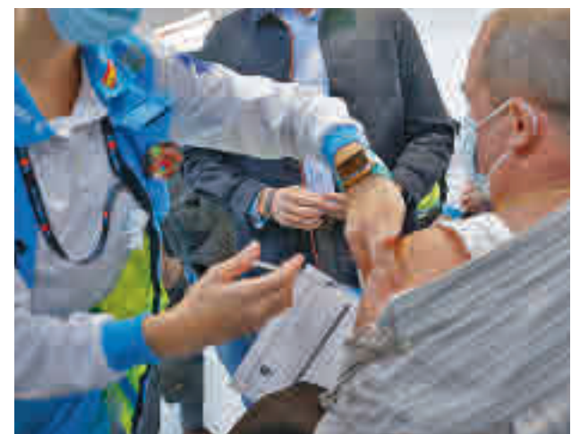
Vacunación en la Comunidad de Madrid

“El Ministerio de Sanidad, como proveedor de todas las vacunas contra la covid que reciben las CCAA debería haber previsto en su estrategia como país donante también la donación de las dosis de Janssen, tal y como ya hizo con AstraZeneca”, señalan desde la Comunidad.