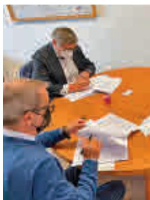
Firma del acuerdo

El convenio contempla una subvención económica por importe de 102.300 euros destinada a las entidades urbanísticas del polígono industrial Nuestra Señora de