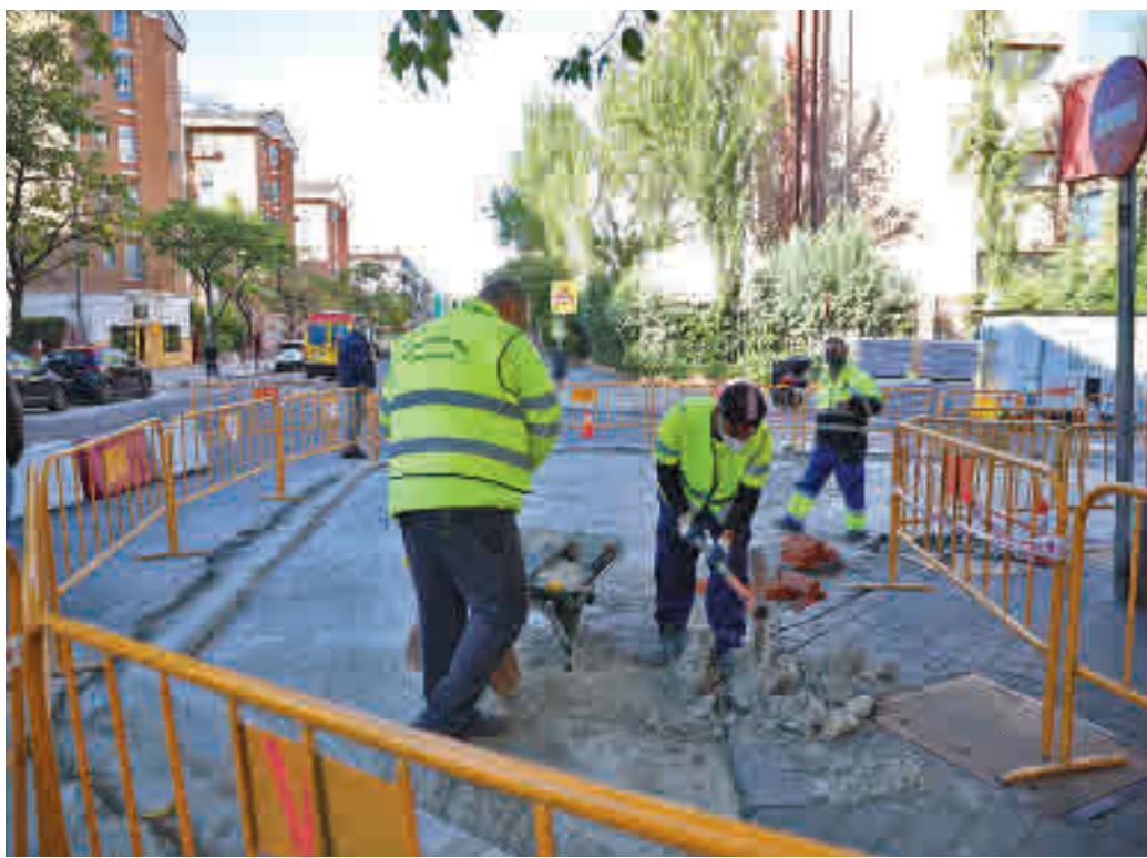
Varios operarios trabajan en la ampliación de una acera en la capital