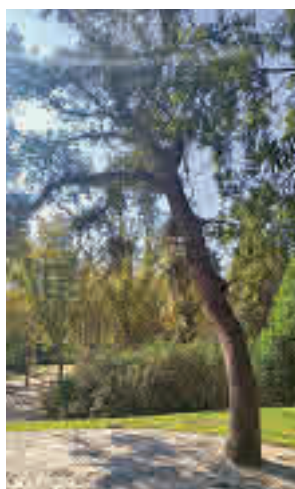
Los árboles del nuevo jardín

vajada” al aparecer rodeadas de cemento varias encinas del jardín situado junto al Meteorológico del parque de El Retiro. “¿Han cementado encinas en el nuevo jardín junto al Meteorológico del Retiro? Sí”, confirma este colecti-