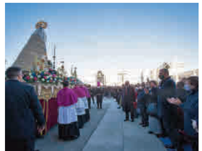
Un momento de la procesión de la patrona de la capital

El regidor expresó además su deseo de que "todos tengamos el corazón abierto para cumplir con nuestro principal compromiso: la atención a las necesidades de los más débiles y desfavorecidos, de manera que ningún madrileño quede desamparado" y para que "cada uno ponga su granito de arena en la construcción de una ciudad más caritativa y más justa".