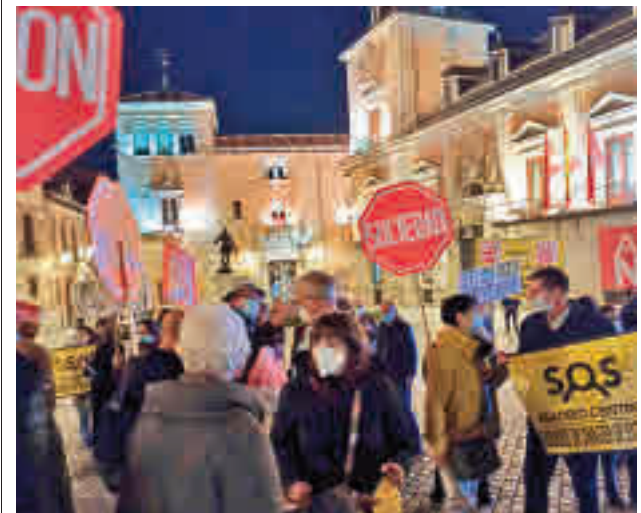
Un momento de la protesta del pasado 10 de noviembre

Por último, consideran inadmisibles “que una actividad económica privada que apenas representa el 5% de nuestra economía determine las condiciones de vida, la movilidad y la salud de los ciudadanos residentes en el entorno de las mismas”.