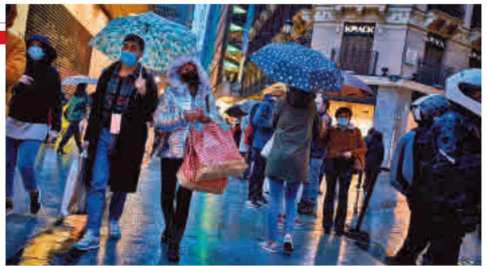
Compras previas a la Navidad

por los protocolos covid-19. El uso obligatorio de mascarillas haría que un 46% se sienta más cómodo comprando, seguido de los límites de aforo (35%) y una mayor atención al distanciamiento social (33%).