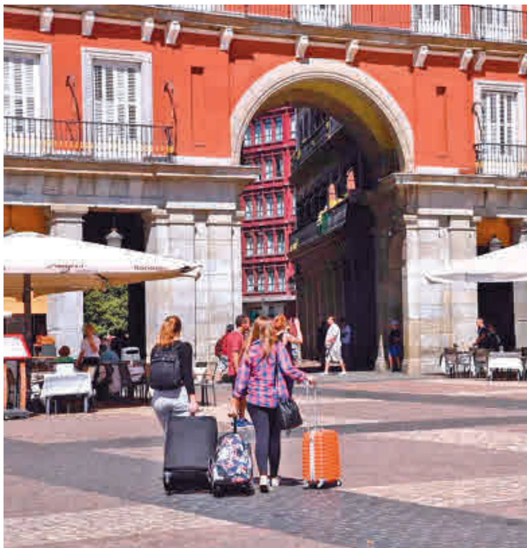
El turismo ha vuelto a las calles de Madrid

El Gobierno regional está ahora cuidando mucho el mercado americano, que se está recuperando más rápido de lo previsto, y para noviembre tienen prevista una campaña en la costa este para atraer a ese turista.