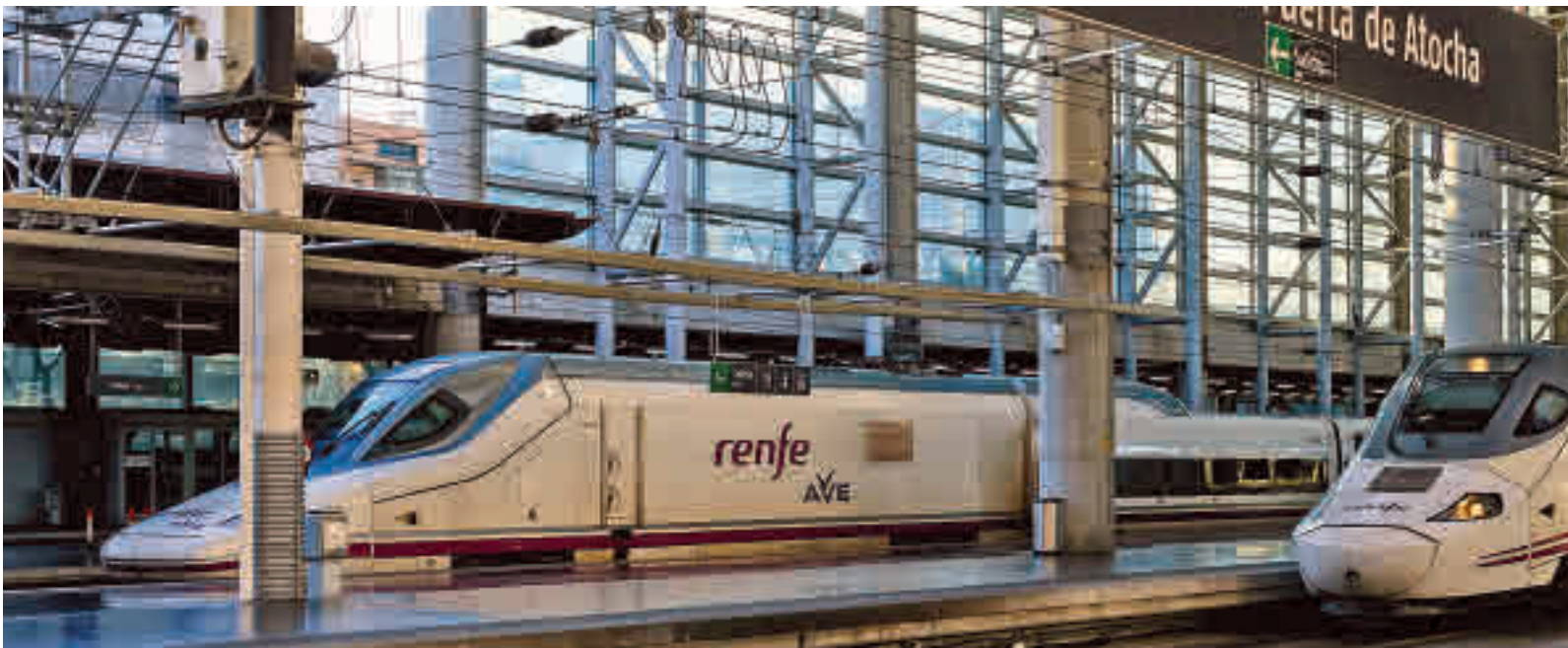
Trenes de alta velocidad en la estación de Puerta de Atocha