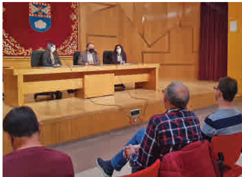
Presentación de la II Liga de Debate Escolar de Leganés

"Con este apoyo escolar no sólo ayudarás a estos estudiantes con sus asignaturas, sino que también les podrás proponer estrategias de trabajo autónomo y planificación de su tiempo y objetivos", animan a los universitarios desde el centro.