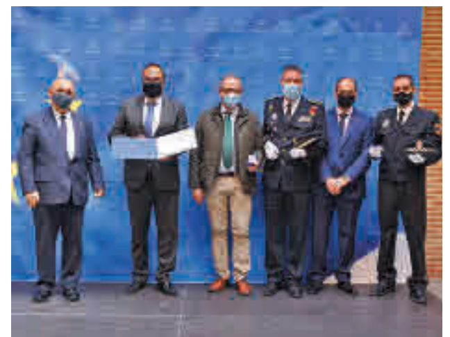
Entrega de los premios para el Agente Tutor

La Policía Local ofrece los otros recursos: 'Acoso escolar. Relaciones entre iguales', 'Del cole al insti', 'El uso de las redes sociales de forma segura' o 'Alcohol, otras drogas y conducción'.