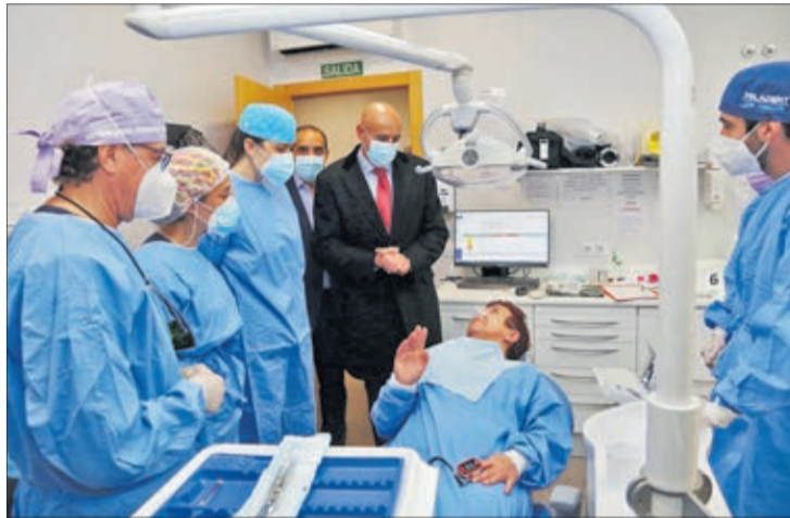
El alcalde de León visitó las instalaciones de la Clínica Solidaria del Colegio de Dentistas.

En la clínica se cumple un triple objetivo: formativo-social-sanitario y se desarrollan programas anuales de Postgrado que atraen a León a dentistas de toda España para actualizar conocimientos teóricos y prácticos de la mano de expertos del sector. Esto permite organizar