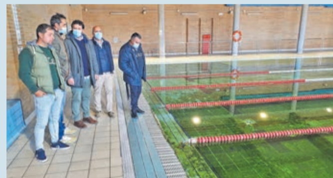
El equipo de gobierno constata el estado de abandono del polideportivo.

VILLAQUILAMBRE | EL AYUNTAMIENTO ASUMIRÁ EL CENTRO A PARTIR DEL 1 DE ENERO