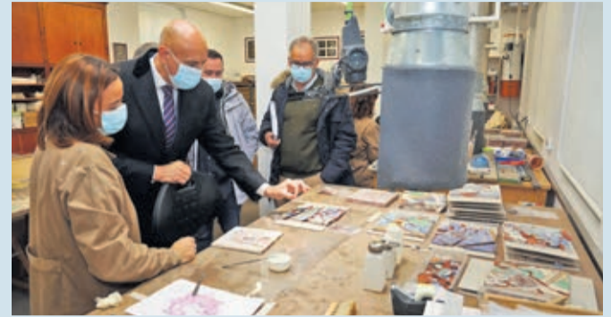
El alcalde ha supervisado el inicio de los trabajos de restauración.

PATRIMONIO | EL PROYECTO TIENE UN PRESUPUESTO DE 224.416 EUROS