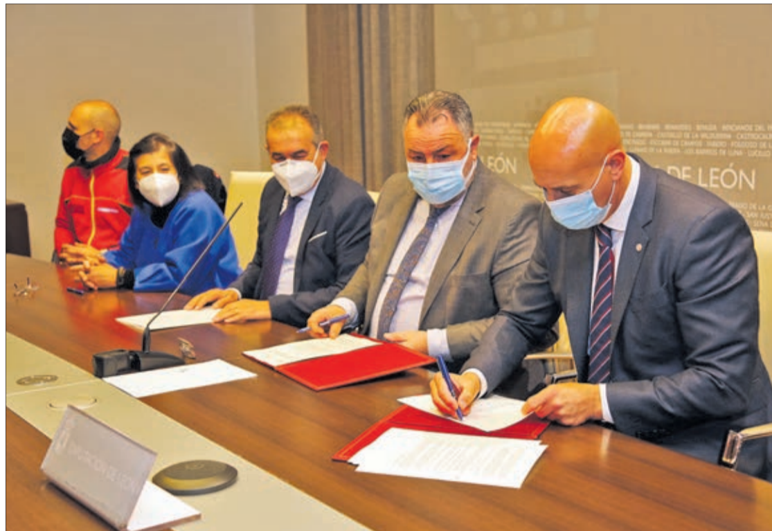
El alcalde de León y el presidente de la Diputación sellaron su colaboración para la prestación del Servicio de Bomberos en 14 municipios.

Para el alcalde, el convenio consagra la asistencia que ya se estaba prestando por parte de los Bomberos de León porque "es claro que siempre que hay un siniestro en la provincia, ha sido y es el Servicio de Extinción de Incendios de León el que acude, hasta el momento". Así, el Consistorio asume el compromiso de la salida inmediata en los municipios en los que exista riesgo para la vida de las personas tales como rescate en viviendas, en vehículos accidentados, así como el supuesto de incendios en inmuebles. El Servicio de Prevención y Extinción de Incendios