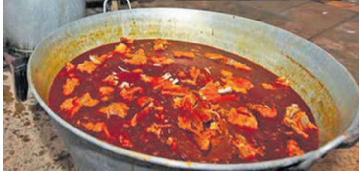
La degustación del plato de cecina de chivo el domingo por la mañana es muy esperada.

ria que sirve de reclamo cada año a varios miles de leoneses y foráneos en torno a la Feria. Por la tarde se podrán degustar las singulares sopas de chivo y cecina de chivo, una prueba gastronómica que tendrá lugar en una gran carpa adyacente al polideportivo de Vegacervera.