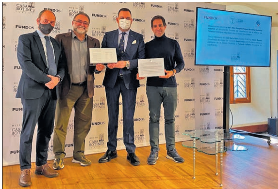
El documento de la Alianza de Cadenas Hoteleras se presentó en la Casa Botines de León, sede del Museo del Turismo.