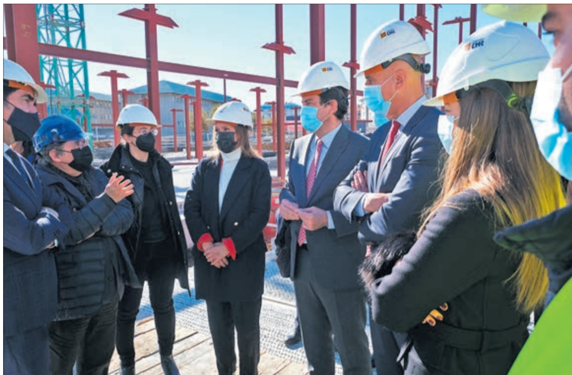
El presidente de la Junta visitó las obras del Conservatorio Profesional de Música que se está construyendo en la capital leonesa.

Un Conservatorio Profesional de Música moderno y funcional, cuyas obras está previsto que finalicen en enero de 2023 con la idea de que los alumnos lo puedan estrenar en el curso 2023-2024. Se da así respuesta, reco-