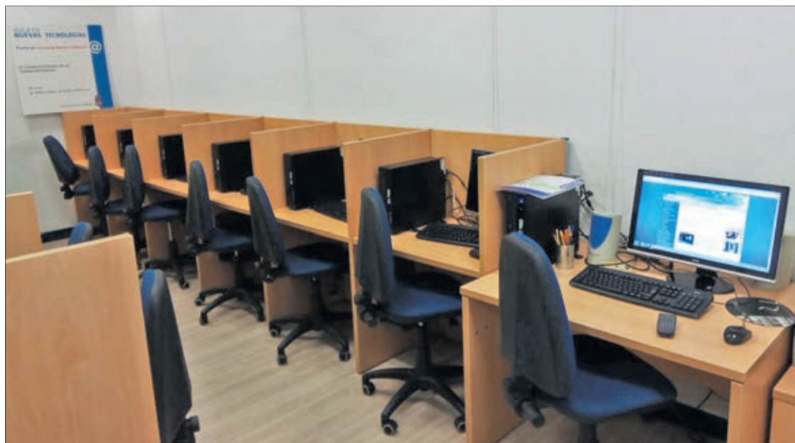
Aula de Nuevas Tecnologías del Ayuntamiento de San Andrés, desde la que el Ayuntamiento imparte cursos de digitalización.