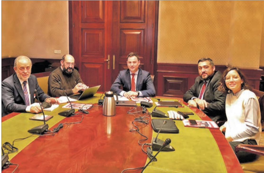
Reunión de los diputados nacionales del PSOE por León con la Asociación de Pendones del Reino de León en el Congreso de los Diputados.

“Los pendones de nuestros pueblos constituyen una de las tradiciones ancestrales más características de la cultura leonesa. Son una de las señas de identidad más emoti-