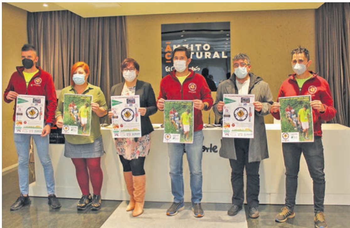
La presentación de la nueva edición de ‘Haga como haga’ reunió a organizadores y colaboradores en El Corte Inglés de León.