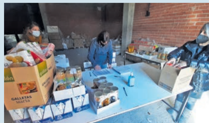
El reparto de alimentos del fondo FEAD beneficiará a 559 personas.

ATENCIÓN SOCIAL | 559 PERSONAS BENEFICIADAS EN ESTA FASE