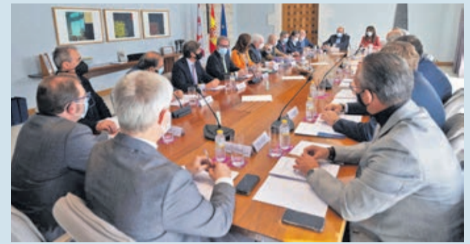
Pleno del Consejo de Cámaras de Comercio de Castilla y León del 10 de noviembre.

EMPRESAS | HA PRESTADO SERVICIOS Y PROGRAMAS A 38.146 USUARIOS