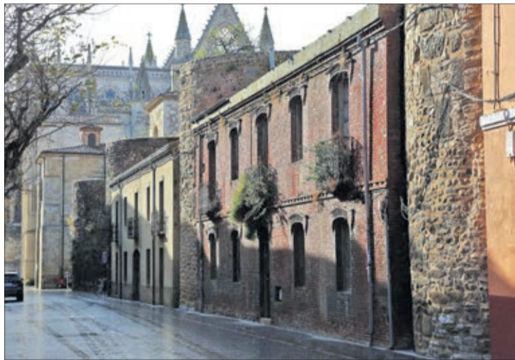
Los inmuebles adosados a la Muralla en Los Cubos que serán objeto de expropiación.

La ejecución de este proyecto de peatonalización será paralela al desarrollo de la Ronda de Penetración Norte, actualmente en fase muy avanzada de expropiación de los edificios situados entre las calles Fernando I y