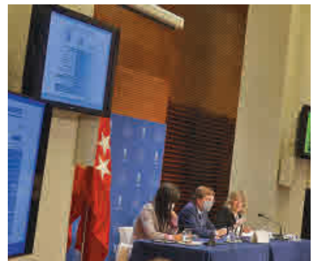
La presentación del borrador en el Palacio de Cibeles

El Ayuntamiento presentó el lunes 15 de noviembre su proyecto de presupuestos para 2022 que dotan a la capital de 5.481 millones de euros, 415 más que en 2021 (un 8,2% superior al actual). Fuentes municipales aseguran que se trata de unas cuentas orientadas a consolidar la recuperación económica y social para dejar atrás los efectos más duros de la pandemia covid-19 y de 'Filomena'. A partir de ahora, se abre el periodo de presentación de enmiendas con el horizonte puesto en su aprobación antes de fin de año, siempre y cuando el equipo de Gobierno munici-