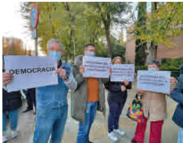
Los vecinos portaron diferentes pancartas