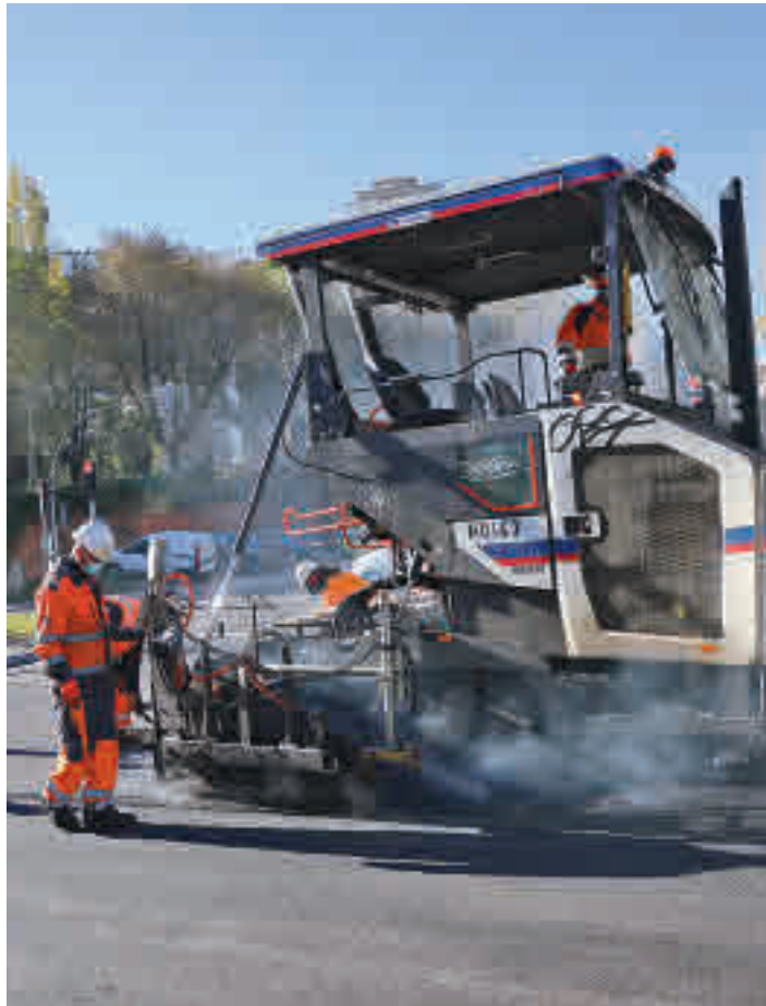
Los trabajos de asfaltado en la avenida de San Luis

EN 2021 SE HAN PRIORIZADO LAS CALZADAS EN PEOR ESTADO POR 'FILOMENA'