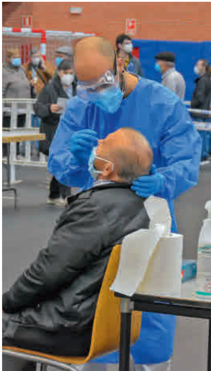
Cribado masivo con test de antígenos

La presidenta regional, Isabel Díaz Ayuso, planteó esa posibilidad este miércoles en una entrevista televisiva. “Vamos a ver si hacemos cribados masivos por parte de la Comunidad para que antes