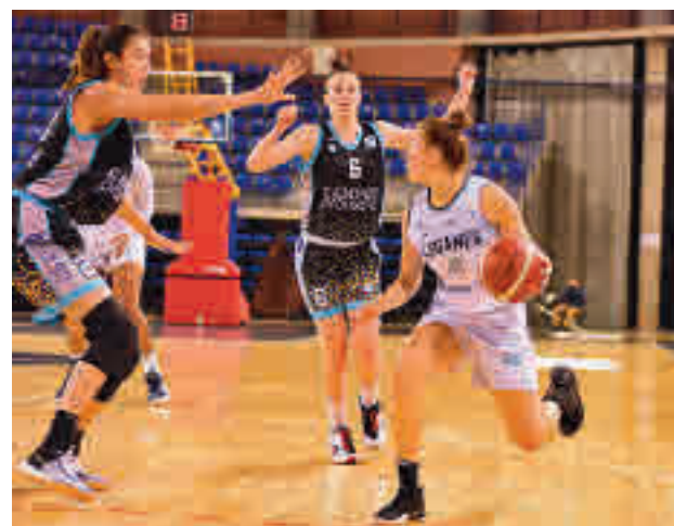
El Leganés repite como local

En el caso del Innova-tsn Leganés, este pequeño maratón tendrá al menos una buena noticia: no deberá moverse de su pabellón. Tras recibir al Valencia Basket, repetirá este domingo 21 (18 horas) en el Pabellón Europa para medir sus fuerzas con el Cadi La Seu, un conjunto que arrancó la temporada de manera brillante, pero que con el paso de las fechas ha ido cediendo terreno en be-