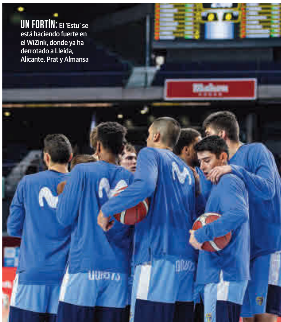
UN FORTÍN: El 'Estu' se está haciendo fuerte en el WiZink, donde ya ha derrotado a Lleida, Alicante, Prat y Almansa