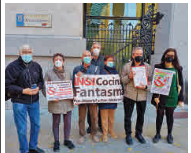
La representación vecinal que acudió al Palacio de Cibeles

La campaña de este año, que comenzó a finales de marzo, ha tenido como principal objetivo la reparación y renovación del pavimento de las calzadas que estaban en peor estado con objeto de atenuar el efecto del temporal Filomena, ya que la fuerte nevada y las posteriores heladas derivadas de la borrasca aceleraron de forma generalizada el deterioro de los pavimentos de la ciudad.