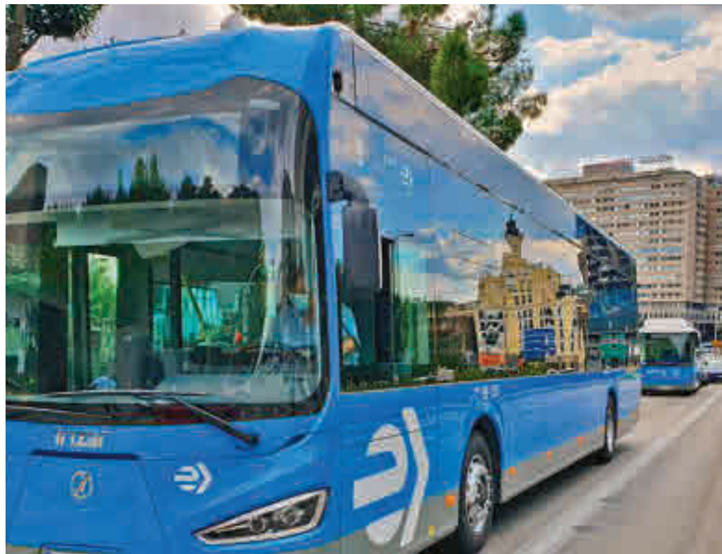
Uno de los nuevos autobuses de la flota municipal

“Todas las líneas serán gratuitas para todos los usuarios que se podrán desplazar por cualquiera de ellas, sobre todo por las 38 que circulan por el centro. Es una nueva muestra de al-