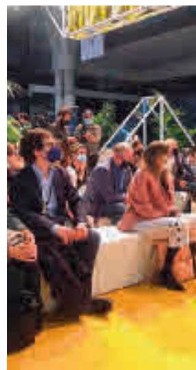
Acto de presentación

el ámbito de la movilidad urbana. Entre ellas se encuentra Shotl, que ofrece una plataforma de transporte bajo demanda que pone en contacto a personas que comparten destino; y Meep, una plataforma de movilidad intermodal que lanzará junto con Aena una aplicación para conectar las distintas formas de transportes existentes en cada ciudad.