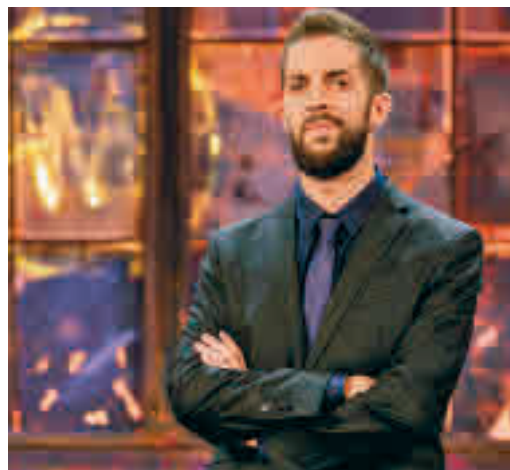
El presentador David Broncano

EL PERIÓDICO GENTE NO SE RESPONSABILIZA NI SE IDENTIFICA CON LAS OPINIONES QUE SUS LECTORES Y COLABORADORES EXPONGAN EN SUS CARTAS Y ARTÍCULOS