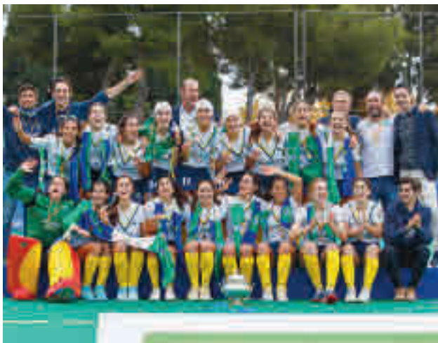
Foto de las campeonas con el título