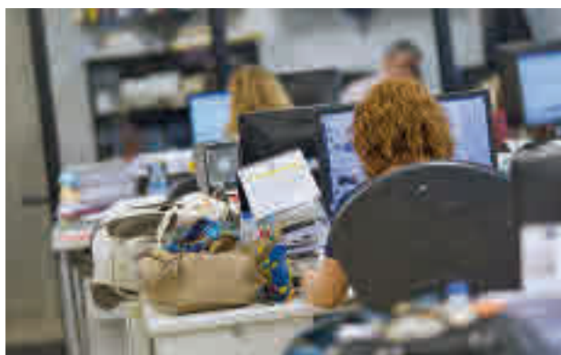
El paro volvió a bajar en noviembre

Con estos datos, el volumen total de parados alcanzó al finalizar el mes la cifra de 3.182.687 desempleados, la menor en un mes de noviembre desde 2008 e inferior en