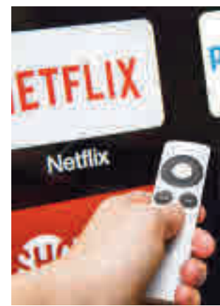
Cambios en el sector

Así lo han confirmado a Europa Press fuentes gubernamentales, después de que el Consejo de Ministros, a propuesta del Ministerio de Asuntos Económicos y Transformación Digital, aprobara el pasado martes 30 de noviembre el proyecto de Ley General de Comunicación Audio-