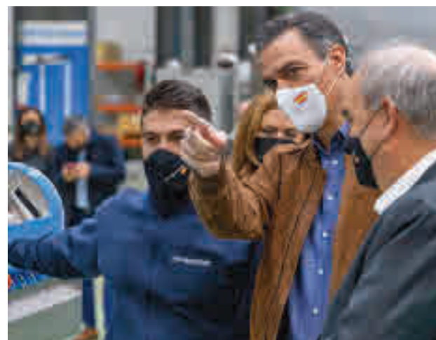
Pedro Sánchez, durante la visita HIPERBARIC

Pedro Sánchez se ha interesado por el procesado por altas presiones para alimentos y bebidas en la que Hiperbaric es líder mundial desde