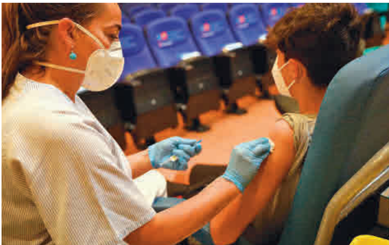
La vacunación en los niños ya ha comenzado en algunos países