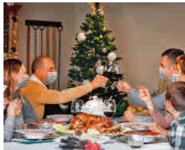
La cena de Nochebuena sigue siendo la reina

Javier Gutiérrez encabeza el reparto de 'La hija', una interpretación que le ha valido la nominación al Goya como 'Mejor actor protagonista'