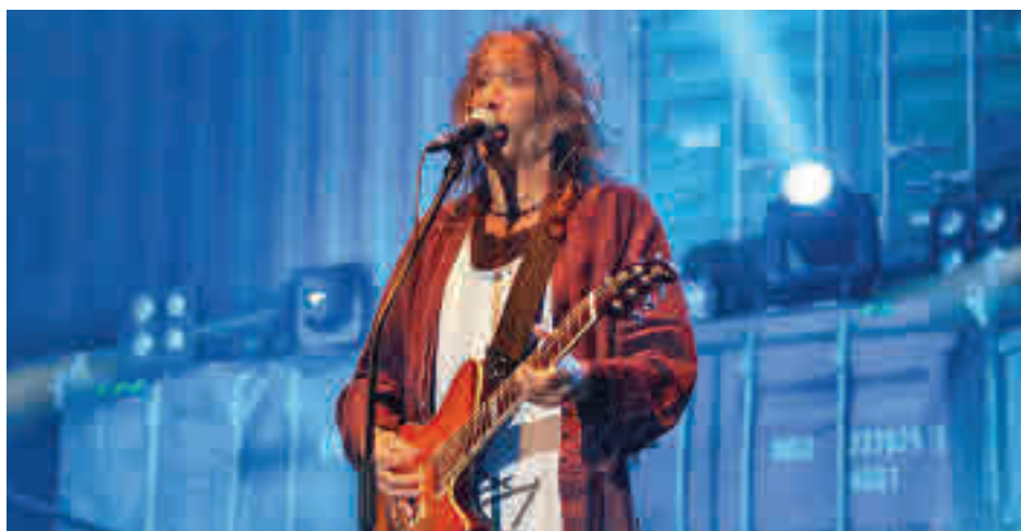
El líder de la banda, durante la gira de 2014

de las bandas más grandes del rock español, con una lección de seguidores que, años después de la separación del grupo, sigue rindiendo tributo a la formación extremeña.