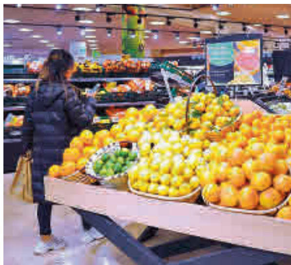
Compras en el supermercado

Respecto a la inversión prevista, más de la mitad de los españoles y españolas, el 54%, gastará entre 100 y 300 euros en la compra de alimentos