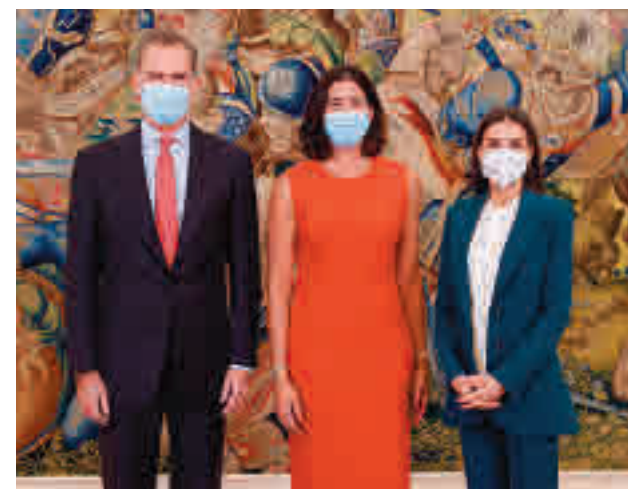
Garbiñe Muguruza, junto a los Reyes

del evento. La ex número uno del mundo Arantxa Sánchez Vicario fue la única otra jugadora de España en llegar a la final del torneo en 1993, aunque terminó subcampeona, tras perder ante la alemana Steffi Graf. En su palmarés hay, además, dos campeonatos de Grand Slam: Roland Garros 2016 y Wimbledon 2017.