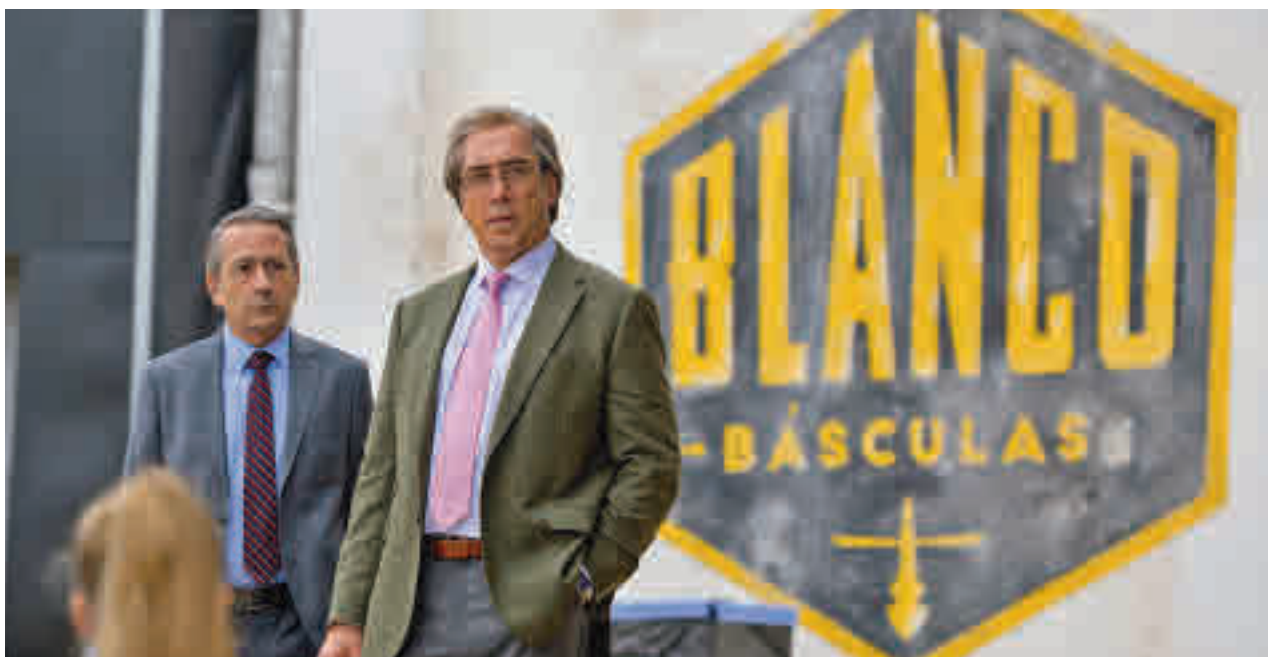
Fotograma del largometraje protagonizado por Javier Bardem