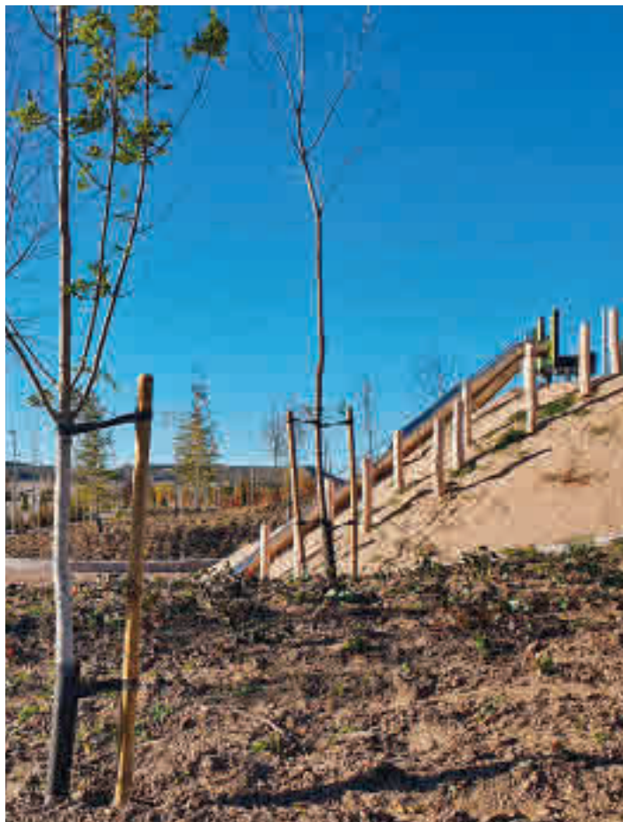
Uno de los nuevos espacios del parque de La Gavia

DISPONE DE TRES ZONAS TÉMATICAS Y DE DIFERENTES DOTACIONES