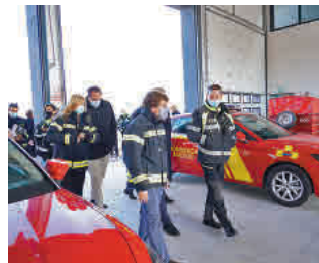
La visita del alcalde de Madrid al distrito vicálvaro

Toda la actualidad de los distritos del Este, en nuestra web