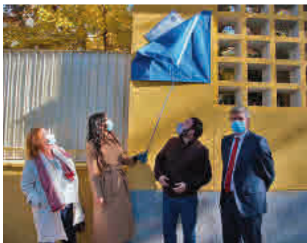
El descubrimiento de la placa conmemorativa

ra una residencia infantil y junto a ella se encuentra la estatua que recuerda a Arturo Soria y que está dotada de iluminación. La vicealcaldesa de Madrid, Begoña Villacís, acompañada por el concejal de Ciudad Lineal, Ángel Niño, descubrió el nuevo distintivo el 26 de noviembre, una medida que fue aprobada por unanimidad por el Pleno del distrito.