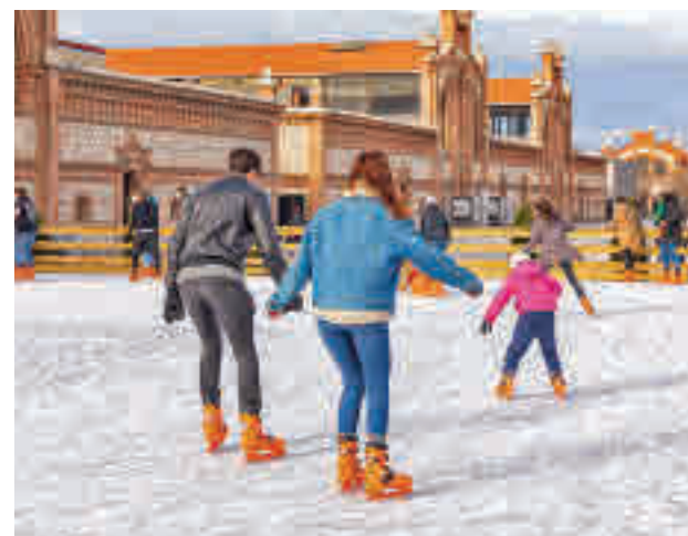
La pista de patinaje de Matadero Madrid, en Arganzuela

Este año, a las pistas de la Galería de Cristal del Palacio de Cibeles y Matadero Madrid, espacios del Área de Cultura, Turismo y Deporte, se suman otras seis distribuidas en los distritos de Centro, Fuencarral- El Pardo, Moncloa-Aravaca, Puente de Vallecas, Salamanca y Usera, todas equipadas con las medi-