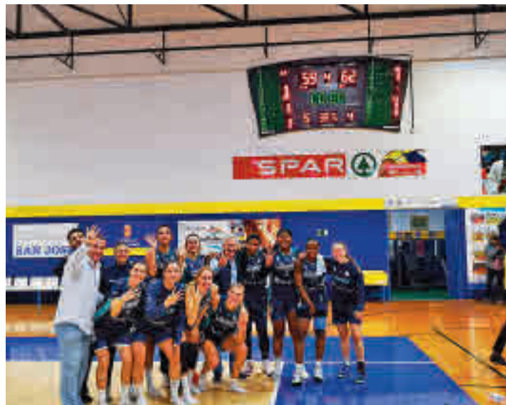
Las jugadoras del Leganés celebran su triunfo en Gran Canaria

Colegiales y pepineras tienen en estos momentos un balance de 4 triunfos y 6 de-