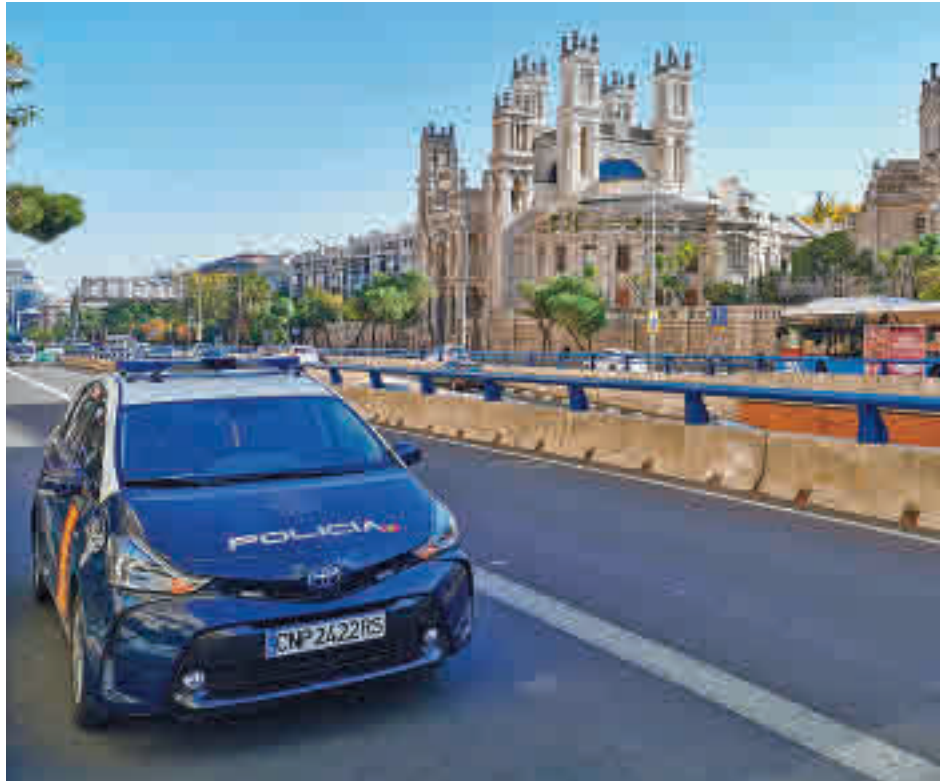
Un coche policial patrulla la zona Centro de la capital

Entre ellos, destacan los planes Turismo Seguro y Comercio Seguro. El primero de ellos tiene como objetivo proteger al visitante para que pueda moverse por la ciudad sin riesgo a ser víctima de los diferentes delitos asociados a la actividad turística, mientras que el segundo pretende