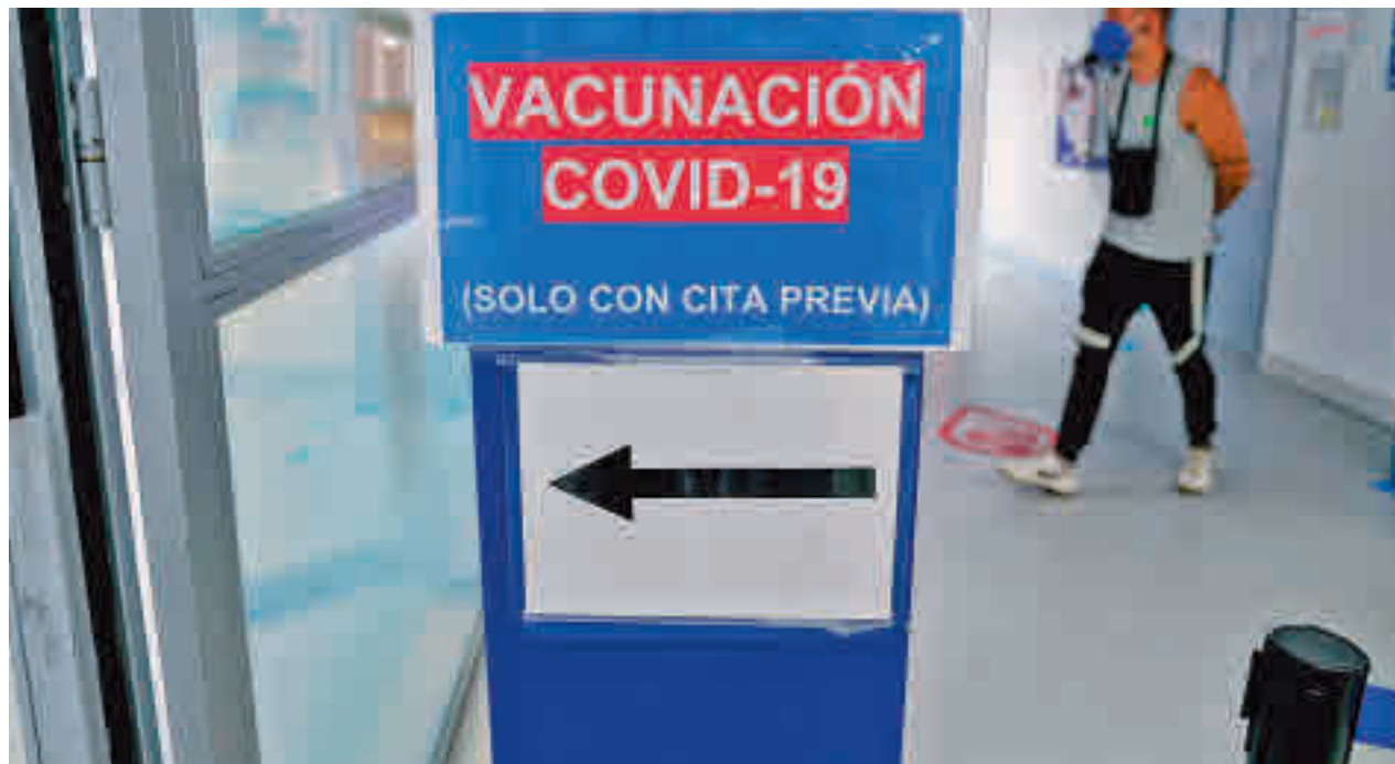
La incidencia acumulada sigue subiendo en el Sur

gentedigital.es Toda la actualidad de la zona Sur, en nuestra página web