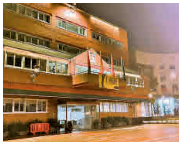
Fachada ilumina del Ayuntamiento de Alcorcón

Según Amnistía Internacional, en la actualidad hay más de 30.000 personas condenadas a muerte en todo el mundo, en países tan dispares como Estados Unidos, China, Irak, Pakistán, Corea del Norte, Arabia Saudí o Nigeria.