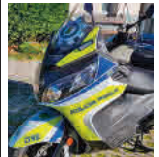
Una de las motos