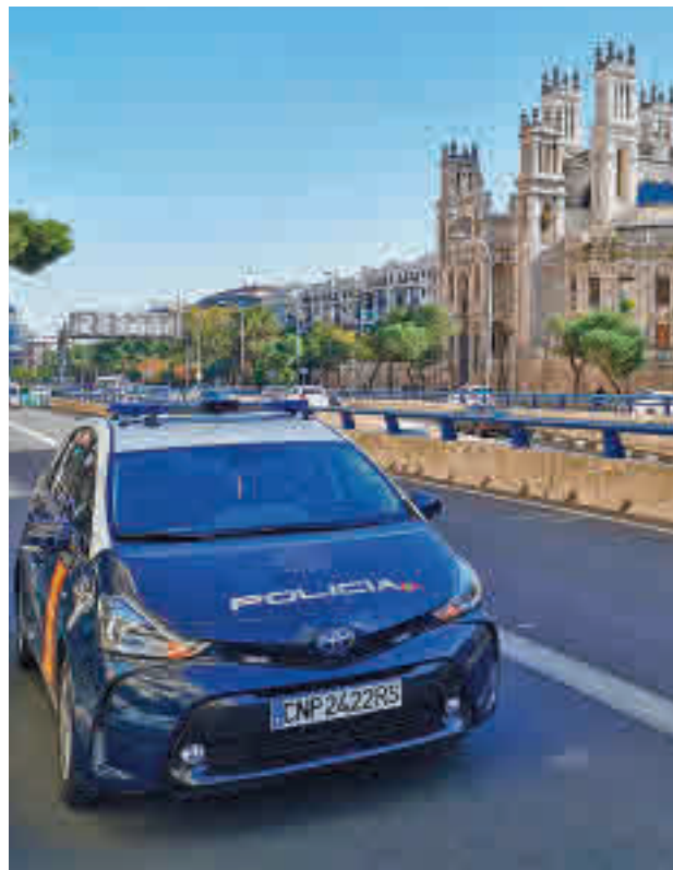
Un coche policial patrulla la zona Centro de la capital