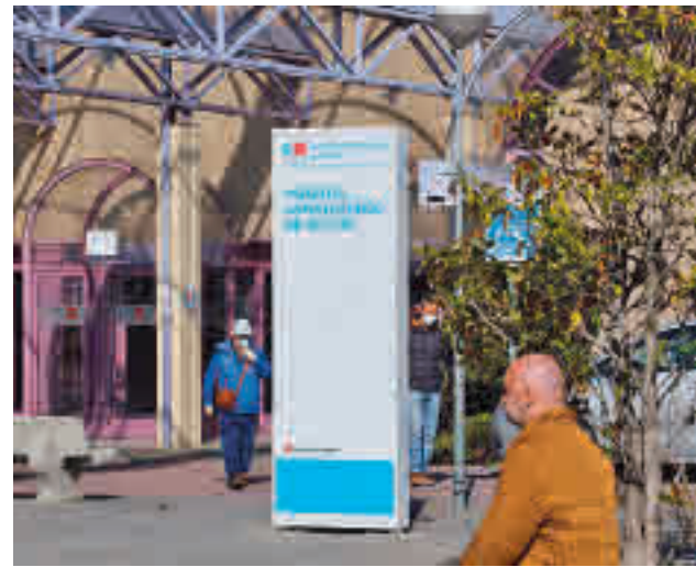
Los contagios suben en el Sur