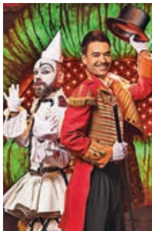
Imagen del show

Esa es la esencia de Madrid Circus Festival, el espectáculo que llega este viernes 3 de diciembre al Espacio Ibercaja Delicias para mantenerse en cartel hasta el 9 de enero. Está dirigido por Gabriel Chamé, mientras que el polifacético Álex O'Dogherty pone el guion. Las funciones