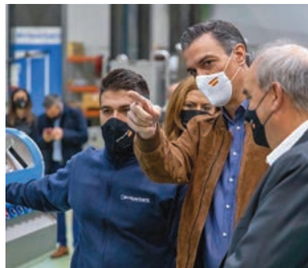
Pedro Sánchez, durante la visita HIPERBARIC

Pedro Sánchez se ha interesado por el procesado por altas presiones para alimentos y bebidas en la que Hiperbaric es líder mundial desde hace más de 20 años, así como en la tecnología de prensado isostático en caliente empleada para componentes industriales críticos enfocados en los sectores aeroes-