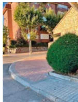
Avenida de Andalucía

doña y Santa Cecilia y las calles Cádiz y Puente de Tejada, la renovación de aceras de la fachada sur de avenida del Mediterráneo entre glorieta de los Músicos y la calle de Gimialcón, y una parte de la propia glorieta de los Músicos. En un comunicado, el Ayuntamiento explica que,