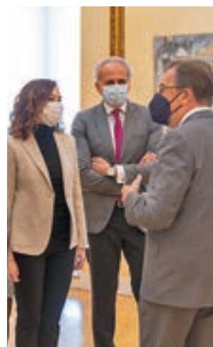
Firma del acuerdo

entre estas dos instituciones en materia social, científica, educativa y cultural. Gracias a este convenio la Fundación 'la Caixa' destina 67 millones de euros en acción social en 2021 en la región. Entre los objetivos está la mejora de