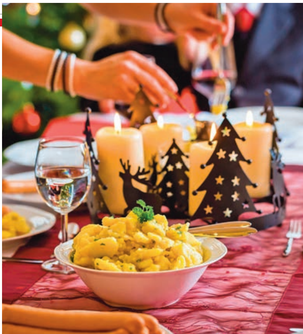
La cena de Nochebuena es la mayor tradición navideña en España

Las gambas, los langostinos y las cigalas son los productos estrella de la Navidad para un 24% de los hogares. El jamón es también uno de los protagonistas, con un 21%; seguido del cordero y el cabrito, con un 18%; los quesos, con un 15%; los caldos y consomés, con un 14%; y los turrones, con el 13%. Por regiones, en Andalucía, el gran protagonista es el jamón, con