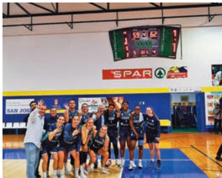
Las jugadoras del Leganés celebran su triunfo en Gran Canaria

Colegiales y pepineras tienen en estos momentos un balance de 4 triunfos y 6 de-