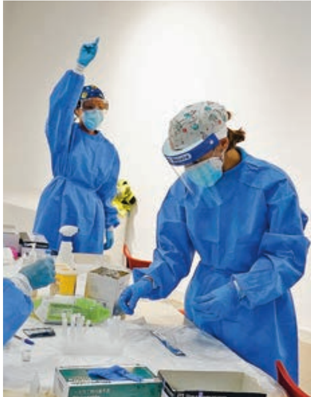
Test de antígenos en Madrid

Además de los test, el Gobierno regional invertirá 40 millones de euros para renovar a los sanitarios de refuerzo que acaban contrato este 31 de