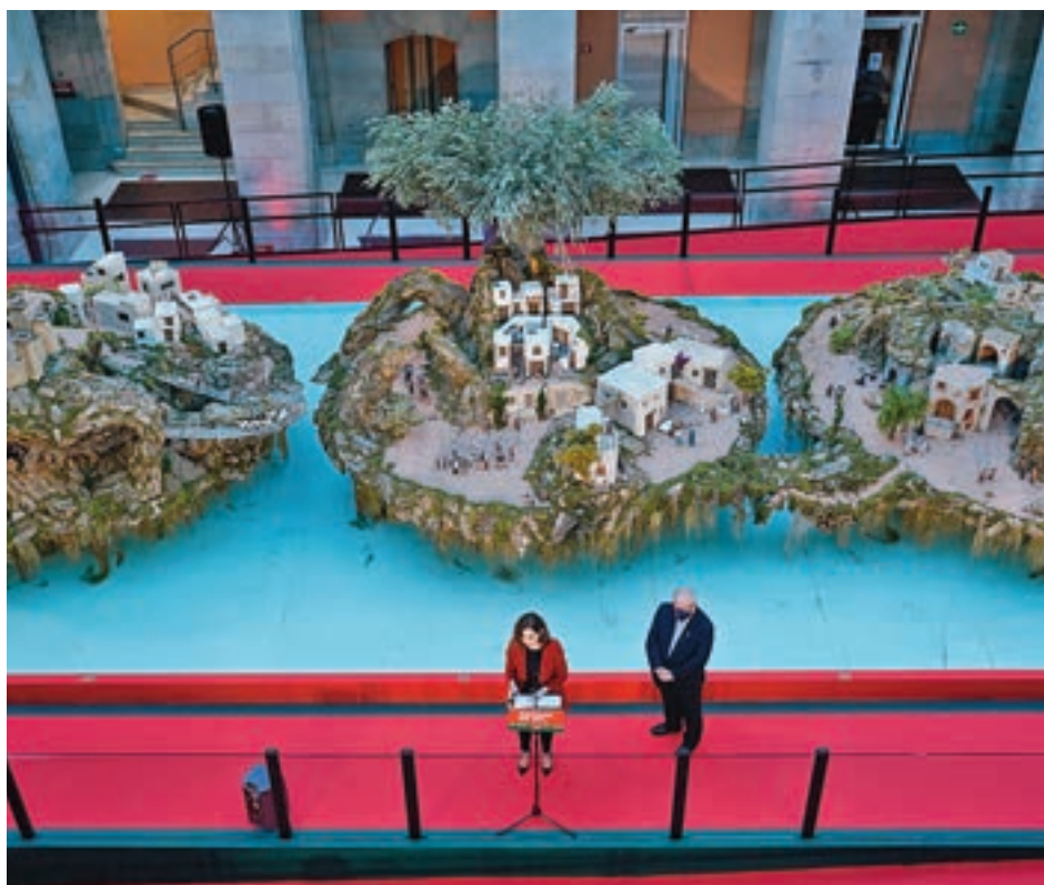
Belén de la Casa de Correos