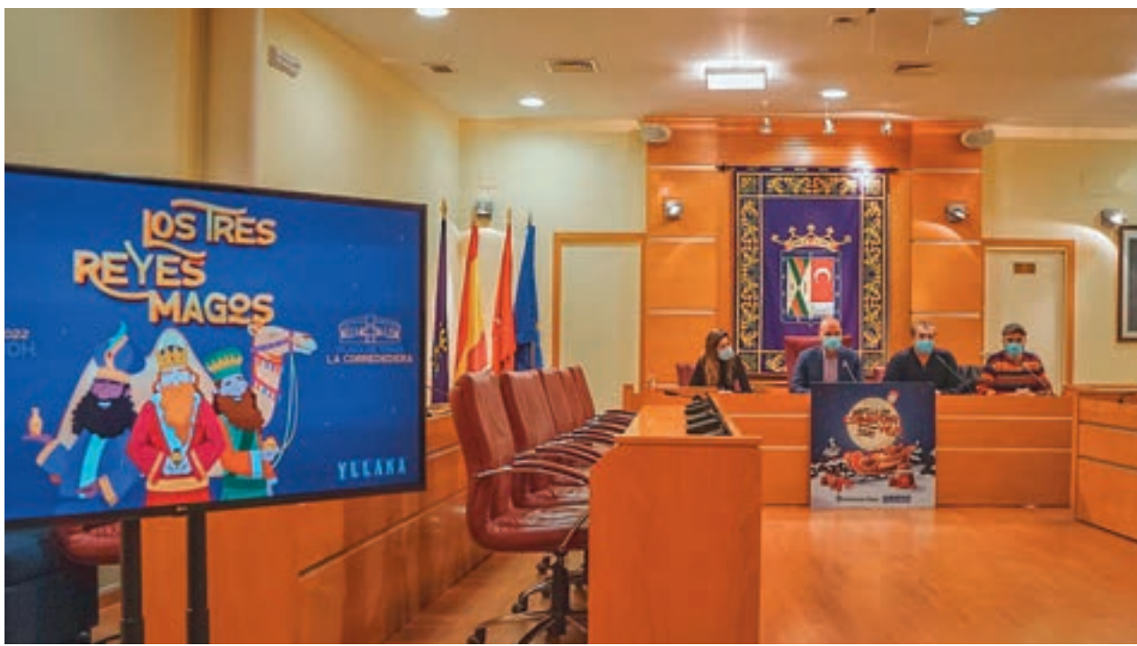
Presentación de la programación navideña