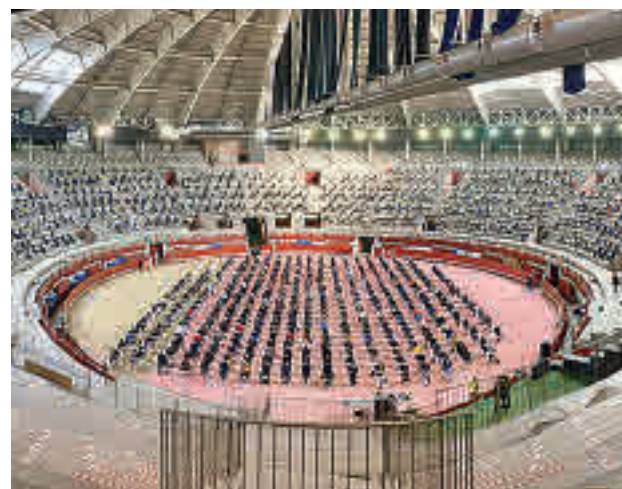
Examen en la Plaza de Toros

Los candidatos que han participado en la prueba de este miércoles optan a una de las 32 plazas convocadas para turno libre. Y es que la Oferta Pública comprende un total de 40 plazas, de las que 8 corresponden a los candida-