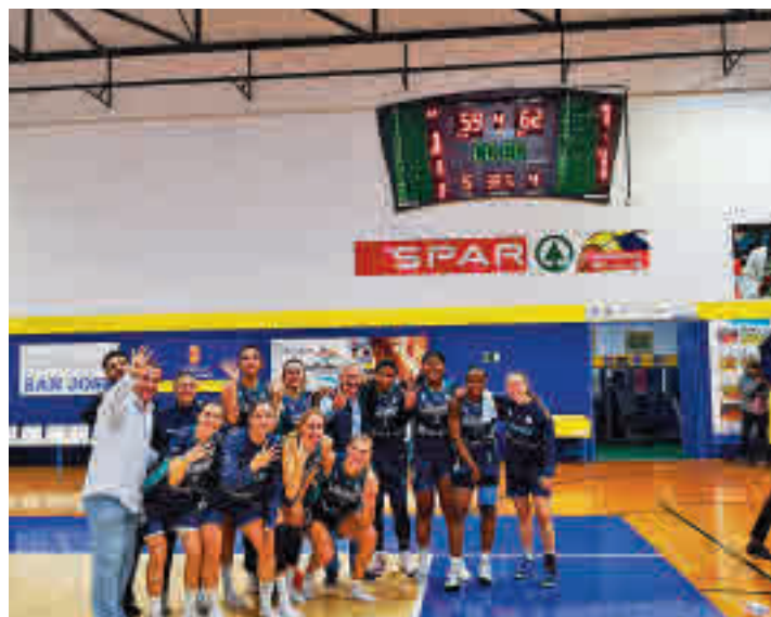
Las jugadoras del Leganés celebran su triunfo en Gran Canaria

Colegiales y pepineras tienen en estos momentos un balance de 4 triunfos y 6 de-