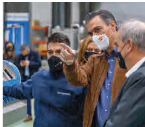
Pedro Sánchez, durante la visita HIPERBARIC

Pedro Sánchez se ha interesado por el procesado por altas presiones para alimentos y bebidas en la que Hiperbaric es líder mundial desde hace más de 20 años, así como en la tecnología de prensado isostático en caliente empleada para componentes industriales críticos enfocados en los sectores aeroes-