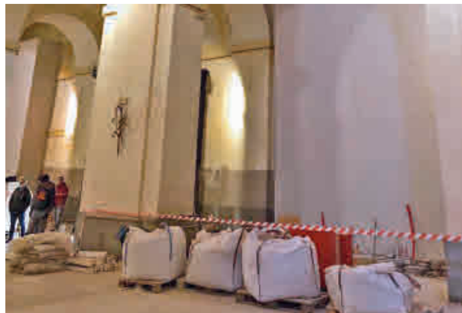
Obras en la Parroquia de San Salvador

El obispo de Getafe aprovechó la visita para pedir al alcalde que el Ayuntamiento colabore en la reparación de la Ermita de San Nicasio, otro templo religioso de gran valor patrimonial que presenta desperfectos. El regidor estudiará la petición