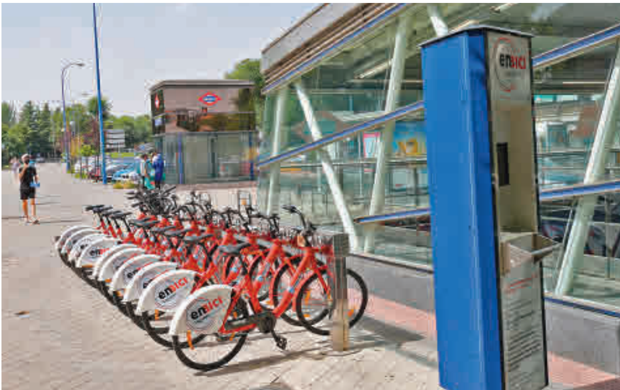
Uno de los aparcamientos del sistema de préstamo de EnBici