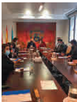
Acto en Leganés

El objetivo de la reunión es debatir la situación del Sin Hogarismo en la zona sur de