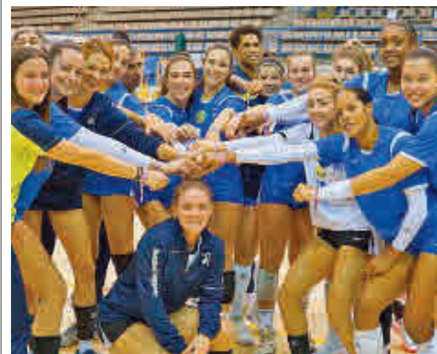
Uno de los clubes participantes

gentedigital.es Toda la actualidad de Leganés, en nuestra página web