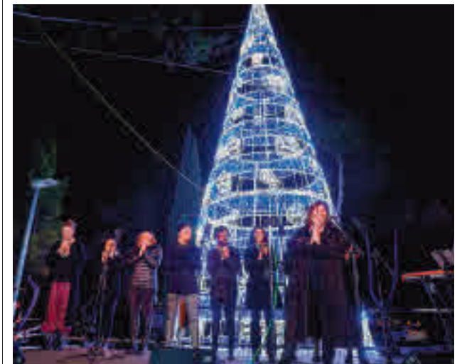
El acto oficial de encendido de la luces navideñas

En cuanto a los árboles iluminados son más de un centenar de ellos los que embellecen ya los diferentes rincones de Pozuelo, 105 naturales y 11 artificiales.