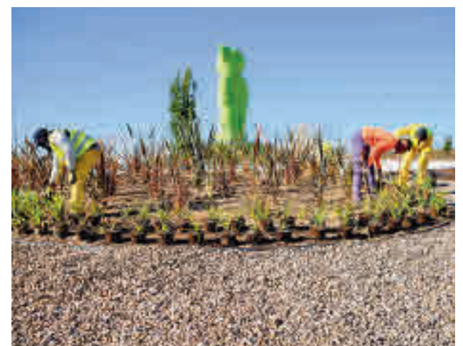
Obras en las rotondas de Boadilla

El presupuesto de ejecución de las conexiones de agua de las dos rotondas supondrá una inversión de 70.200 euros, en la que se incluyen los cruces de carreteras, la restitución de las superficies pavimentadas y asfaltadas y el ajardinamiento en los Fresnos. En Valdecabañas se trabajará en la red de riego, playas de áridos, plantaciones y zona de pradera.