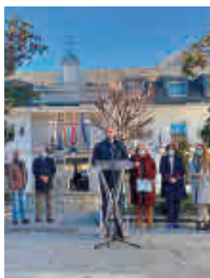
El primer edil majariego

En el transcurso del mismo se recordaron todos los nombres de las víctimas y se