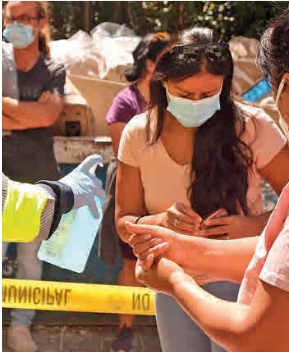
La incidencia sigue al alza en el Noroeste de la región

El caso más significativo es el de Boadilla del Monte, que esta semana se ha convertido en la ciudad madrileña (de las que tienen más de 50.000 habitantes) con la incidencia acumulada más alta. En concreto, se han detectado 163 positivos, lo que ha llevado la tasa a los 287 casos por cada 100.000 habitantes en los últimos catorce días. Junto a Getafe, es la única gran población de la Comuni-