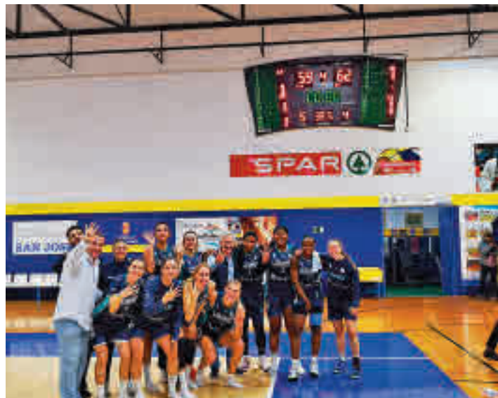
Las jugadoras del Leganés celebran su triunfo en Gran Canaria

Colegiales y pepineras tienen en estos momentos un balance de 4 triunfos y 6 de-