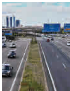
Obras en la zona

Hay que recordar que el pasado 15 de septiembre, el tramo