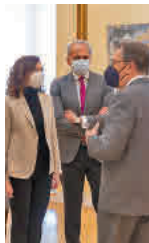
Firma del acuerdo

entre estas dos instituciones en materia social, científica, educativa y cultural. Gracias a este convenio la Fundación 'la Caixa' destina 67 millones de euros en acción social en 2021 en la región. Entre los objetivos está la mejora de