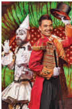
Imagen del show

Esa es la esencia de Madrid Circus Festival, el espectáculo que llega este viernes 3 de diciembre al Espacio Ibercaja Delicias para mantenerse en cartel hasta el 9 de enero. Está dirigido por Gabriel Chamé, mientras que el polifacético Álex O'Dogherty pone el guion. Las funciones