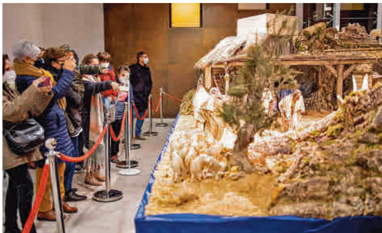
Inauguración del Belén Municipal de Alcobendas