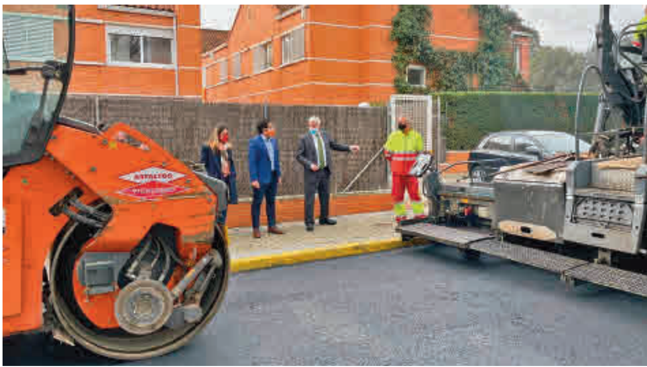
El equipo de Gobierno visitó una de las zonas donde se están llevando a cabo las labores de asfaltado