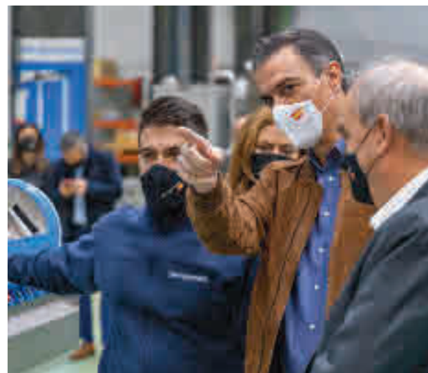
Pedro Sánchez, durante la visita HIPERBARIC

Pedro Sánchez se ha interesado por el procesado por altas presiones para alimentos y bebidas en la que Hiperbaric es líder mundial desde hace más de 20 años, así como en la tecnología de prensado isostático en caliente empleada para componentes industriales críticos enfocados en los sectores aeroes-