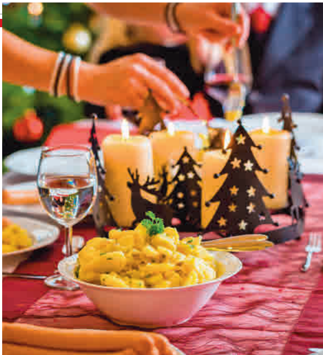
La cena de Nochebuena es la mayor tradición navideña en España

Las gambas, los langostinos y las cigalas son los productos estrella de la Navidad para un 24% de los hogares. El jamón es también uno de los protagonistas, con un 21%; seguido del cordero y el cabrito, con un 18%; los quesos, con un 15%; los caldos y consomés, con un 14%; y los turrones, con el 13%. Por regiones, en Andalucía, el gran protagonista es el jamón, con