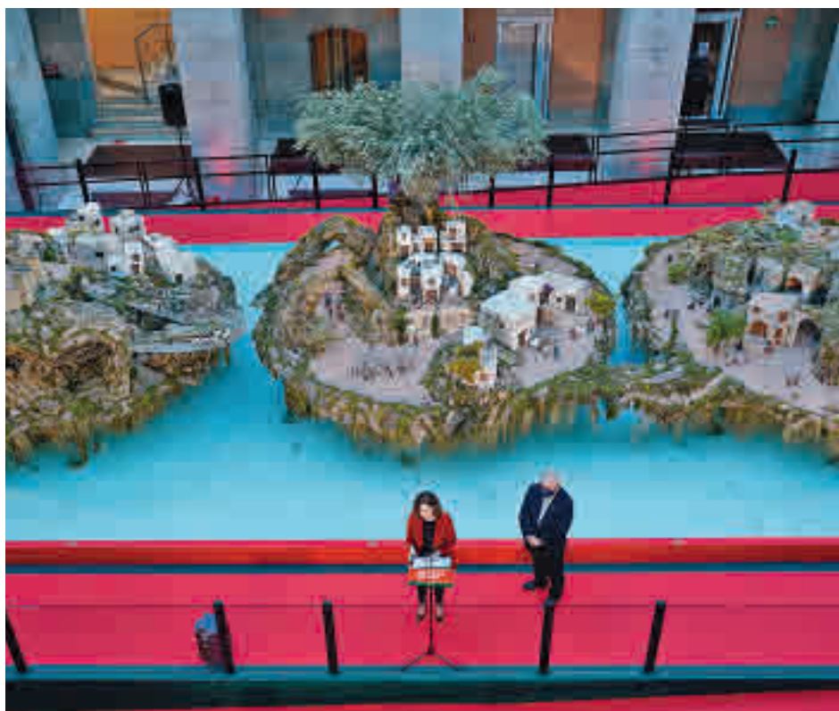
Belén de la Casa de Correos