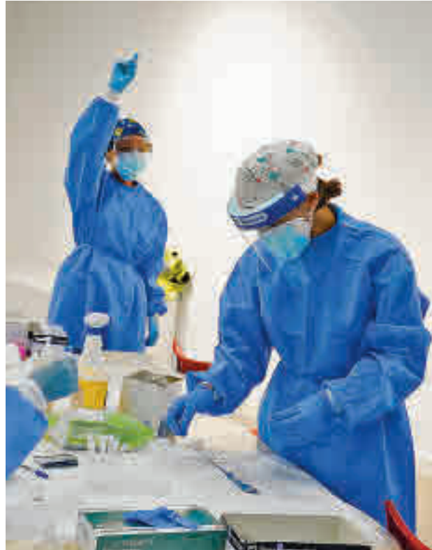
Test de antígenos en Madrid

Además de los test, el Gobierno regional invertirá 40 millones de euros para renovar a los sanitarios de refuerzo que acaban contrato este 31 de