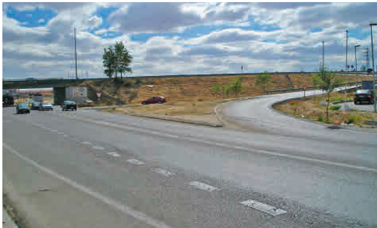
Obras en el entorno de la M-506

Las obras de ampliación y mejora de la red de saneamiento y alcantarillado recogidos en el Plan Sanea llegarán paulatinamente a la totalidad de los barrios de la ciudad, incluyendo las áreas industriales. Las actuaciones se basan en un estudio realizado entre el Consistorio y el Canal sobre la situación del saneamiento en el municipio.