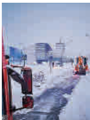
Nieve en Fuenlabrada

sea necesario, como se está haciendo desde días atrás debido a las bajas temperaturas registradas, sobre todo, a primera hora de la mañana mediante el reparto en 15 entonclaves. Operarios municipales distribuyen sal en las entradas de edificios públicos, como colegios, centros de salud y