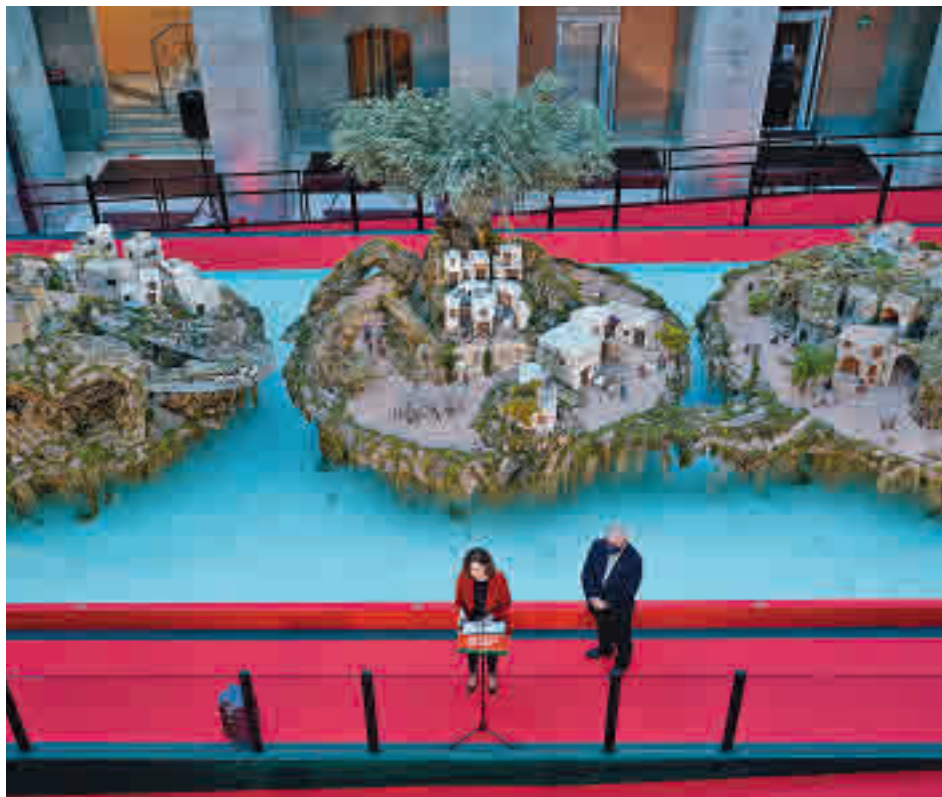
Belén de la Casa de Correos