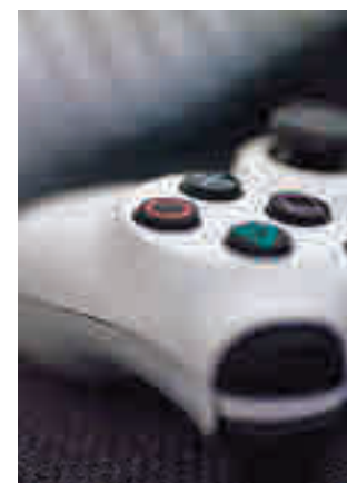
Cambios en PlayStation

Los planes de la compañía, a los que ha tenido acceso Bloomberg, indican una nueva suscripción, que se lanzaría en primavera, y que internamente se conoce por el momento como 'Spartacus'. Supondría, además, la retirada de la marca PlayStation Now. En concreto, este nuevo servicio de pago se basaría en tres niveles: uno con los beneficios que ya presenta