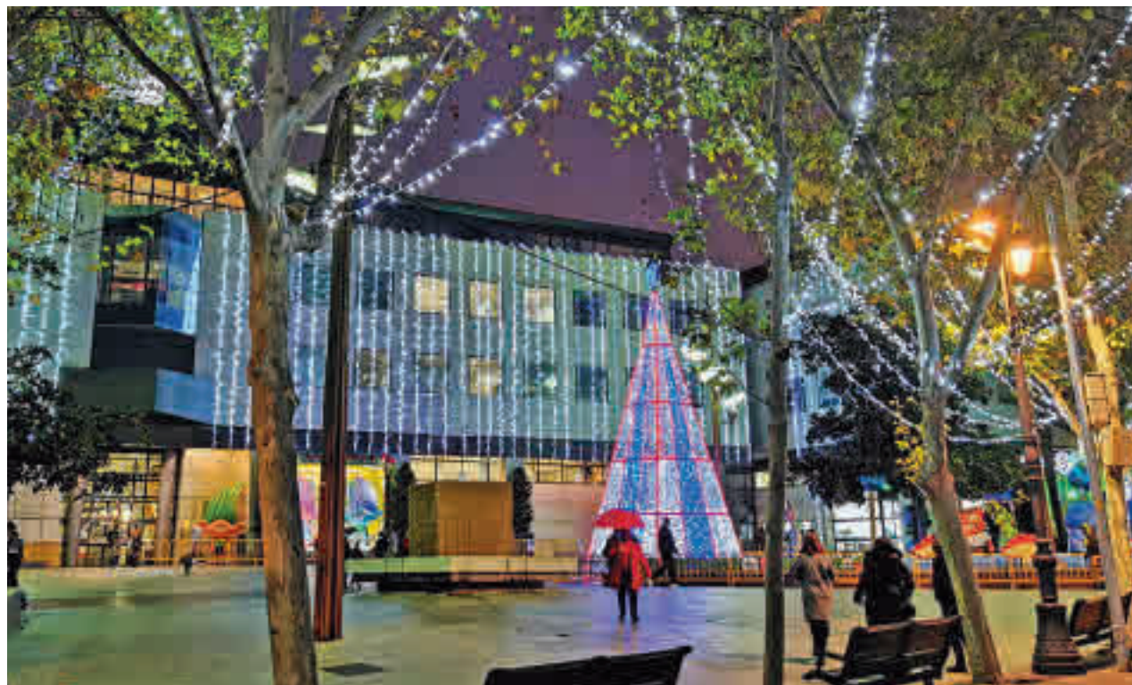
La Navidad ya se respira en las calles de Getafe

La Policía Local de Getafe, junto a la Policía Nacional y la Guardia Civil, ha puesto en marcha su campaña Navidades Seguras. Permanecerá hasta el 9 de enero y engloba el Plan de comercio seguro, el Plan sobre artefactos pirotécnicos, armas y objetos prohibidos, el control de juguetes y la Campaña especial de seguridad vial.