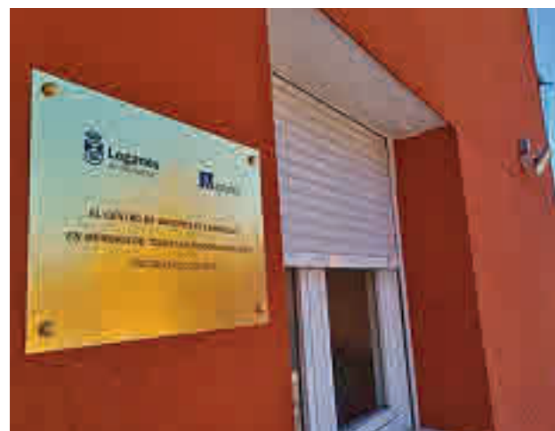
Una de las placas que se han colocado

Leganés fue, según recordó Llorente, la ciudad de Europa más afectada por las muertes por coronavirus durante los meses de marzo y abril de 2020, en la primera ola de la pandemia. En este sentido, ha manifestado que las placas servirán para “recordar esos duros momentos