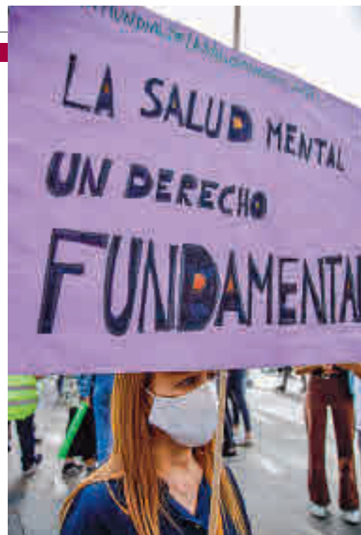
SATURACIÓN El Ministerio de Sanidad reconoce una serie de problemas en el sistema público de atención a la salud mental actual, como la saturación de los servicios y una inversión en esta materia "mejorable".