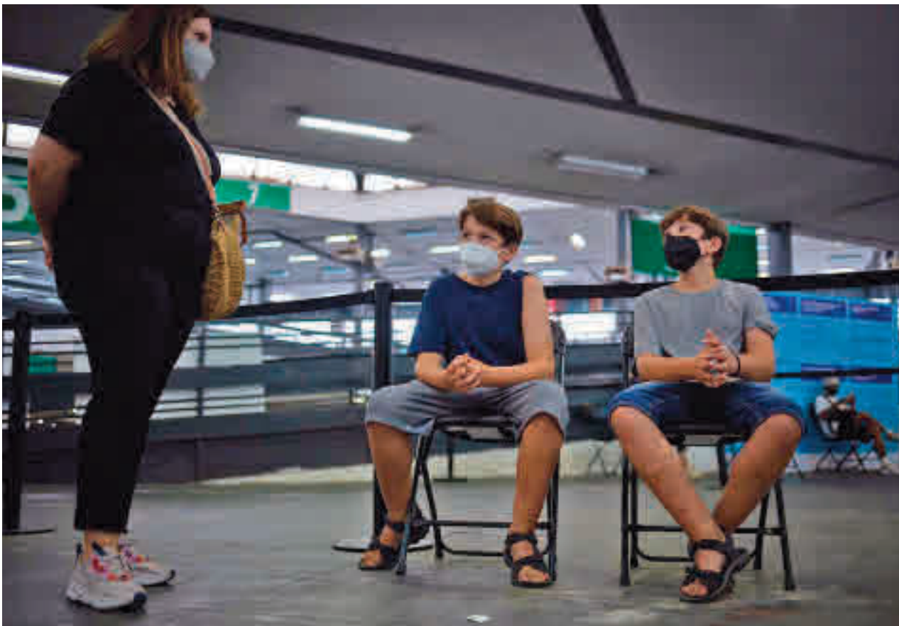
Los niños empezarán a vacunarse en la Comunidad el próximo 15 de diciembre