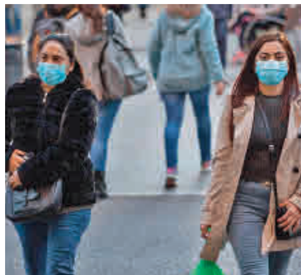
Las mascarillas son obligatorias en lugares cerrados

fiestas navideñas y el incremento de casos de covid-19. Desde la asociación se hace hincapié en el uso de las mascarillas como elemento de protección, con especial énfasis en la importancia de que el material sanitario cuente con las homologaciones y certificaciones que legitimen la calidad del producto. De esta manera se garantiza la máxima protección y eficacia.