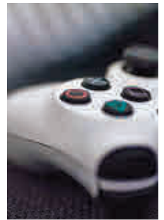
Cambios en PlayStation

Los planes de la compañía, a los que ha tenido acceso Bloomberg, indican una nueva suscripción, que se lanzaría en primavera, y que internamente se conoce por el momento como 'Spartacus'. Supondría, además, la retirada de la marca PlayStation Now. En concreto, este nuevo servicio de pago se basaría en tres niveles: uno con los beneficios que ya presenta