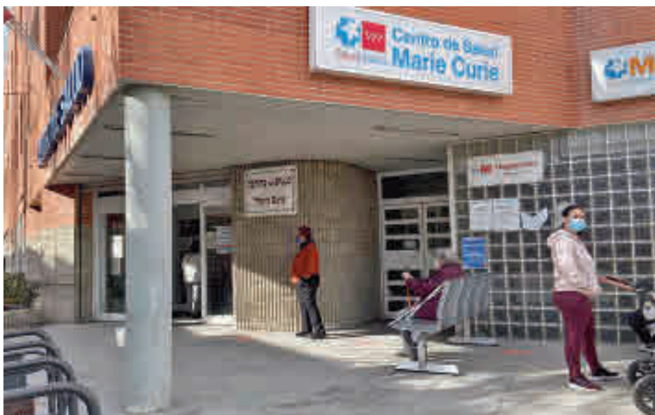
La incidencia continúa aumentando en Leganés