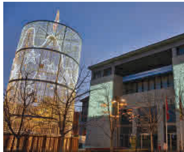
Iluminación navideña en Leganés

El Ayuntamiento anunciará en los próximos días la programación cultural ligada a estas fiestas, que contará con acciones en la calle y actividades para todos los públicos.