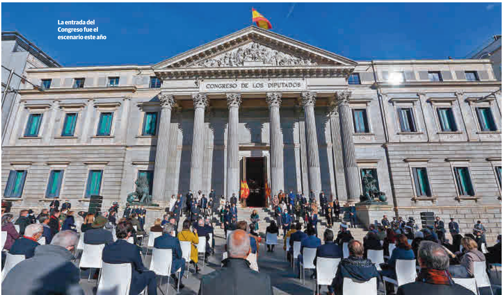
La entrada del Congreso fue el escenario este año