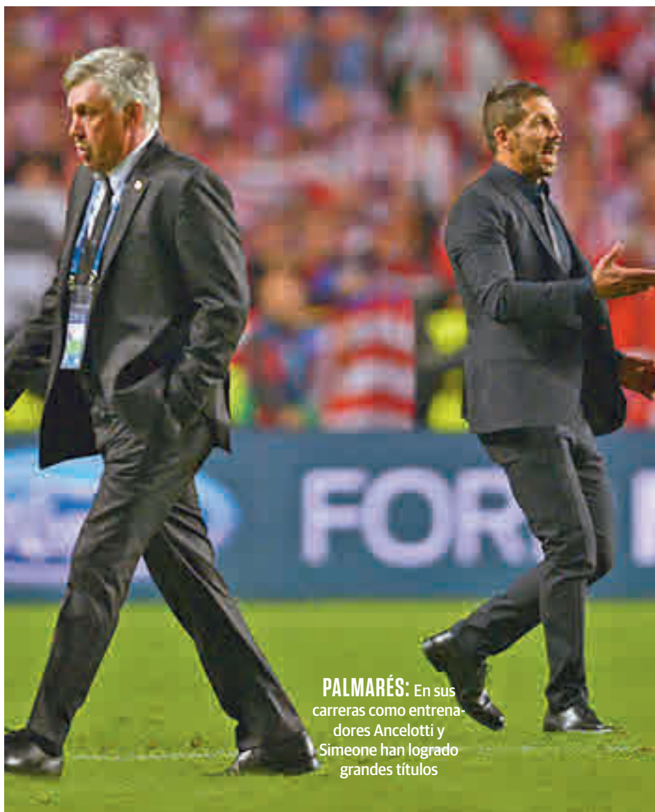
PALMARÉS: En sus carreras como entrenadores Ancelotti y Simeone han logrado grandes títulos

Ese maratón de derbis se vivió en casi todos los terrenos posibles (Liga, Copa del Rey, Supercopa de España y Champions League), con alegrías y decepciones para ambos bandos. En el caso de Ancelotti y Real Madrid, el recuerdo más grato, sin duda, fue la conquista de la Décima en Lisboa (4-1), rematando un curso en el que si bien no pudo superar al vecino en la Liga (derrota por 0-1 en el Bernabéu y empate a dos en el Vicente Calderón), sí que