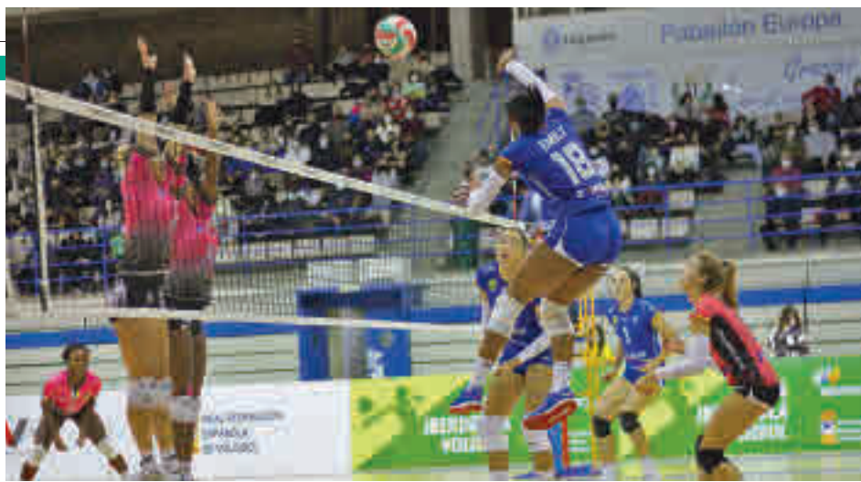
El Leganés es colista, pero no se descuelga de la zona de permanencia

en uno de esos encuentros cuyo resultado puede resultar crucial al final de la temporada regular. En estos momentos, el conjunto pepinero es colista, pero los cinco puntos de desventaja que tiene respecto a su próximo rival no solo alimentan sus esperanzas de permanencia, sino que, además, le permitiría afrontar el segundo tramo del