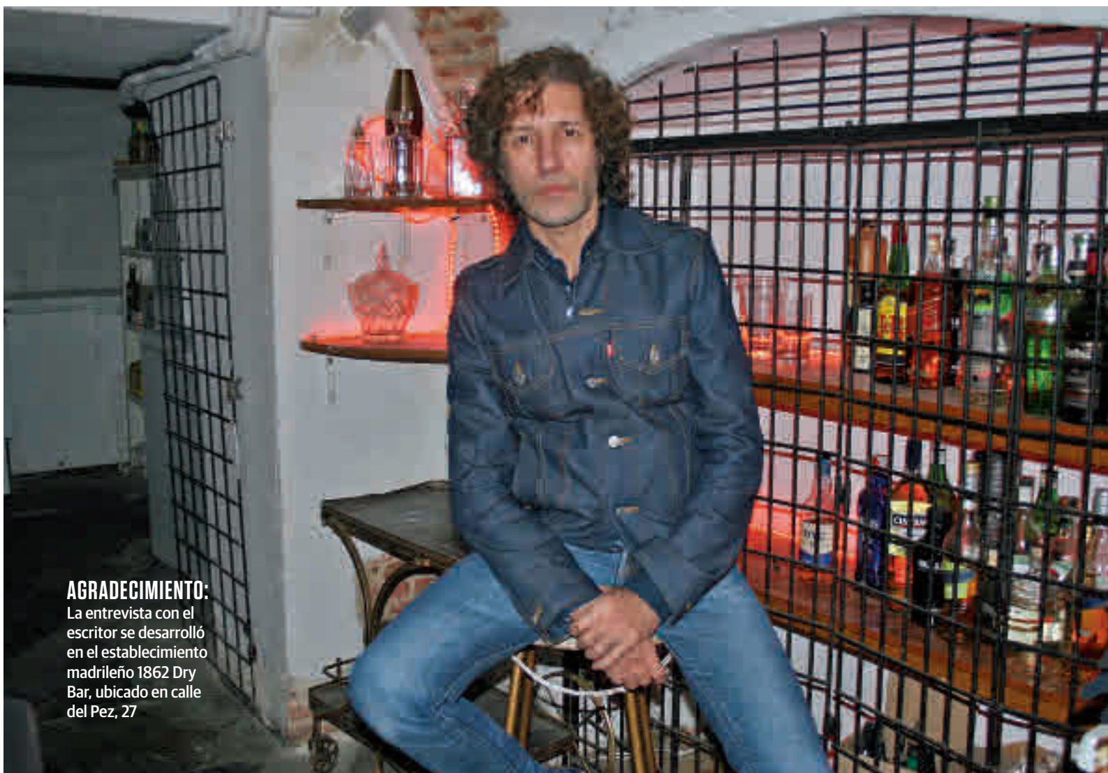
AGRADECIMIENTO: La entrevista con el escritor se desarrolló en el establecimiento madrileño 1862 Dry Bar, ubicado en calle del Pez, 27

Fue un fenómeno plural y democrático”, argumenta antes de explicar que ese ejercicio de reduccionismo, a su juicio, se debe a que “la foto de los modernos vendía más, mola, era más chula, más pintona, pero La Movida fue mucho más diversa”. Por ese motivo ha incluido a “los heavies, los flamencos sacrílegos con la tradición, los cantantes melódicos, los directores del cine quinquí, los cantantes