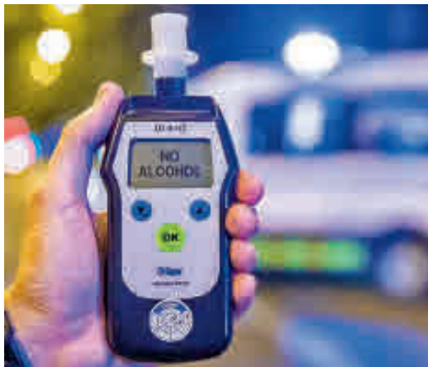
Los controles dejaron 25 detenciones