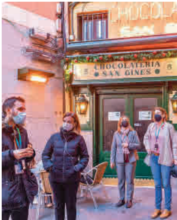
La presentación de las rutas guiadas

Asimismo, las visitas se realizarán al aire libre y con todas las medidas de seguridad, como el uso de gel hidroalcohólico y auriculares individuales de un solo uso.