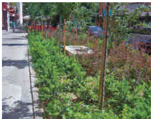
Zonas verdes en Fuenlabrada

La reposición del arbolado se ha realizado tanto en las zonas naturales periféricas a la ciudad, Valdeserrano o La Aldehuela, como en las zonas urbanas.