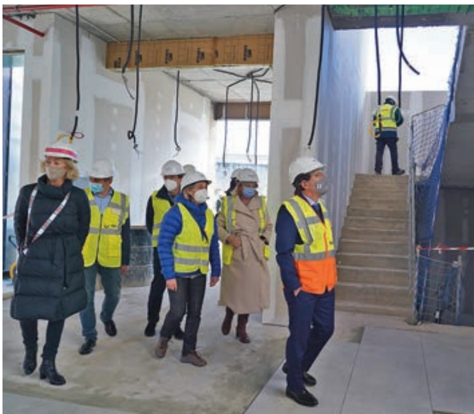
El primer edil recorrió el interior del futuro equipamiento