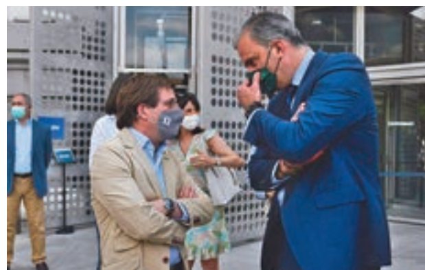
Almeida y Ortega Smith conversan en una imagen de archivo

y Cs, tras el rechazo firme a las cuentas municipales de Vox, expresado por su portavoz en Cibeles, Javier Ortega Smith, al finalizar la reunión de algo más de una hora que mantuvo este jueves 16 de diciembre con el primer edil de la capital. "El 'no' es una 'decisión firme'", aseguró el edil de la