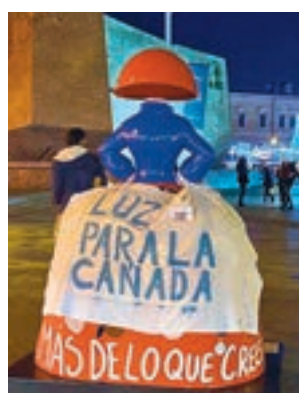
Una de las esculturas

De igual modo, subrayan que en Madrid "conviven la luz y la oscuridad, esta última de quienes niegan lo más elemental a los vecinos y vecinas