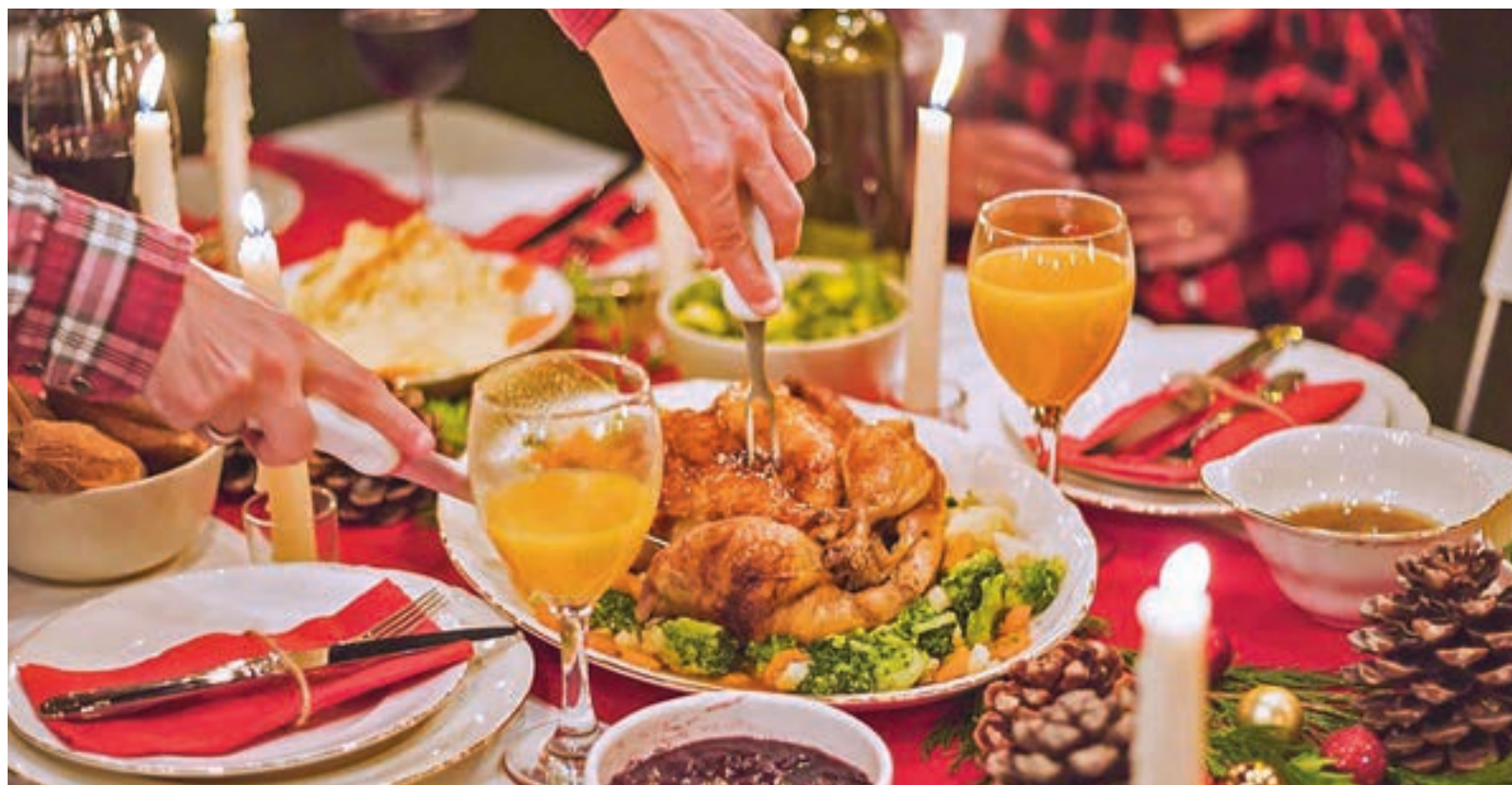
Festín de Navidad