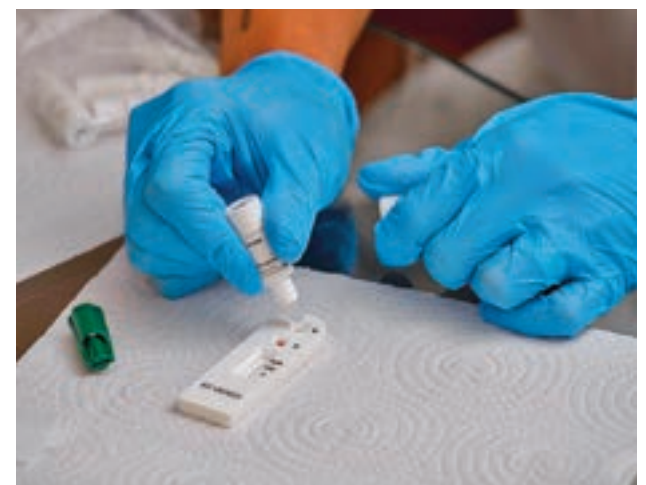
Test de antígenos

La realización de test de antígenos es uno de los pilares del Gobierno regional a la hora de frenar la ola de contagios que se está produciendo antes de la Navidad. La idea de la Comunidad es que todos los madrileños se puedan hacer una prueba de este tipo antes de reunirse con sus familiares o amigos. También recomendó a los empresarios que los incluyeran en sus cestas de regalos.