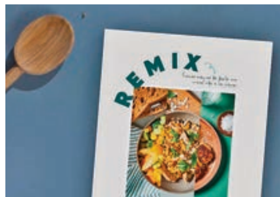
Portada del libro electrónico TOO GOOD TO GO

del año para frenar el desperdicio de alimentos en los hogares. Este libro digital gratuito cuenta con una recopilación de 29 recetas de aprovechamiento divididas entre las diferentes estaciones del año, con sugerencias de diferen-