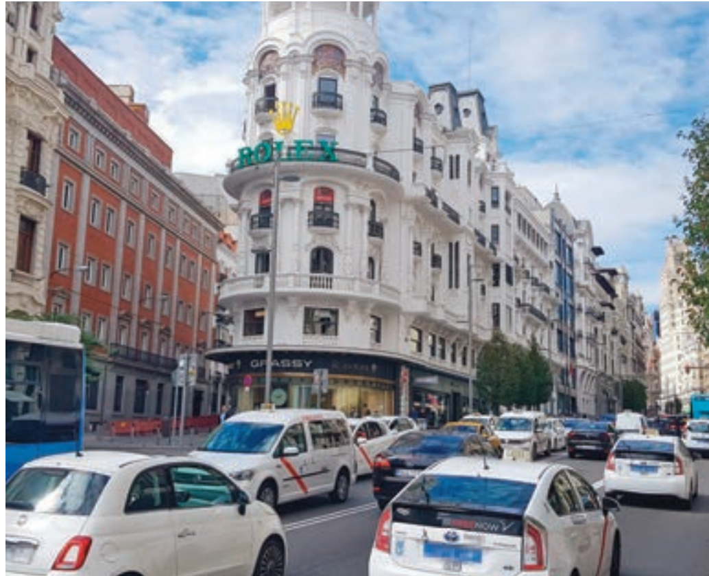
La zona de bajas emisiones Distrito Centro

Por otro lado, aquellos con etiqueta B o C podrán acceder únicamente para llegar a parking de uso público, garaje privado o reserva de estacionamiento no dotacional, salvo que sean de invitados autorizados por los residentes, de Persona de Movilidad Reducida (PMR), de servicios