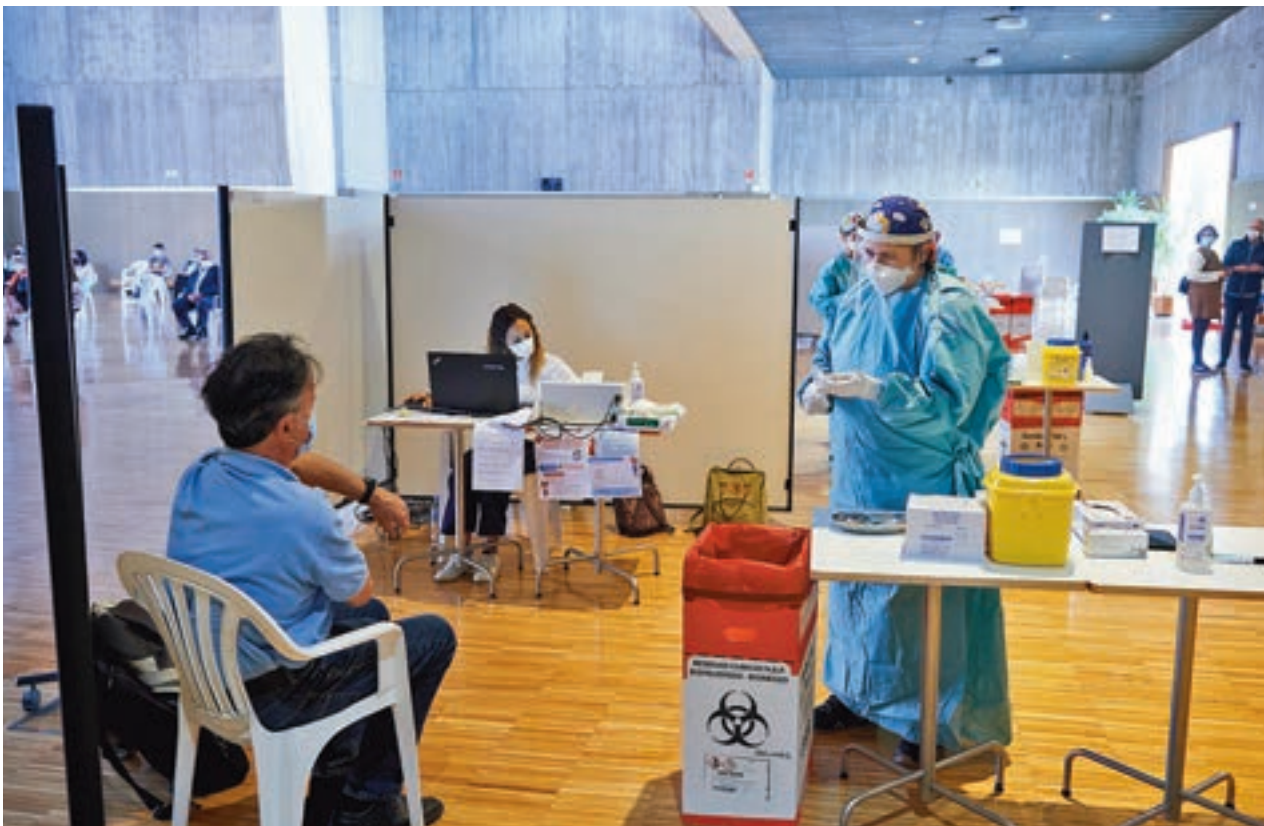
Personas mayores de 60 años recibiendo la tercera dosis