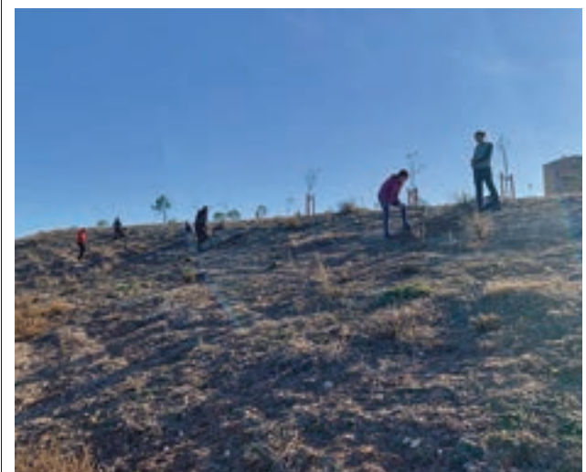
Un momento de la plantación

Toda la actualidad de los distritos de Madrid, en nuestra web.