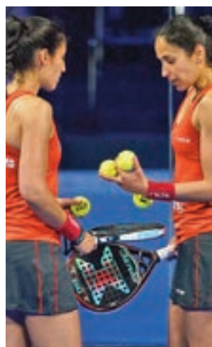
Las gemelas Sánchez Alayeto

drid Arena (Recinto Ferial Casa de Campo) hasta este domingo 19 de diciembre. La temporada 2021 de World Padel Tour pone el cierre con