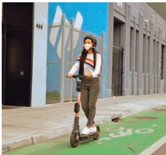
Nuevo modelo del patinete

ra. Basado en un sistema de inteligencia artificial, el nuevo cerebro de los patinetes eléctricos de Spin estudiará cada movimiento que haga el usuario. De no hacerse bien, el vehículo eléctrico comenzará a pitar. Con un sistema de sensores, cámaras traseras y delanteras, el vehículo estudiará su entorno para saber dónde está en todo momento.