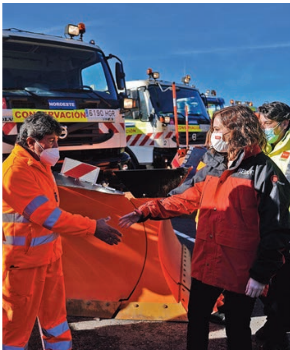
Ayuso, durante la presentación del dispositivo

que se encuentran 1.448 bomberos, 255 agentes forestales, 3.029 voluntarios de Protección Civil, 600 voluntarios de Cruz Roja y 570 vehículos. Seguirá contando con las dos máquinas quitanieves del Cuerpo de Bomberos en Navacerrada y Lozoyuela, dos máquinas ligeras en el nuevo equipo de respuesta de Protección Civil ERIVE y con cuatro helicópteros: dos son sanitizados y pertene-