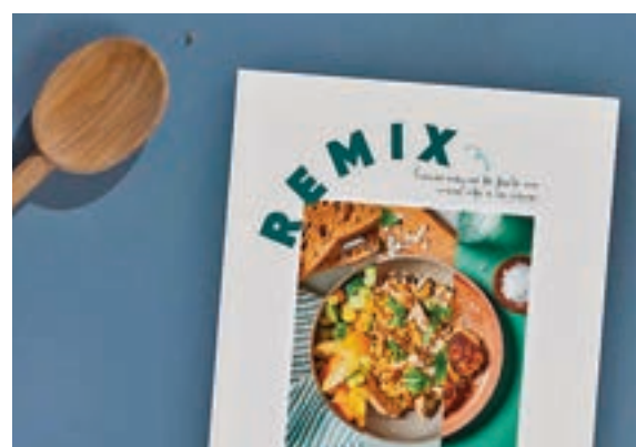
Portada del libro electrónico TOO GOOD TO GO

del año para frenar el desperdicio de alimentos en los hogares. Este libro digital gratuito cuenta con una recopilación de 29 recetas de aprovechamiento divididas entre las diferentes estaciones del año, con sugerencias de diferen-