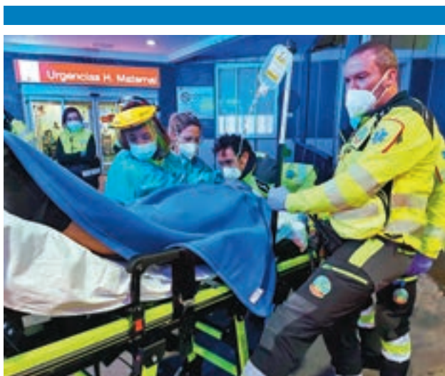
La madre y su hija, a su llegada al Hospital de La Paz

Al cierre de esta edición, las primeras hipótesis de la investigación policial apuntan a que el autor de los hechos es un individuo que sufriría alguna enfermedad o enajenación mental, que aún no ha sido detenido.