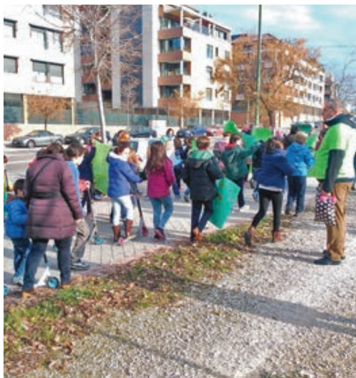
La reivindicación ciudadana que tuvo lugar en diciembre de 2015

Fuentes de la Consejería contestan que los trámites se están realizando según los pla-