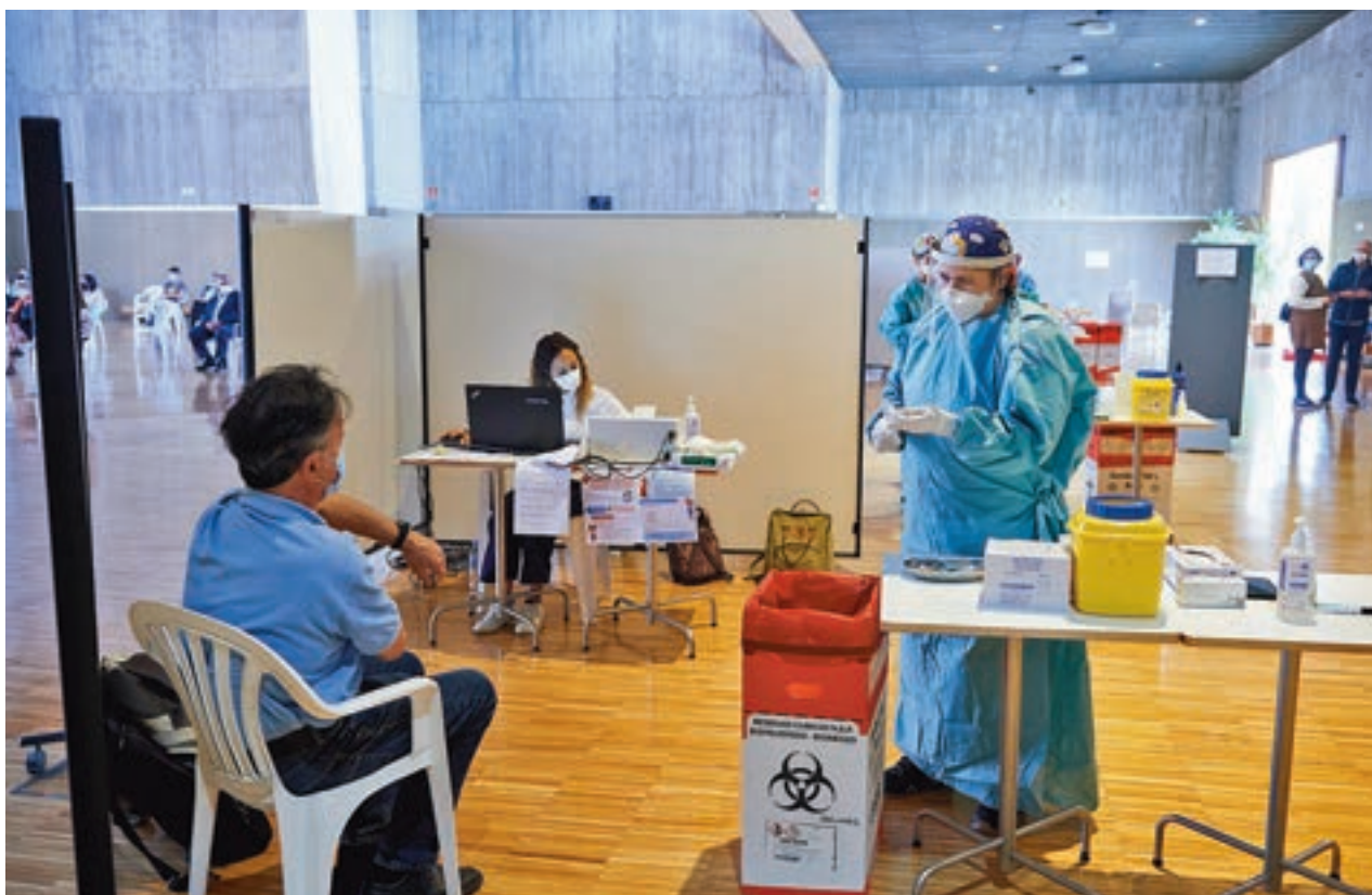
Personas mayores de 60 años recibiendo la tercera dosis