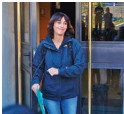
El caso de Juana Rivas vuelve a ser protagonista

EL PERIÓDICO GENTE NO SE RESPONSABILIZA NI SE IDENTIFICA CON LAS OPINIONES QUE SUS LECTORES Y COLABORADORES EXPONGAN EN SUS CARTAS Y ARTÍCULOS