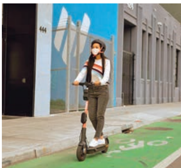
Nuevo modelo del patinete

ra. Basado en un sistema de inteligencia artificial, el nuevo cerebro de los patinetes eléctricos de Spin estudiará cada movimiento que haga el usuario. De no hacerse bien, el vehículo eléctrico comenzará a pitir. Con un sistema de sensores, cámaras traseras y delanteras, el vehículo estudiará su entorno para saber dónde está en todo momento.