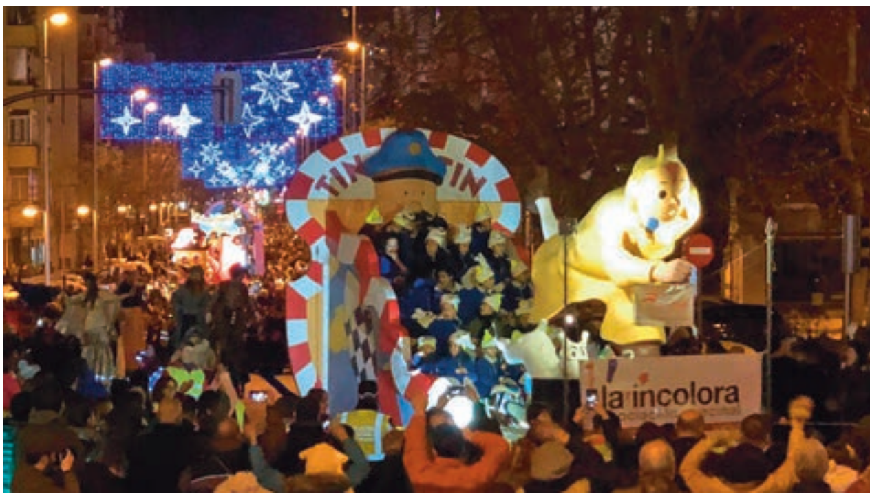
La cabalgata que discurrió entre El Espinillo y Villaverde Alto en 2020