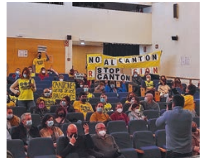
Parte de los asistentes al Pleno de Latina

Por la mañana, el propio Carabante, no se mostró excesivamente optimista con la posibilidad de dar con una parcela que aleje de las viviendas los dos futuros cantones de limpieza, que dispondrán de aparcamientos para maquinaria pesada.