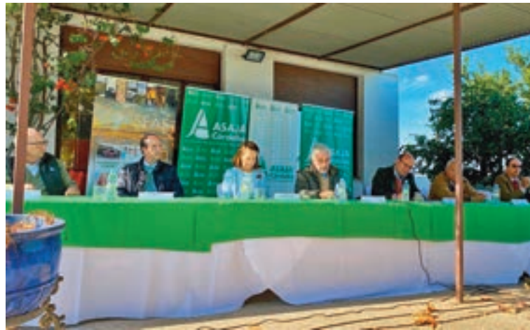
En acción: Además de su labor en el Parlamento Europeo, Mazaly Aguilar se reúne con los principales afectados de las decisiones que se toman en la Unión Europea. Sobre estas líneas, en un encuentro con agricultores. Debajo, con los ganaderos.