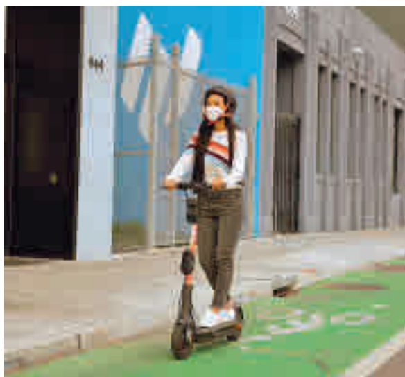
Nuevo modelo del patinete

ra. Basado en un sistema de inteligencia artificial, el nuevo cerebro de los patinetes eléctricos de Spin estudiará cada movimiento que haga el usuario. De no hacerse bien, el vehículo eléctrico comenzará a pitir. Con un sistema de sensores, cámaras traseras y delanteras, el vehículo estudiará su entorno para saber dónde está en todo momento.