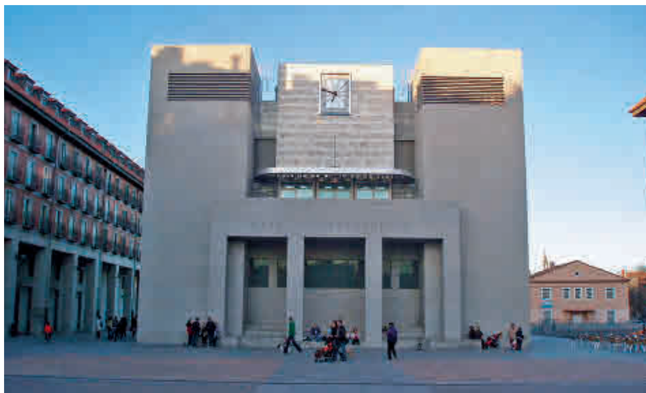
Ayuntamiento de Leganés

Todos los grupos de la oposición, excepto Vox, se han puesto de acuerdo para solicitar la celebración de un pleno extraordinario en el que se trate de manera monográfica el 'hackeo' de la página web municipal. Según explicó el alcalde, la sesión se tiene que convocar antes del 4 de enero y el Gobierno local espera a tener más información técnica.