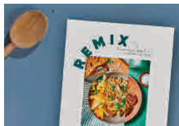
Portada del libro electrónico TOO GOOD TO GO

del año para frenar el desperdicio de alimentos en los hogares. Este libro digital gratuito cuenta con una recopilación de 29 recetas de aprovechamiento divididas entre las diferentes estaciones del año, con sugerencias de diferen-