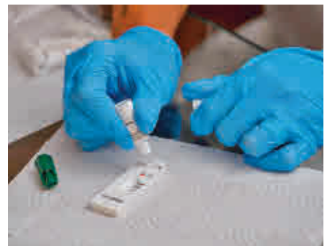
Test de antígenos

La realización de test de antígenos es uno de los pilares del Gobierno regional a la hora de frenar la ola de contagios que se está produciendo antes de la Navidad. La idea de la Comunidad es que todos los madrileños se puedan hacer una prueba de este tipo antes de reunirse con sus familiares o amigos. También recomendó a los empresarios que los incluyeran en sus cestas de regalos.