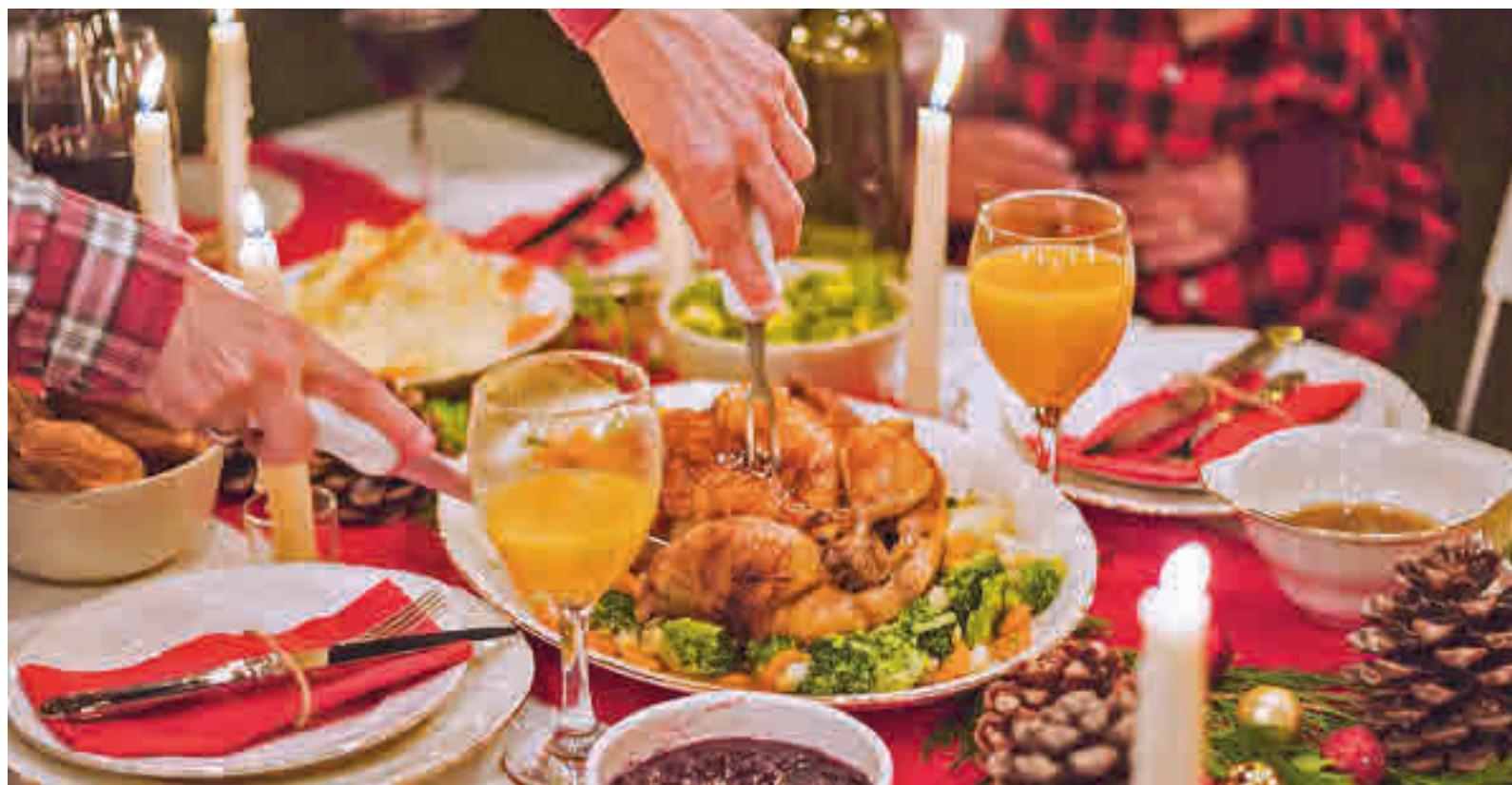
Festín de Navidad