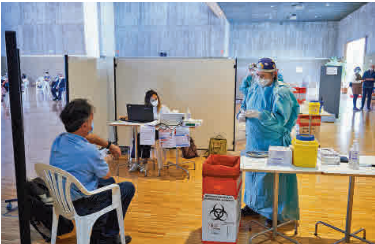
Personas mayores de 60 años recibiendo la tercera dosis