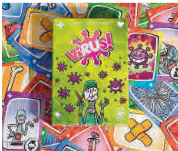
JUEGO DE MESA VIRUS, DE TRANJI GAMES: Aunque este juego de cartas se lanzó antes de la pandemia, se puso de moda durante el confinamiento. Cada jugador deberá competir por ser el primero en erradicar los virus logrando aislar un cuerpo sano para la propagación de la enfermedad.