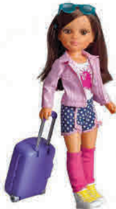
NANCY CHIC NY Y PARÍS, DE FAMOSA: Es una muñeca de pelo moreno, vestida con un conjunto moderno que viene equipada con una maleta con ruedas que cuenta con todo lo necesario para un viaje, desde cepillo de dientes hasta un secador. Hay dos modelos disponibles: Nueva York y París.