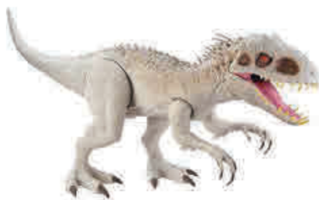
DINOSAURIOS JURASSIC WORLD, DE MATTEL: El catálogo incluye los conocidos Tiranosaurus Rex, el Indoraptor y Brachiosaurus, entre otros. La edad recomendada es a partir de tres años y con las figuras se podrán recrear las escenas de la saga de las películas, así como la época dónde vivieron los dinosaurios.