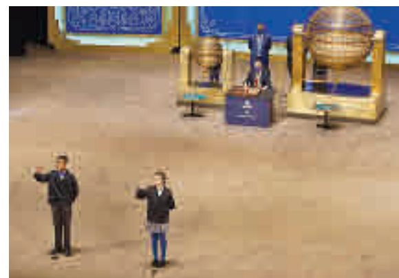
Momento en el que se cantó el Gordo en el Teatro Real

Entre las celebraciones, la vendedora mira al futuro y anima a los participantes para sorteos próximos: "Aquí os esperamos para la lotería de El Niño".