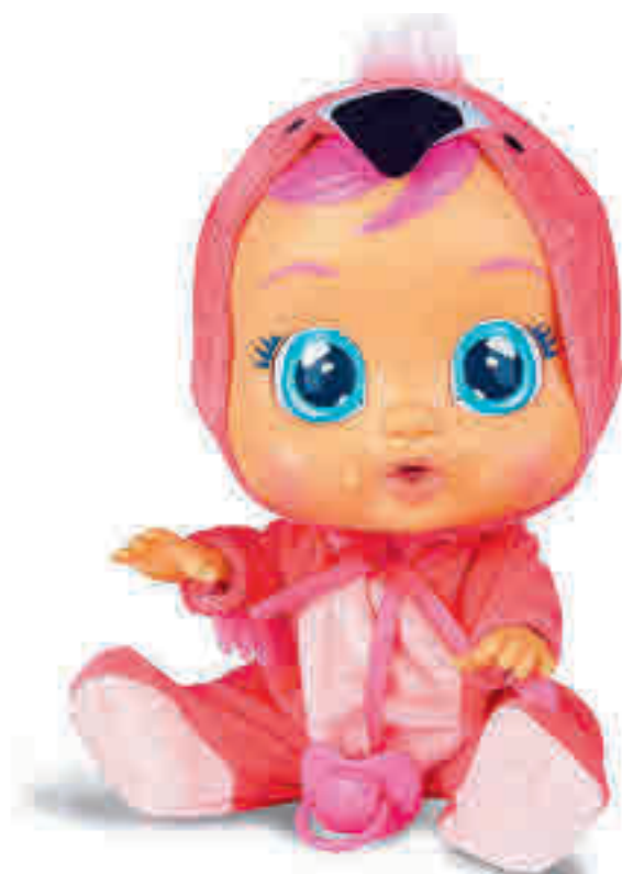
BEBÉS LLORONES, DE IMC: Tienen pelo de verdad y están fabricados con ojos de cristal. Todos los bebés de la gama 'llorones' reproducen lágrimas realistas cada vez que se les quita el chupete. Se les puede calmar tumbándoles o volviéndoselo a poner. Si no, cada vez llorará más fuerte.