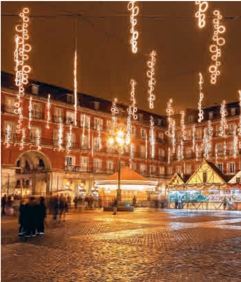
La Navidad ya se respira en toda la Comunidad de Madrid