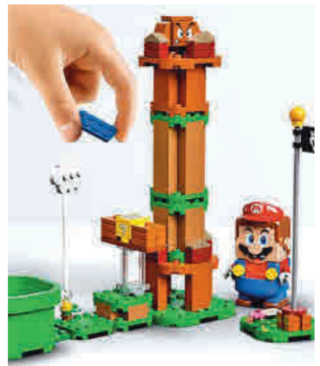
PACK INICIAL MARIO BROS LEGO: El mítico fontanero llega a Lego para que los más pequeños puedan ordenar y reorganizar su mundo a su antojo. El set incluye una figura de Mario que emite respuestas y expresiones inmediatas a través de las pantallas LCD y de un altavoz incorporado.