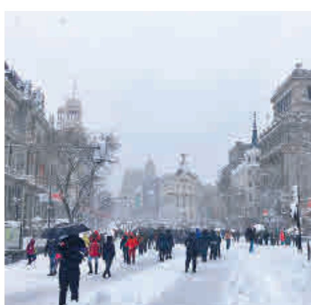
Retorno de 92 años: Sobre la posibilidad de que Madrid vuelva a tener una borrasca como la de 'Filomena', los responsables de la Agencia Estatal de Meteorología (Aemet) señalaron que "hay un periodo de retorno para estos fenómenos de 92 años"

jas y habrá heladas generalizadas. En la Meseta Central se espera la aparición de nieblas, muy típicas en esta época del año, que pueden dificultar los desplazamientos en esas jornadas festivas.