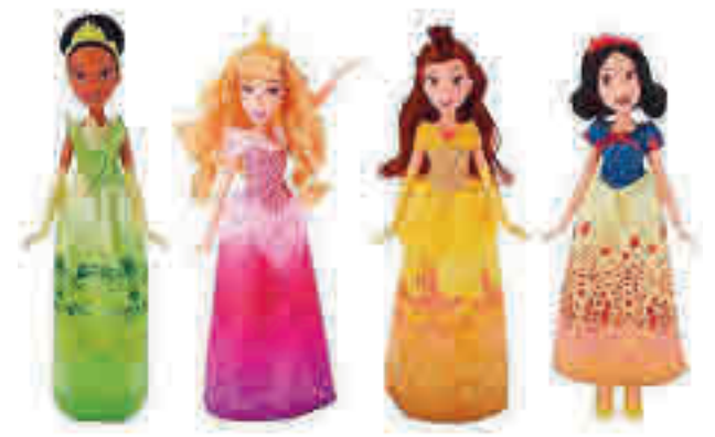
PRINCESAS DISNEY, DE HASBRO: Figuras de trece centímetros, recomendadas a partir de tres años, donde se pueden encontrar a Blancanieves, Bella, Rapunzel, Mulan, Jazmín y Pocahontas, entre otras. Las versiones 'Royal Shimmer' incluyen vestidos brillantes, diademas y zapatos.