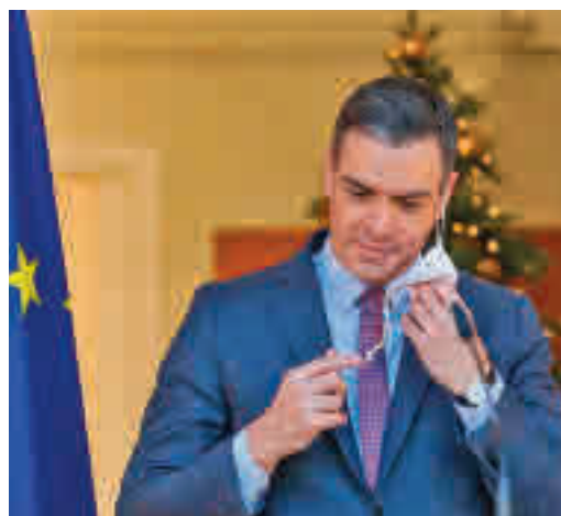
Pedro Sánchez, en su comparecencia del día 19

EL PERIÓDICO GENTE NO SE RESPONSABILIZA NI SE IDENTIFICA CON LAS OPINIONES QUE SUS LECTORES Y COLABORADORES EXPONGAN EN SUS CARTAS Y ARTÍCULOS