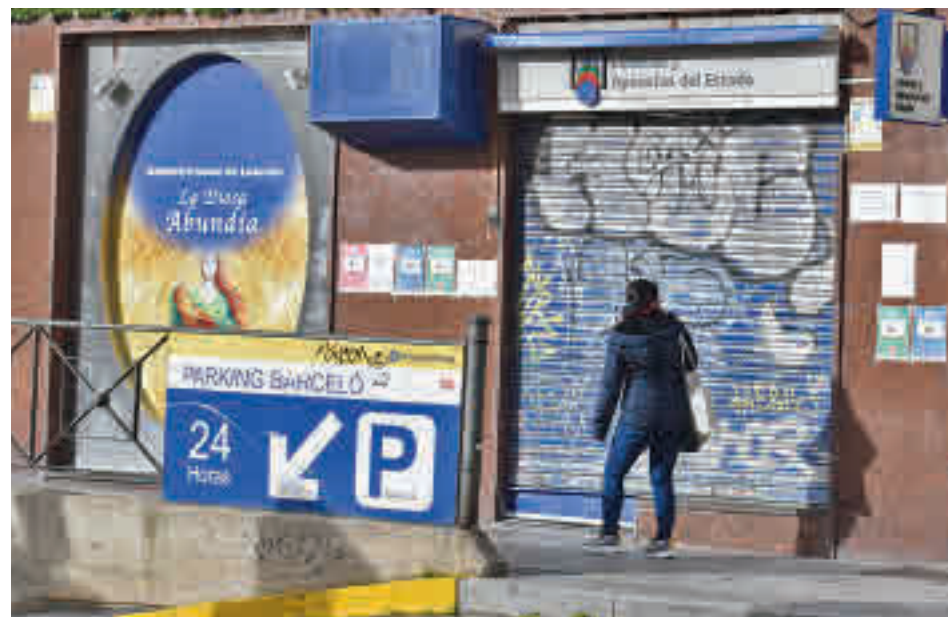
La administración estaba cerrada por la protesta de los loteros

Reivindican una subida en las comisiones que cobran por cada premio y denuncian que algunos de ellos han tenido que cerrar.