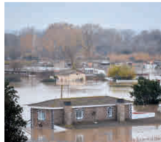
El clima hace estragos en las viviendas

viviendas del Ministerio de Transportes, Movilidad y Agenda Urbana. Así lo ha destacado el informe 'El impacto de los fenómenos atmosféricos en el seguro del hogar desde una perspectiva social' de