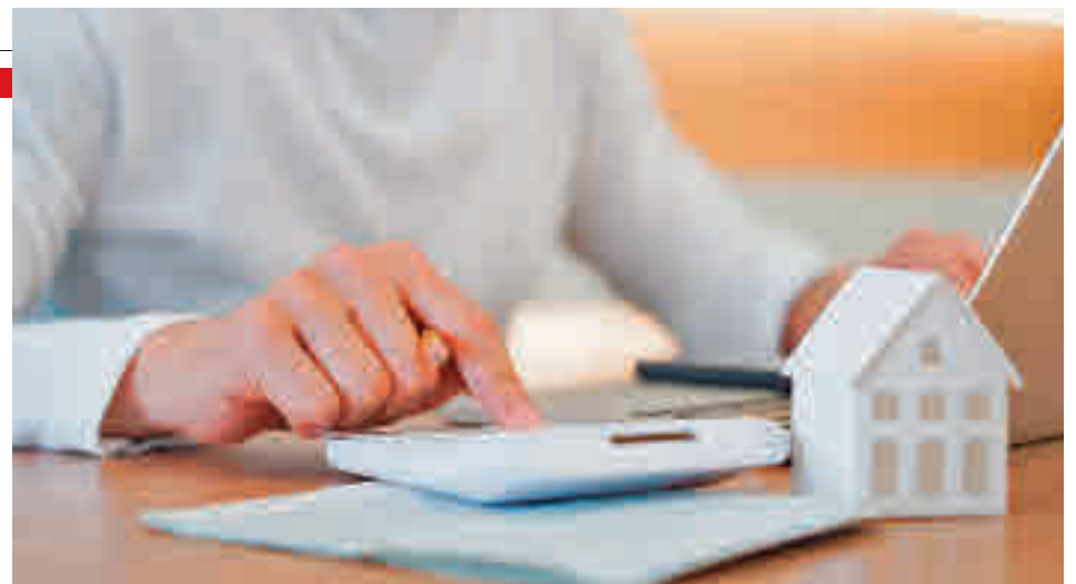
Un 41% destinaría el premio de la lotería a comprar una vivienda

El comparador Acierto.com aporta una serie de recomendaciones para evitar que el dinero se dilapide en poco tiempo • Comprar un inmueble o liquidar la hipoteca son algunas de las inversiones más requeridas