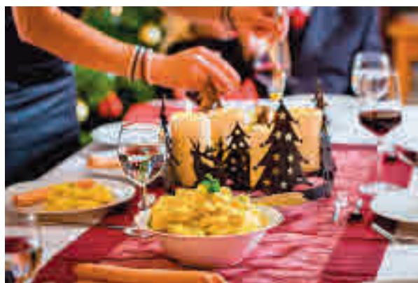
Cena de Navidad

se agobian por exceso de trabajo y el incremento de gasto, que se traduce en una ruptura de su rutina y en un daño de su salud. Además, la situación epidemiológica ha hecho que muchos mayores se aislen aún más. Esta soledad agrava en navida-