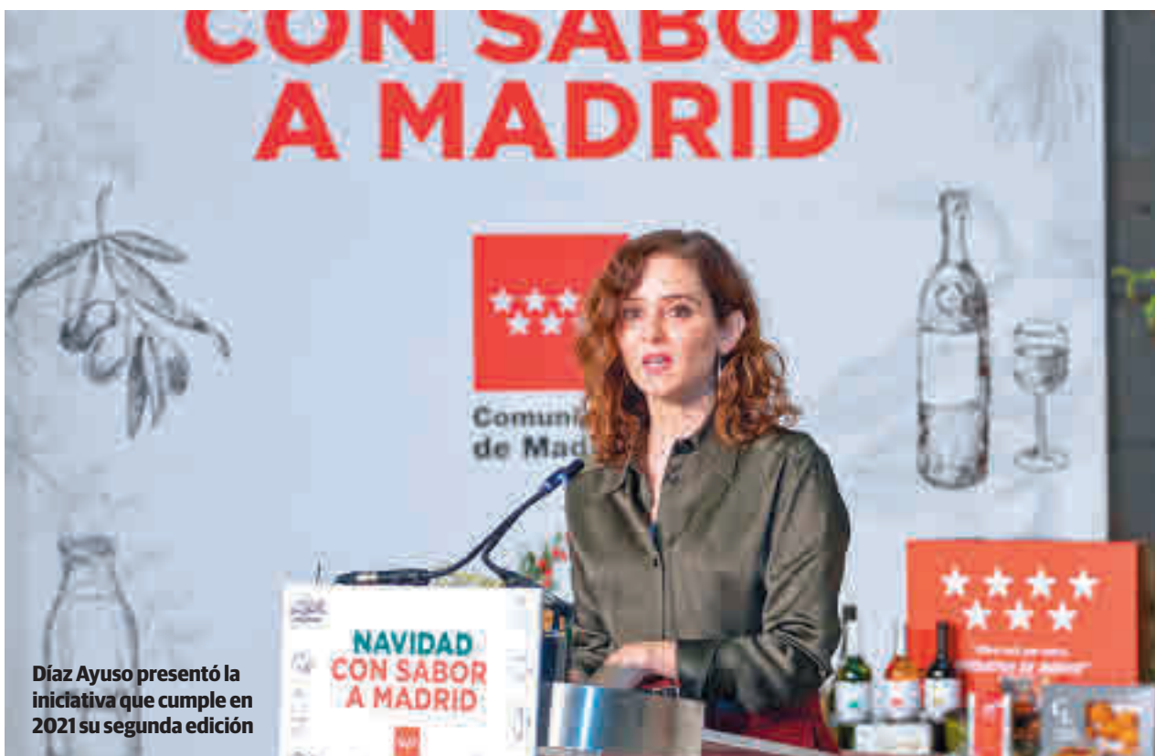
Díaz Ayuso presentó la iniciativa que cumple en 2021 su segunda edición