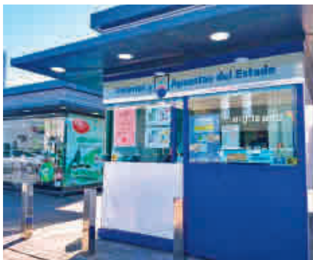
La administración de lotería sansera

En cuanto al resto de las poblaciones del Sur, Leganés se llevó un pellizco del otro cuarto premio, el que correspondió al 42.833, aunque la cantidad exacta de décimos que han salido de la administración situada en el calle San Rosa no se había especificado al cierre de estas líneas. Las otras ciudades de la zona no tuvieron tanta suerte.