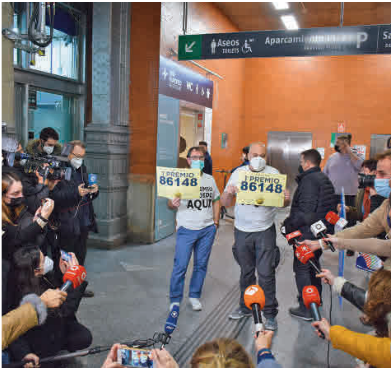
CHEMA MARTÍNEZ / GENTE

SORTEO EXTRAORDINARIO DE LOTERÍA | PÁGS 4-7