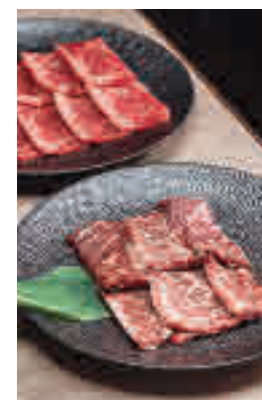
Cortes de la carne

Más allá de la carne, los comensales podrán deleitarse en este menú de 50 euros de platos como el Kimchi, Variado de Namur, Ensalada Goma y el exquisito Bibimbap. Como postre se ofrece helado de diferentes sabores: sésamo negro, mango o yogur.