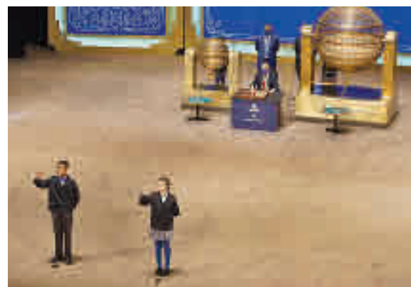
Momento en el que se cantó el Gordo en el Teatro Real

Entre las celebraciones, la vendedora mira al futuro y anima a los participantes para sorteos próximos: "Aquí os esperamos para la lotería de El Niño".