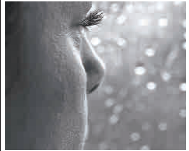
La Navidad, época de celebración, pero también de recuerdo