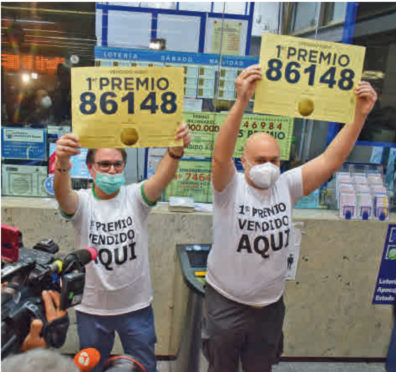
CHEMA MARTINEZ / GENTE

SORTEO EXTRAORDINARIO DE LOTERÍA | PÁGS 4-7