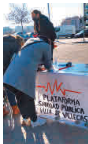
Una de las mesas de recogida

Esta es una de las acciones que este colectivo tiene previsto promover a corto plazo