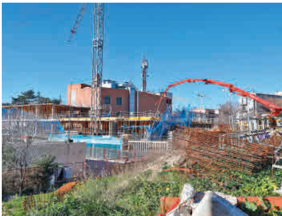
Estado actual de las obras