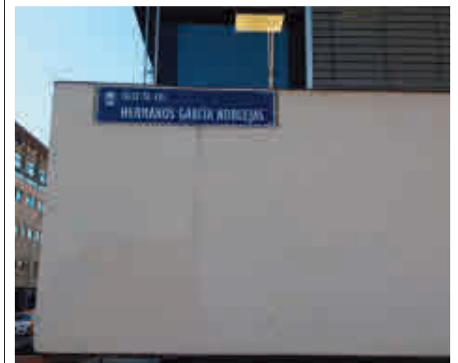
Una de las placas de Hermanos García Noblejas