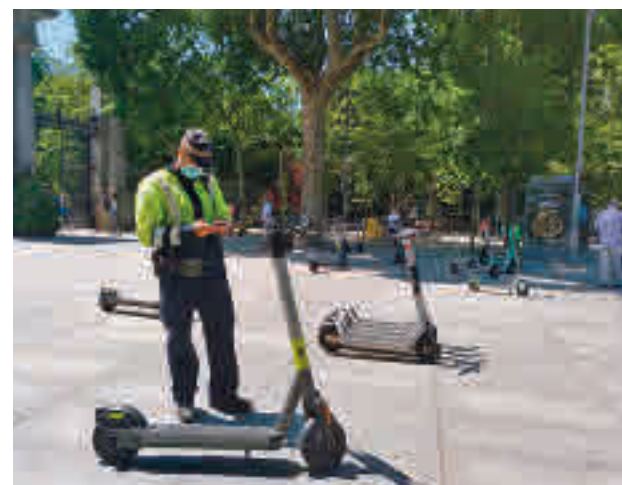
Un agente multa a un patinete junto a El Retiro

La media de sanciones mensuales fue de 12.502, siendo junio y julio los meses donde más denuncias se realizaron al detectar más prácticas irregulares, alcanzando las 20.506 multas en junio y las 21.496