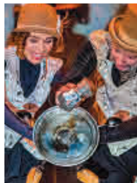
'Ilusia' llega a Las Rozas