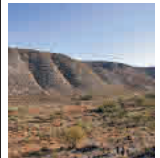
Parque del Sureste