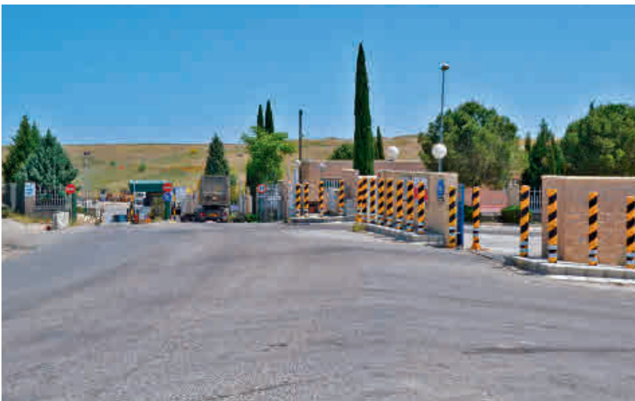
Centro de tratamientos de residuos de Pinto