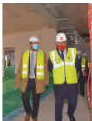
Visita a las obras

Además de a los valdemoreños, estos nuevos juzgados prestarán servicio a los vecinos de las localidades vecinas de Chinchón, Ciempozuelos, San Martín de la Vega, Titulcia, Torrejón de la Calza-