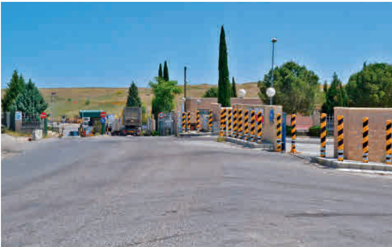
Centro de tratamientos de residuos de Pinto