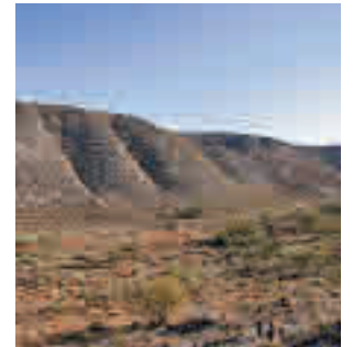
Parque del Sureste