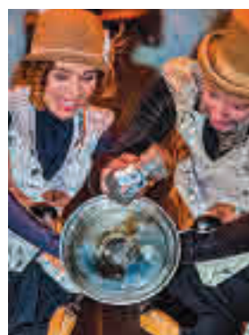
'Ilusia' llega a Las Rozas