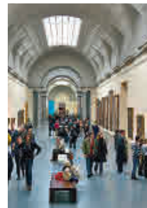
Museo del Prado

El Plan de Actuación 2022-2025 establece la hoja de ruta de la institución y expresa la visión sobre cuál ha de ser su papel en la sociedad como una institución cultural "comprometida con todos los públicos, referente de accesibilidad universal y en integración social y cultural", al tiempo que marca la necesidad