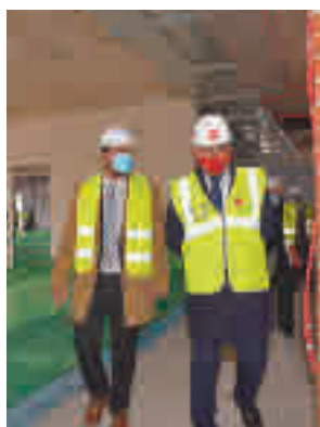
Visita a las obras

Además de a los valdemoreños, estos nuevos juzgados prestarán servicio a los vecinos de las localidades vecinas de Chinchón, Ciempozuelos, San Martín de la Vega, Titulcia, Torrejón de la Calza-