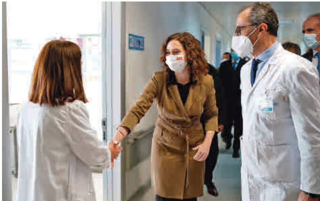
Presentación de la nueva videoconsulta en el Hospital del Henares

La presidenta de la Comunidad de Madrid, Isabel Díaz Ayuso, realizó el anuncio durante su visita este martes 18 al Hospital del Henares, en Coslada. "Es todo un hito asistencial que se traducirá, este mismo año, en más accesibilidad, mejor atención, menos desplazamientos y una relación médico-paciente más cercana", indicó Ayuso, que explicó que con este sistema, por ejemplo, un dermatólogo podrá vigilar una