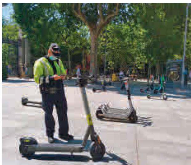
Un agente multa a un patinete junto a El Retiro

La media de sanciones mensuales fue de 12.502, siendo