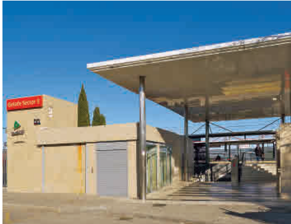
Estación de Cercanías de Sector III

Los pavimentos del aparcamiento, muy envejecidos y deteriorados, presentan irregularidades, hundimientos y sobreelevaciones por las raíces del arbolado de gran porte y su estado actual está acelerando su deterioro. Además, la ordenación actual del tráfico produce congestiones en determinados tramos horarios y los itinerarios peatonales no son accesibles, mientras que el alumbrado público es deficiente y se producen averías con asiduidad. Tampoco hay habilitados espa-