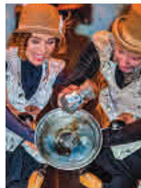
'Ilusia' llega a Las Rozas