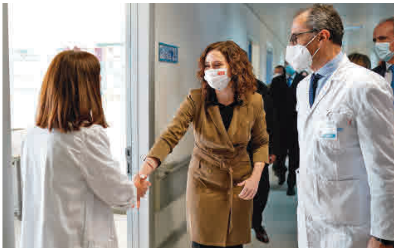
Presentación de la nueva videoconsulta en el Hospital del Henares

La presidenta de la Comunidad de Madrid, Isabel Díaz Ayuso, realizó el anuncio durante su visita este martes 18 al Hospital del Henares, en Coslada. "Es todo un hito asistencial que se traducirá, este mismo año, en más accesibilidad, mejor atención, menos desplazamientos y una relación médico-paciente más cercana", indicó Ayuso, que explicó que con este sistema, por ejemplo, un dermatólogo podrá vigilar una