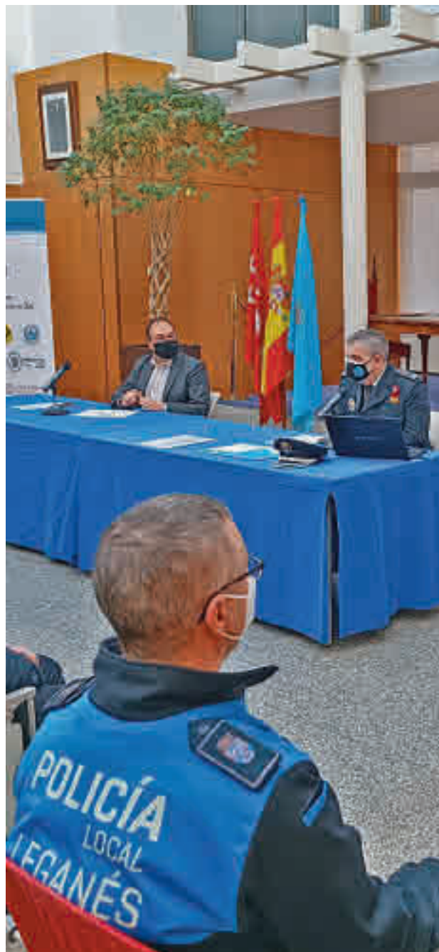
Una de las reuniones que se ha llevado a cabo

"Es una extensión de la CLAP. Cada dos meses se reunirá la Policía Local, técnicos