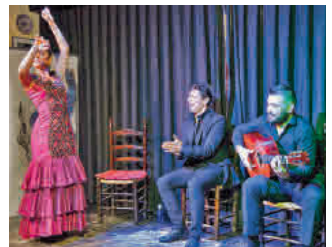
Certamen Silla de Oro

La Asociación Cultural Flamenca Jondo, de La Fortuna, anunció a finales de noviembre la suspensión del concurso debido al retraso en la aprobación del expediente por parte de la Asesoría Jurídica del Ayuntamiento ya que, según sus organizadores, tras 27 años no quieren "improvisar en la planificación del concurso".