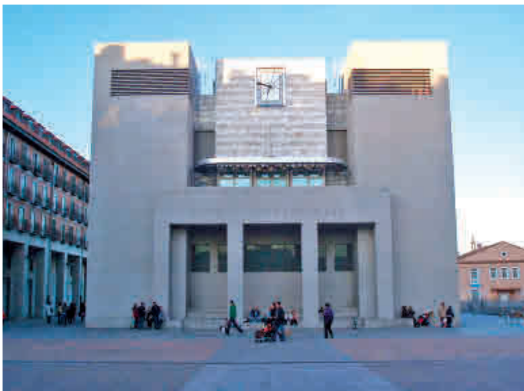
Ayuntamiento de Leganés