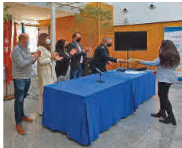
Acto de la Policía Local de Leganés