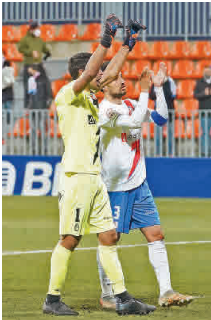
Los jugadores majariegos celebrando su último triunfo

Con el Deportivo como líder indiscutible, los pronósticos apuntan a que la verdadera lucha de la zona alta se centrará en acceder a los puestos de 'play-off'. La com-