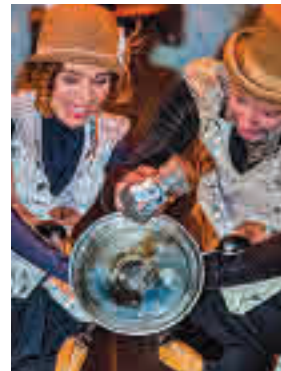
'Ilusia' llega a Las Rozas