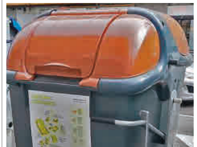
Contenedor de residuos orgánicos

En cuanto a las Zonas Básicas de Salud (ZBS) en las que se divide la localidad, la incidencia más elevada esta semana está en Parque Loranca (3.440) y la más baja en El Naranjo (2.411).