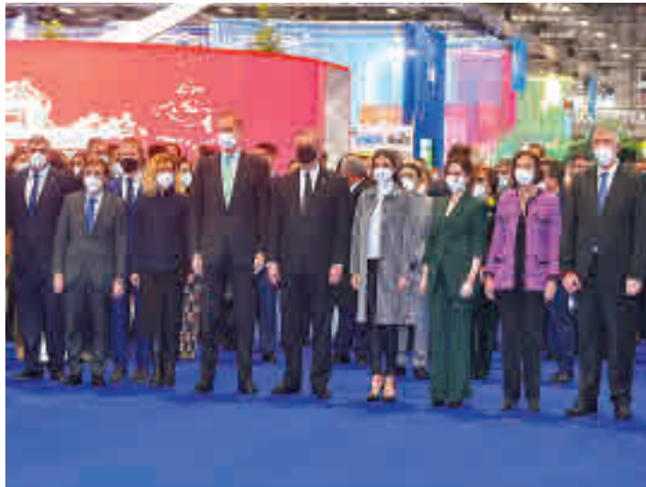
Inauguración de Fitur

Los Reyes de España Felipe y Letizia inauguraron este miércoles la 42ª edición de la Feria Internacional de Turismo (Fitur), que se celebra en Ifema hasta el domingo 23. Se trata de un evento marcado por las fuertes medidas de seguridad para evitar contagios, lo que provoca largas colas a la entrada. Para acceder, los asistentes tendrán que mostrar el Pasaporte Covid o bien acreditar una PCR o un test de antígenos negativo realizado en las últimas 24