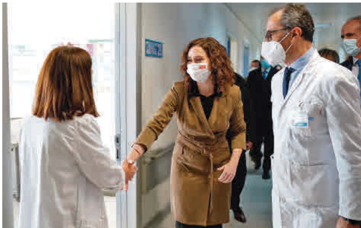
Presentación de la nueva videoconsulta en el Hospital del Henares

La presidenta de la Comunidad de Madrid, Isabel Díaz Ayuso, realizó el anuncio durante su visita este martes 18 al Hospital del Henares, en Coslada. "Es todo un hito asistencial que se traducirá, este mismo año, en más accesibilidad, mejor atención, menos desplazamientos y una relación médico-paciente más cercana", indicó Ayuso, que explicó que con este sistema, por ejemplo, un dermatólogo podrá vigilar una