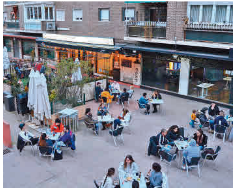
Una de las terrazas situadas en la capital

Por otro lado, las terrazas que a la entrada en vigor de esta ordenanza estén instaladas en bandas de estacionamiento podrán mantenerse durante los años 2022 y 2023