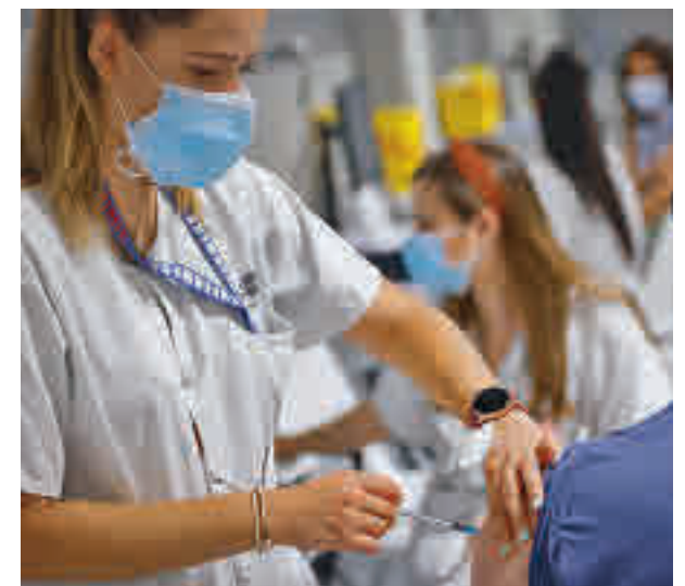
Vacunación en la Comunidad de Madrid

cibieron la primera. El objetivo es facilitar los trámites a las familias para que puedan completar en plazo la pauta de inmunización de sus hijos. Si no puedan acudir a la cita que reciban por SMS en su teléfono móvil, podrán cambiarla a través del enlace que les será facilitado en el propio mensaje y que les dará acceso a la aplicación de autocita, introduciendo el DNI o el Código de Identificación Personal Autonómico CIPA) que figura en la Tarjeta Sanitaria pública.