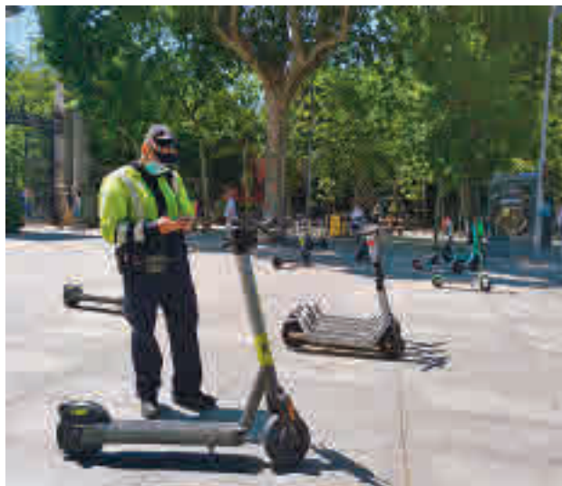
Un agente multa a un patinete junto a El Retiro

La media de sanciones mensuales fue de 12.502, siendo