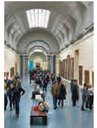
Museo del Prado

El Plan de Actuación 2022-2025 establece la hoja de ruta de la institución y expresa la visión sobre cuál ha de ser su papel en la sociedad como una institución cultural "comprometida con todos los públicos, referente de accesibilidad universal y en integración social y cultural", al tiempo que marca la necesidad