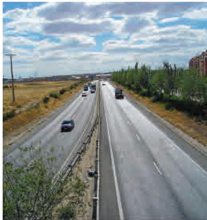
Carretera M-506 a su paso por Fuenlabrada