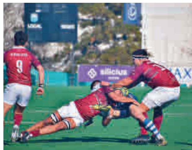
El Alcobendas superó claramente al CR La Vila

Con tanta igualdad, cualquier jornada puede ser propicia para que se den cambios en la