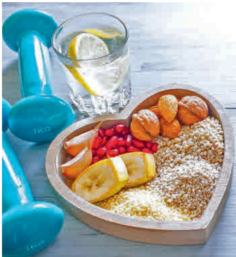
Caminar una hora tres o cuatro días a la semana es suficiente para estar activos E.P.

2. Grasas saludables: Aunque tengan muy mala fama, existen grasas saludables, ya sean de origen animal o vegetal. Podemos encontrarlas en el aguacate, frutos secos, semillas y aceitunas, así como en el salmón, las sardinas y el atún, que contienen altos niveles de Omega-3, que protegen al corazón y a las neuronas. Además, colaboran en la absor-