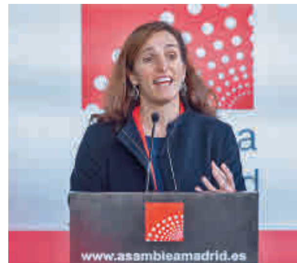
Mónica García, portavoz de Más Madrid

muy convencidos con el plan presentado por Díaz Ayuso. La secretaria de las Mujeres de CCOO Madrid, Lidia Fernández Montes, lo calificó de "puro acto de propaganda" e insistió en acabar con la precariedad del empleo femenino como única salida. "Ayuso nos vuelve a hacer un juego de manos con esta propuesta que en la realidad significa nada, que es la enésima vez que presenta y que está dotada en los presupuestos de 2022 con 29,6 millones de euros", añadió.