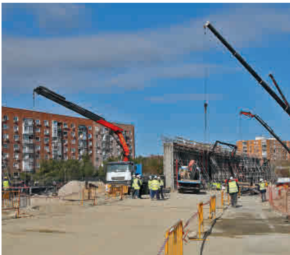
Varios obreros trabajan en la zona