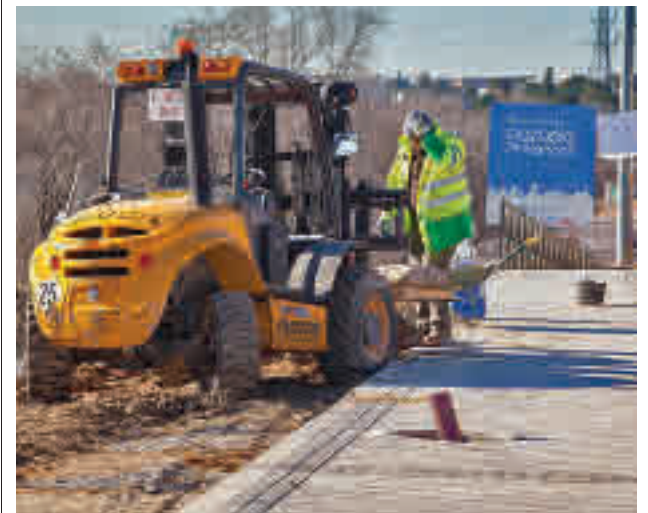
Un obrero trabaja en una de las aceras de la vía

Por otro lado, se está redactando un nuevo plan para completar esta actuación con la ejecución de aceras y nuevo alumbrado público en el tramo de esta misma carretera entre las avenidas del Talgo y de Arroyo Pozuelo, unos trabajos cuyo comienzo se prevé para el segundo semestre de este año.