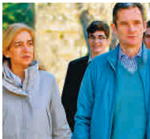
La infanta Cristina y Urdangarin, protagonistas

EL PERIÓDICO GENTE NO SE RESPONSABILIZA NI SE IDENTIFICA CON LAS OPINIONES QUE SUS LECTORES Y COLABORADORES EXPONGAN EN SUS CARTAS Y ARTÍCULOS