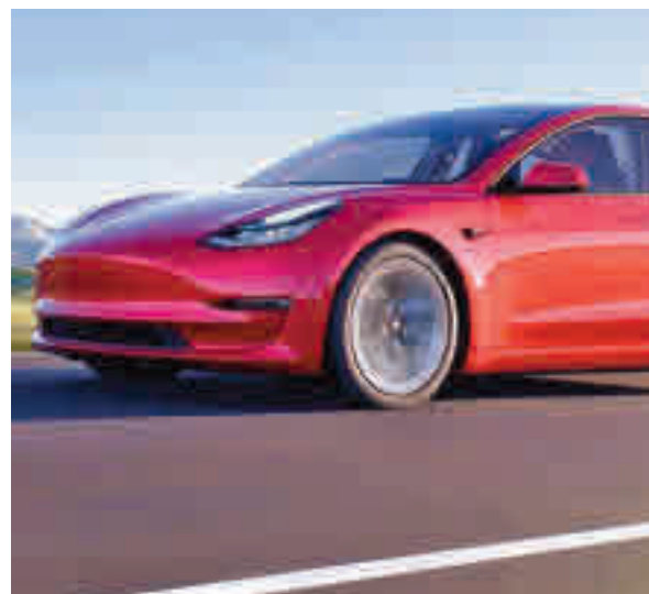
Imagen promocional del Model 3 TESLA

27.538 unidades y un crecimiento del 11% en comparación con el año pasado. La demanda de este modelo eléctrico está en línea con la tendencia registrada en Europa, donde el pasado mes de diciembre casi uno de cada tres vehículos que se matricularon (29,3%) era un modelo de bajas emisiones. El siguiente modelo es el Renault Zoe con 11.181 unidades.