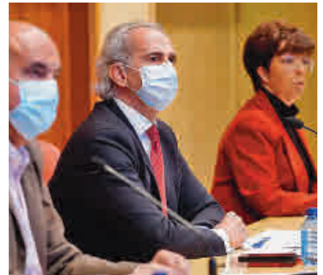
Ruiz Escudero, durante la rueda de prensa

mente entre las personas más vulnerables. En este marco, se enviarán 330.000 SMS para promover la administración de la tercera dosis al grupo de población con edades entre 60 a 69 años y pacientes con factores de riesgo. Escudero dejó en manos de la Comisión de Salud Pública la posibilidad de reducir las cuarentenas a cuatro días, en lugar de los siete actuales, como han solicitado los empresarios madrileños para paliar el efecto negativo de las bajas laborales en la economía.