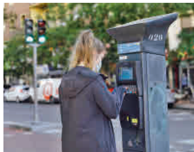
Uno de los parquímetros de la capital

Además, siempre que se declare un escenario de limitaciones de movilidad de los recogidos en el Protocolo de Actuación para Episodios de