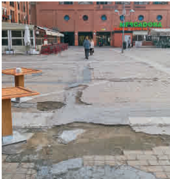
Uno de los desperfectos en el pavimento que serán solucionados

LA ACTUACIÓN TIENE UN PRESUPUESTO DE 4,9 MILLONES DE EUROS