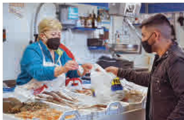
Algunos de los beneficiados por la iniciativa

En el total de inserciones destacan las 238 de personas con problemas de salud mental y emocional. "Este año ha sido más significativo que nunca el refuerzo de nuestra línea de atención a la salud mental, impulsando oportu-