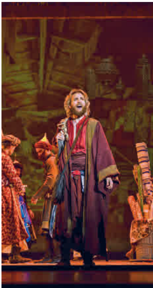
El musical 'El médico'

Dentra de la oferta de Espacio Ibercaja Delicias habrá un gran espacio reservado para los musicales. De hecho, el