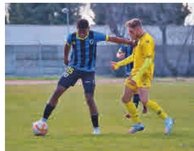
Parla y Alcorcón B tratan de huir del descenso

El miércoles 2 se jugarán varios partidos aplazados, como el Pozuelo-Villaverde, Torrejón-Moratalaz o el Complutense-Villaviciosa.