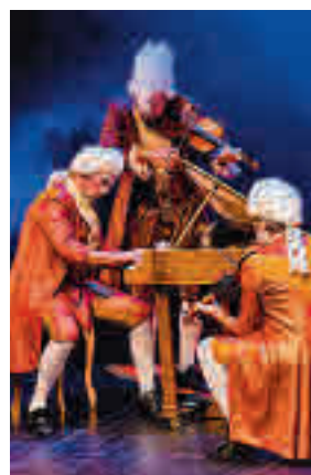
'Maestrissimo' de Yllana

'Vidas enterradas' es el título de una serie de reportajes de la Cadena Ser. Partiendo de ese material, las compañías Corsario, L'OM-Imprebis, Micomicón y Temple