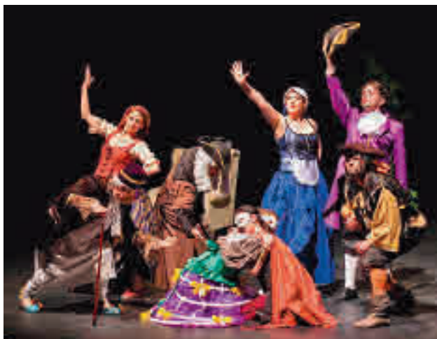
Una de las representaciones de la última edición

Los jóvenes fueron denunciados, aunque no detenidos, por un delito de tenencia de armas prohibidas.