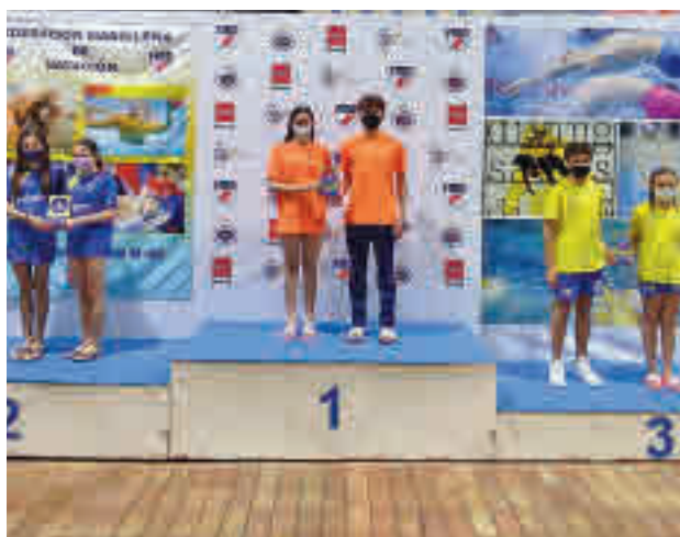
Representantes de los tres primeros clasificados

El podio final lo completaron El Valle, que se impuso en las competiciones femeninas, y el Real Canoe, aupado en gran parte por su tercera plaza en el cuadro masculino.