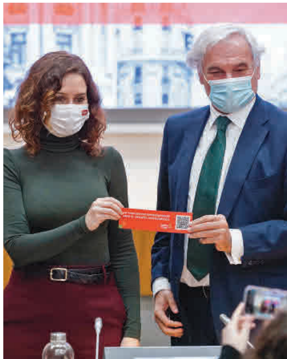
Ayuso presentó la estrategia en una escuela infantil

Se dará prioridad en el Plan Vive a las mujeres embarazadas y familias con hijos hasta los 35 años. Se incluye también la ampliación de hasta 1.200 euros en el IRPF en el alquiler de vivienda habitual para jóvenes menores de esa