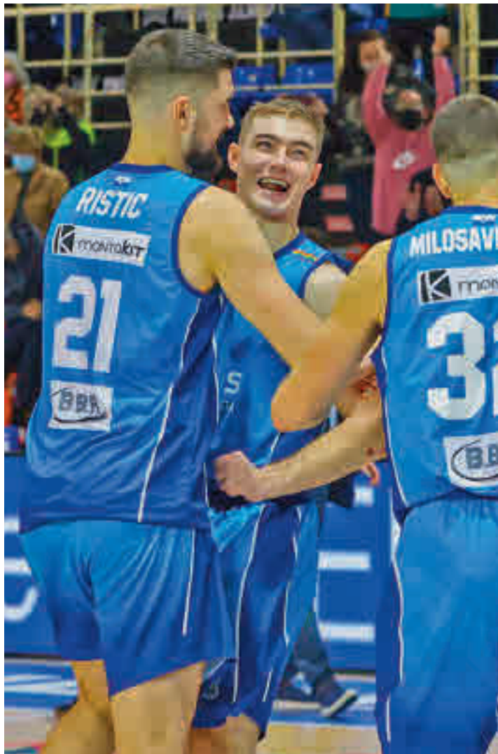
El Urbas se reencuentra con sus aficionados

Tras varias semanas de estar prácticamente más pendientes de los partes médicos que del plano deportivo, el Urbas regresa a la actividad este fin de semana, siem-