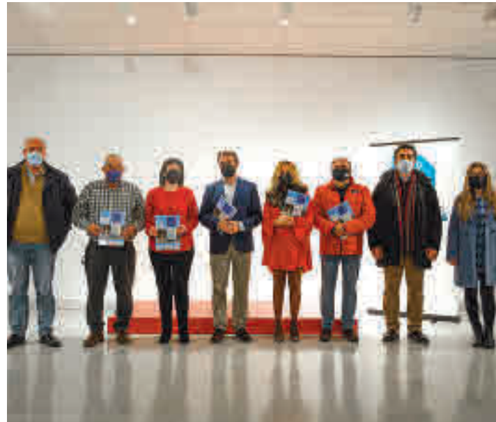
Presentación del estudio

Se pondrán en marcha una veintena de actuaciones para ofrecer oportunidades a la población en paro ● Parten de las necesidades detectadas en un estudio de los agentes sociales