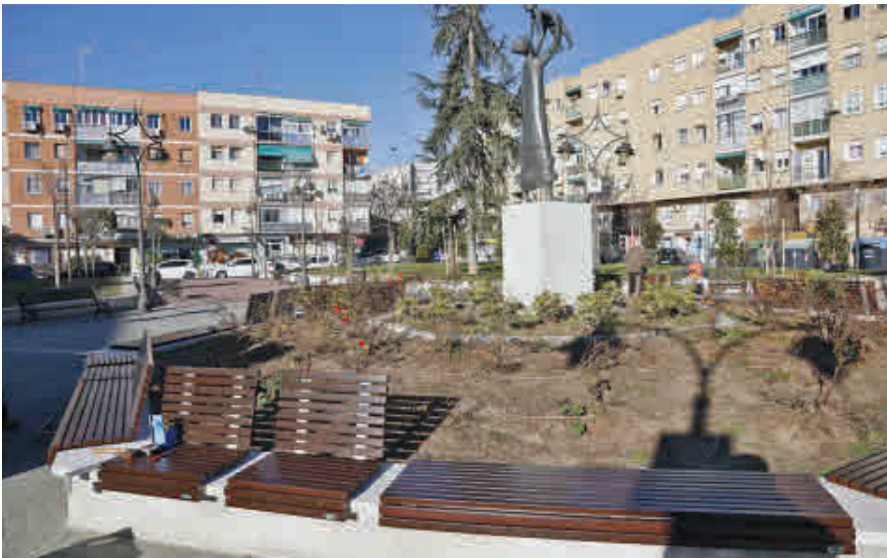
Algunos de los bancos que se están instalando en Getafe