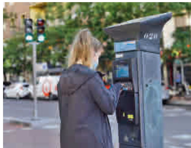
Uno de los parquímetros de la capital

Toda la actualidad de los distritos de Madrid, en nuestra web