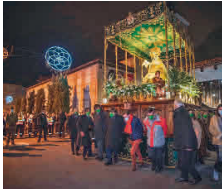
Uno de los momentos más solemnes de la procesión

La procesión de la Virgen de la Paz congregó el pasado lunes 24 a unas 10.000 personas • El miércoles tuvo lugar la gala donde se hizo entrega del Premio a los Valores Humanos