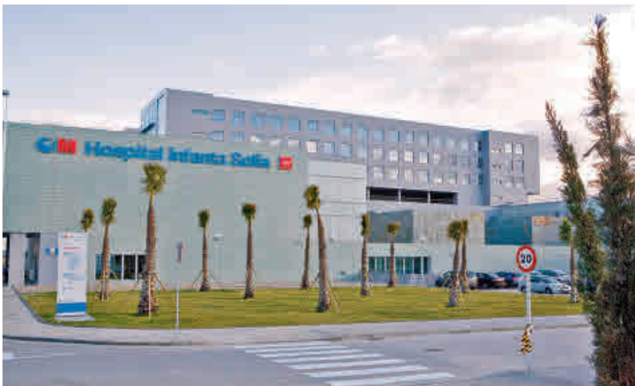
Las instalaciones del hospital siguen sin tener un funcionamiento pleno