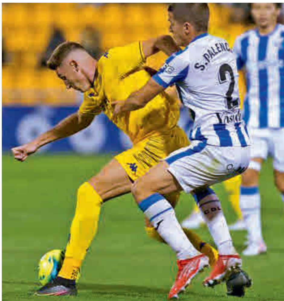
En el partido de la primera vuelta, alfareros y pepineros se repartieron los puntos (3-3)

En el caso de los representantes madrileños, parece claro que el sufrimiento será la nota común. Un buen ejemplo de ello será el derbi de necesidades que tendrá lu-