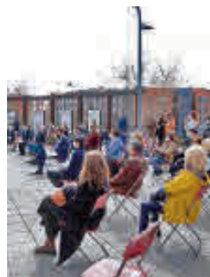
Plaza de la Literatura

modena Grandes. La moción, presentada de forma conjunta por Podemos, PSOE y Cs, consiste en la instalación de un panel biográfico en la Plaza de la Literatura, dentro del Parque de Cataluña. La petición de este homenaje se sustenta, además, en una moción aprobada por unanimi-