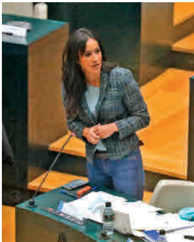
La intervención de la vicealcaldesa, Begoña Villacís

forman el Grupo Mixto. A la entrada en vigor de esta norma desaparecerán las más de 2.000 ampliaciones amparadas en la resolución 51 por la Comisión de Terrazas de Hostelería y Restauración, si bien permanecerán hasta 2023 las situadas en estacionamientos siempre y cuando no formen parte de zonas de protección acústica (ZPAE) o zonas saturadas. Además, cuando estén en áreas ambientalmente protegidas (ZAP), el distrito podrá reducir su capacidad hasta el 40% de la ocupación. Una de las principales novedades y motivo de controversia, son las