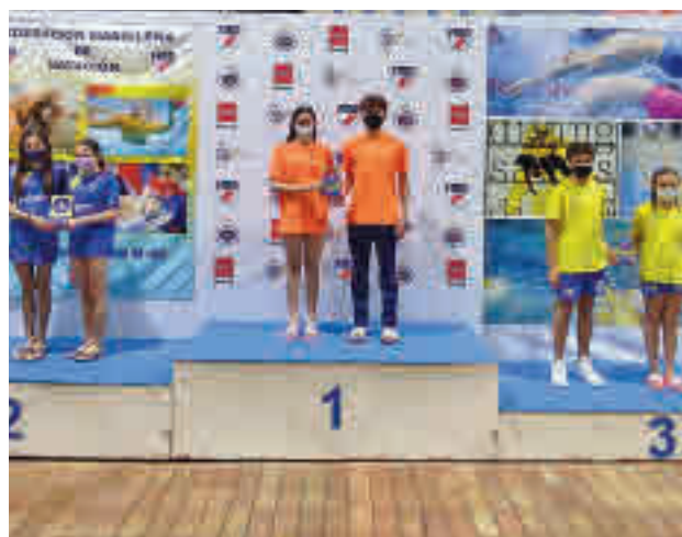
Representantes de los tres primeros clasificados

El podio final lo completaron El Valle, que se impuso en las competiciones femeninas, y el Real Canoe, aupado en gran parte por su tercera plaza en el cuadro masculino.