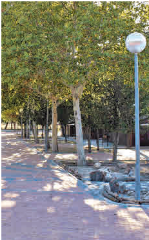
Parque de La Pollina

Aunque haya solo un ganador, el Ayuntamiento se reserva el derecho de tener en