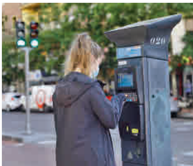
Uno de los parquímetros de la capital

Tras su modificación a finales del año pasado, la tasa establece recargos para el aparcamiento en función de la concentración media de dióxido de nitrógeno (NO2) de las estaciones de fondo urbano entre las 0 y 23 horas del día anterior. De esta manera, el importe del servicio se incrementará un 60% o un 100% en función de si los niveles de dióxido de nitrógeno