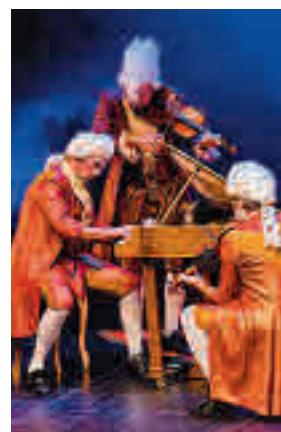
'Maestrissimo' de Yllana

'Vidas enterradas' es el título de una serie de reportajes de la Cadena Ser. Partiendo de ese material, las compañías Corsario, L'OM-Imprebis, Micomicón y Temple