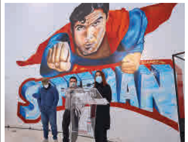
Inauguración de la exposición

En lo que tiene que ver con las Zonas Básicas de Salud (ZBS) en las que se divide la ciudad, la más afectada en estos momentos es la de Parque Loranca (2.663), seguida de Cuzco (2.652). La que tiene una tasa más baja es El Naranjo (2.103).