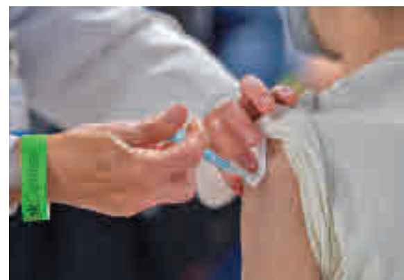
Vacunación en la Comunidad de Madrid

CIPA (Código de Identificación Personal Automático) que figura en la Tarjeta Sanitaria pública de la Comunidad de Madrid, el primer apellido y la fecha de nacimiento. En caso de que no se disponga de Tarjeta Sanitaria pública (por ser