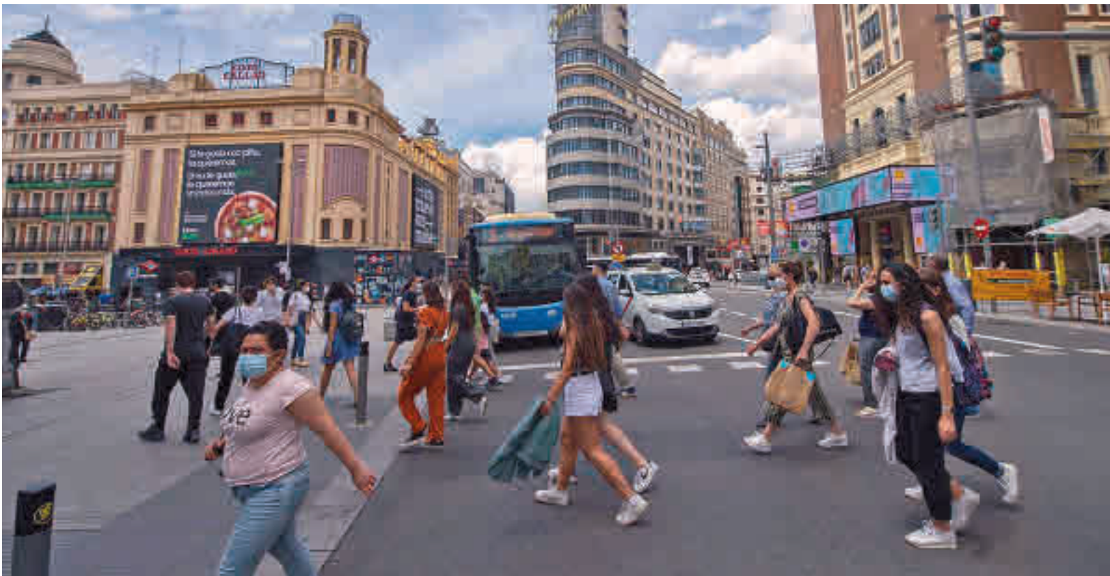
La mascarillas seguirán siendo obligatoria en los exteriores