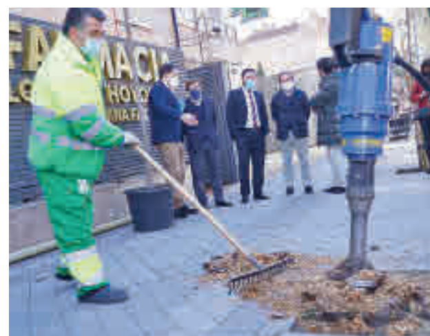
Un trabajador completa la plantación en un alcorque

La plantación cuenta con un presupuesto de 9 millones de euros. Los distritos que