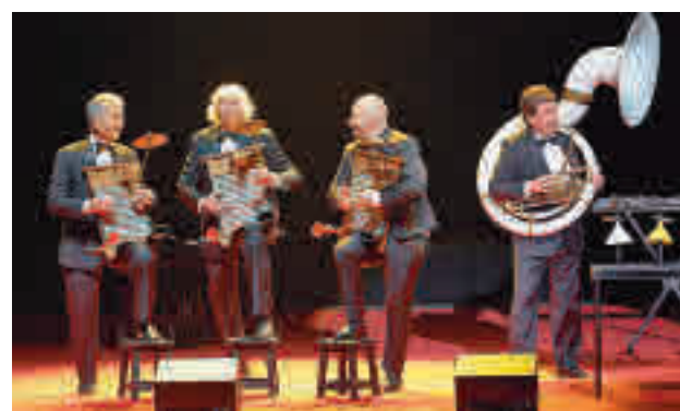
Proceso: En ‘Viejos Hazmerreíres’, Les Luthiers hacen un repaso por piezas como ‘Las majas del bergantín’, un proceso que “arranca con una selección gruesa” para después “ir refinando el repertorio definitivo, intentando que ofrezca variedad de géneros”.

“LA PANDEMIA NO DEBERÍA HABERNOS QUITADO LAS GANAS DE REÍR”