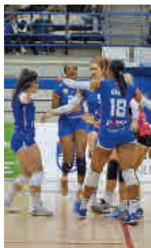
Un partido del Leganés

varios positivos por covid en el cuadro riojano, el Leganés ha vuelto a toparse de lleno con la sexta ola de la pandemia. Este pasado miércoles