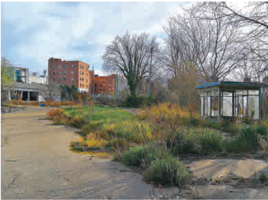
Una de las naves del conjunto de la zona industrial