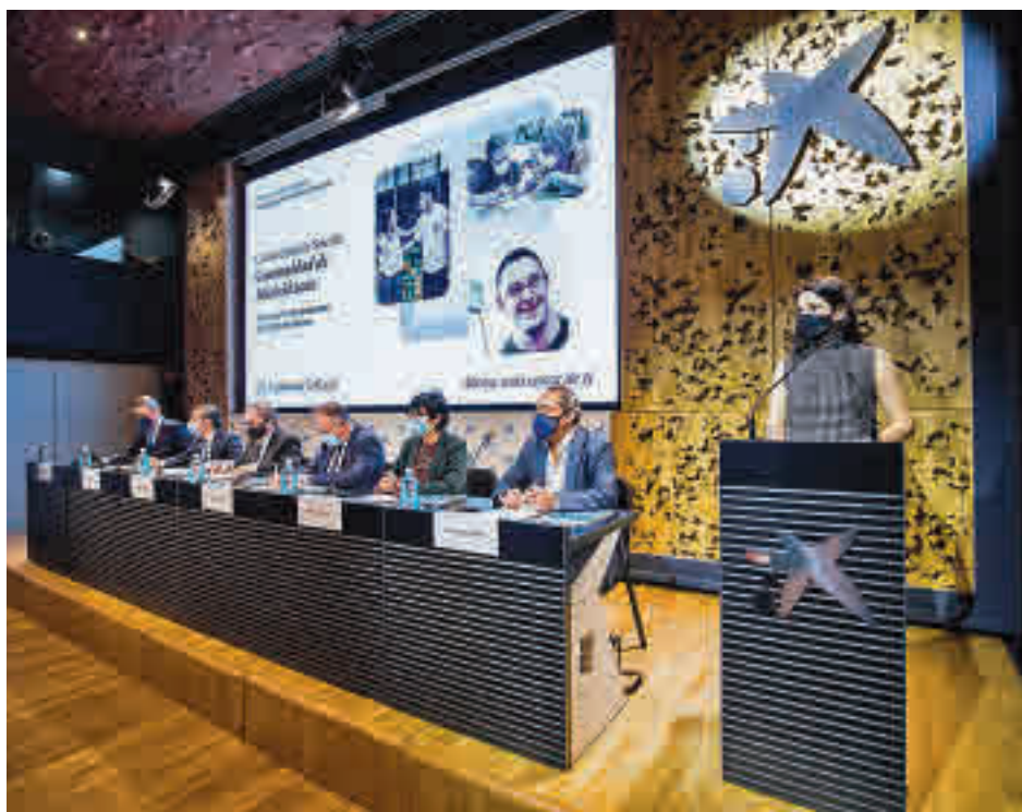
Presentación de la nueva convocatoria

El aumento del presupuesto permite que cada una de estas iniciativas (Simón calcula que se seleccionarán entre 150 y 200) recibirá una asignación máxima de 50.000 euros, 10.000 más que en la convocatoria del año pasado. Otra novedad es que las entidades que tienen un convenio vigente de las ayudas de 2021 podrán presentarse a este proceso. El único requisito es que justifiquen al menos un 50% de la cantidad concedida. La Fundación 'la