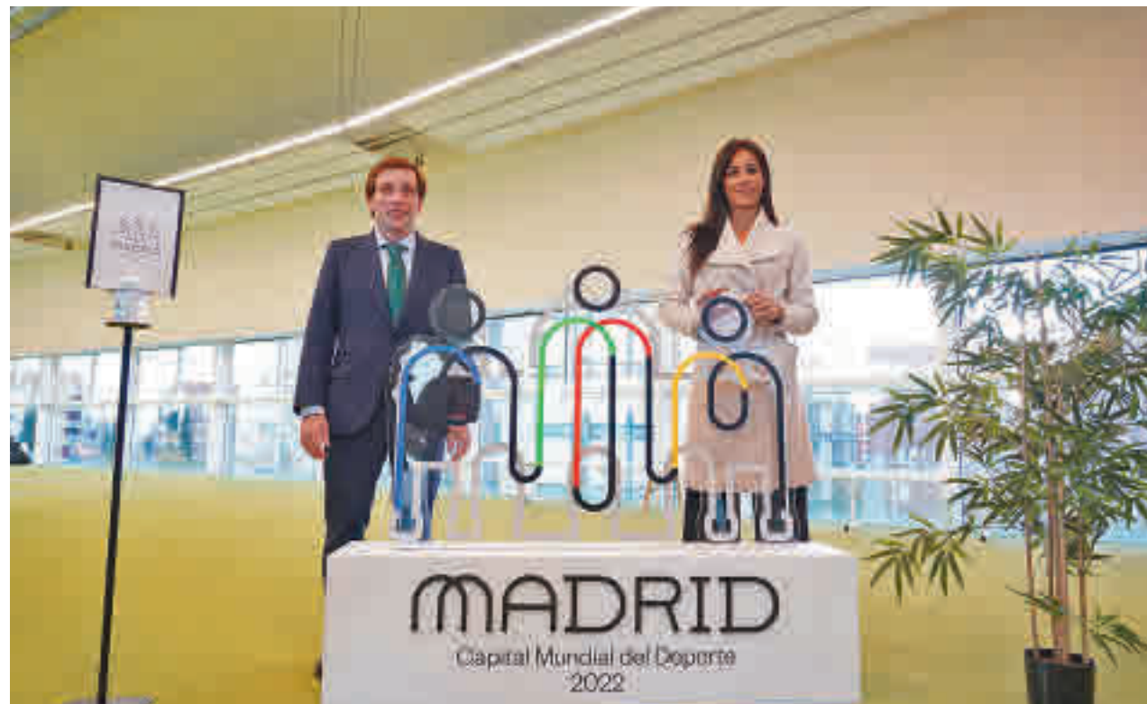
El alcalde y la vicealcaldesa posan con el logo madrileño

Según fuentes municipales, la condición de Capital Mundial del Deporte dejará en torno a los 100 millones de euros, nuevas instalaciones y mejoras en las ya existentes, así como torneos de rugby o campeonatos de patinaje artístico y escalada, entre otras muchas disciplinas. La inversión en instalaciones rondará en torno a los 70-80 millones.