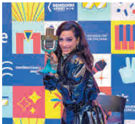
Chanel ganó el Benidorm Fest

EL PERIÓDICO GENTE NO SE RESPONSABILIZA NI SE IDENTIFICA CON LAS OPINIONES QUE SUS LECTORES Y COLABORADORES EXPONGAN EN SUS CARTAS Y ARTÍCULOS