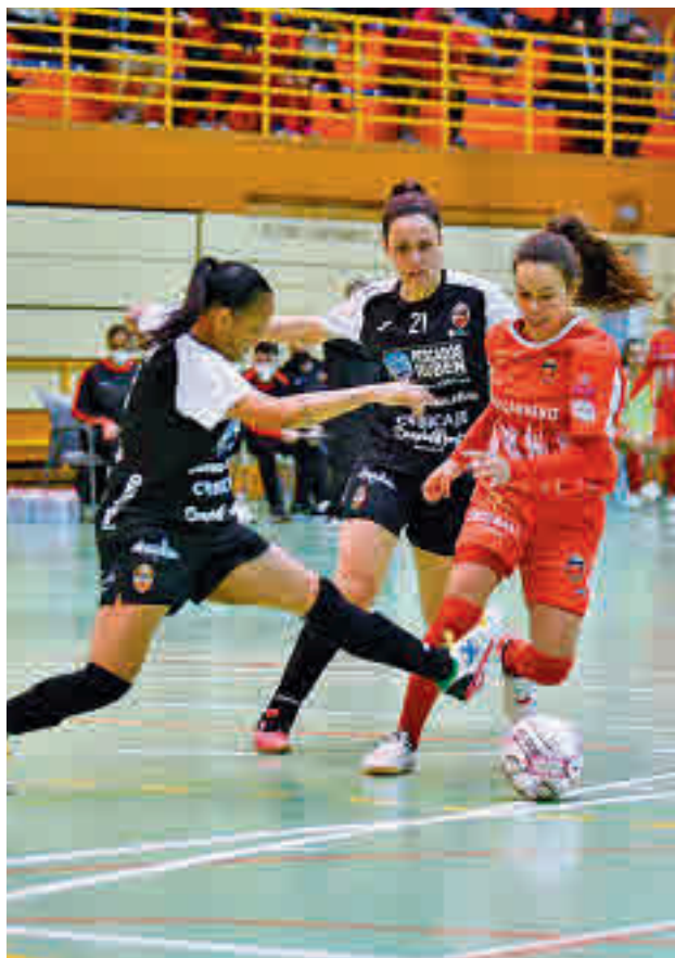
El partido entre el Atlético y el Burela acabó en empate (0-0)

VARIOS PARTIDOS SE TUVIERON QUE APLAZAR POR LA SEXTA OLA DE LA PANDEMIA