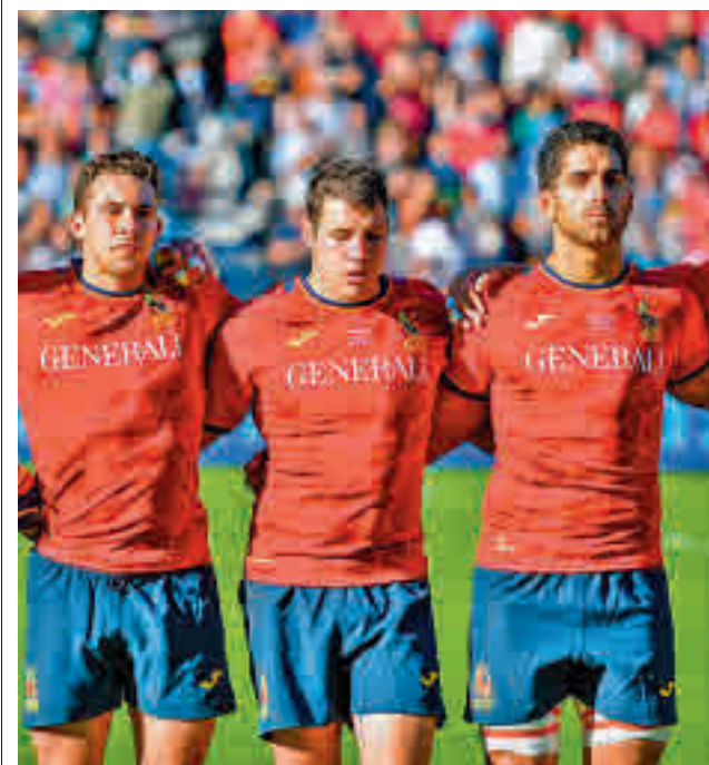
Otra cita en la fase de clasificación FERUGBY

Con 22 puntos en su casillero, el Quimeras Valdemoro necesita sacar adelante alguno de sus tres partidos restantes para jugar el 'play-off' por el título. Este sábado recibe al líder Txuri Urdin.