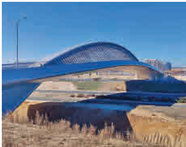
Estado actual del Puente de la Concordia

trada en funcionamiento. Ejecutado por la Junta de Compensación de Valdebebas, la nueva infraestructura viaria tiene una anchura de 25 metros y una longitud total de 214, de los que 162, los que discurren por encima de la M-12, no tienen apoyo alguno, convirtiendo a este puente en el de mayor distancia entre soportes de la Comunidad de Madrid.