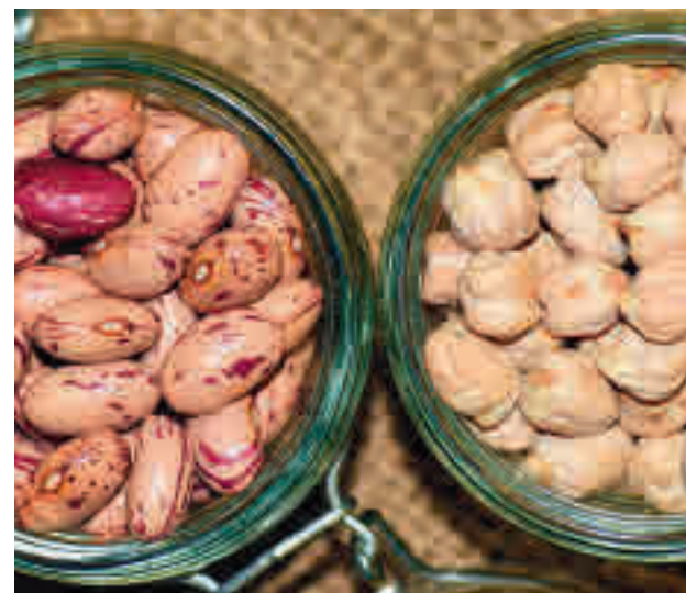
Legumbres producidas en la Comunidad de Madrid

blico. Según un informe elaborado por la Dirección General de Turismo de la Comunidad de Madrid, la asociación ha venido desarrollando una labor de promoción y puesta en valor de la gastronomía madrileña como entidad sin ánimo de lucro de reconocido prestigio. Además, el documento destaca la colaboración estrecha entre ambos actores a través de la organización de eventos, asesoramiento en la elaboración de guías gastronómicas y material promocional y diferentes propuestas de actuación que "permiten mejorar la oferta gastronómica de la región de