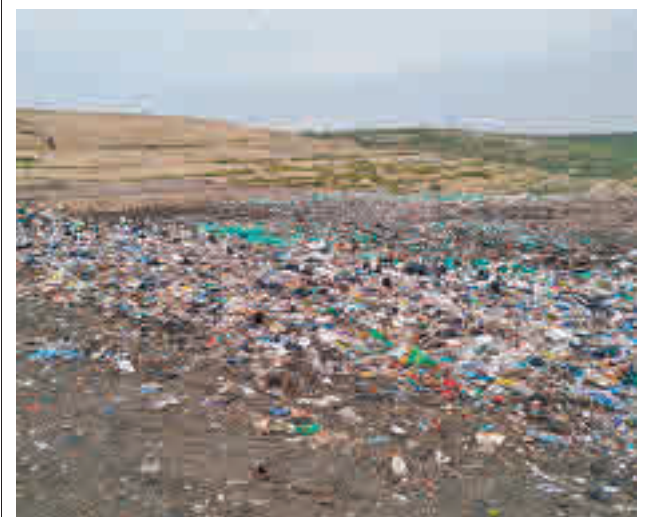
El vertedero situado en Villa de Vallecas

Toda la actualidad de los distritos de Madrid, en nuestra web