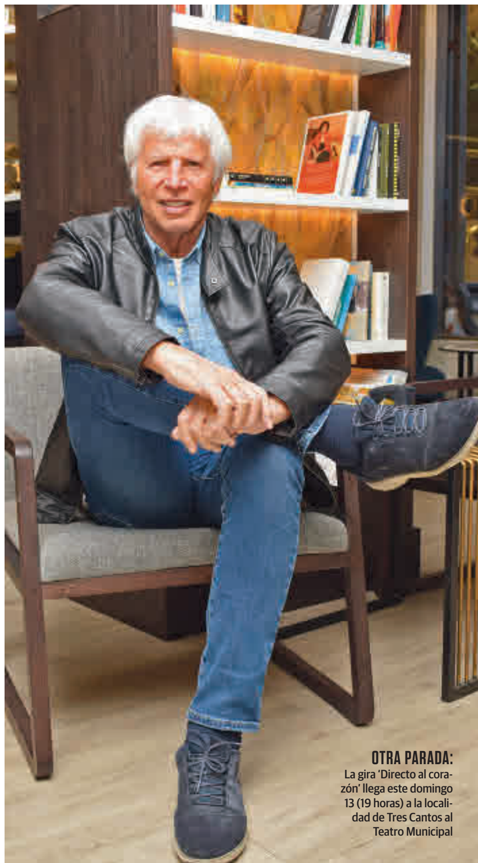
OTRA PARADA: La gira ‘Directo al corazón’ llega este domingo 13 (19 horas) a la localidad de Tres Cantos al Teatro Municipal

fue un éxito que nadie imaginábamos, tan grande que ha servido para que artistas como Sergio Dalma hicieran versiones y también ayudaran a que ‘El jardín prohibido’ estuviera siempre en el recuerdo”. Gracias a ese tema, el nombre de Sandro Giacobbe empezó a ser tremendamente popular en nuestro país, generando una legión de fans que protagonizaron anécdotas increíbles: “Me acuerdo que, en una ocasión, iba a actuar en ‘El gran musical’, un