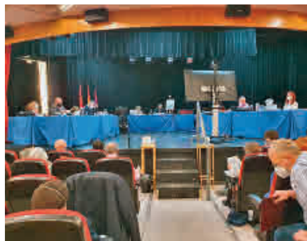
Un momento del Pleno ordinario de este mes de febrero

Por otro lado, el edil de Ciudadanos adelantó que el Consistorio reformará la zona canina del parque Doctor Fernández Catalina "con el objetivo de garantizar una convivencia óptima entre vecinos y animales de compañía".