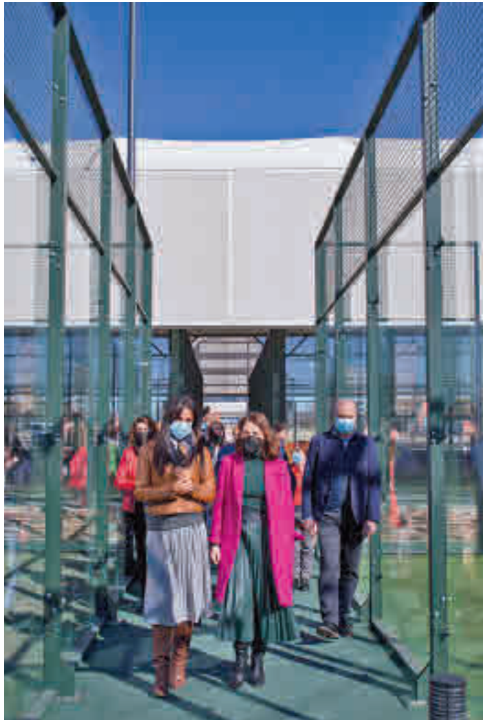
La vicealcaldesa, Begoña Villacís, visitó el centro el 7 de febrero

Ya están disponibles las clases abiertas de aerofitness, baile, ciclo sala, estiramientos/relajación, fitness, GAP, hipopresivos, musculación, pilates y pádel, cuya reserva