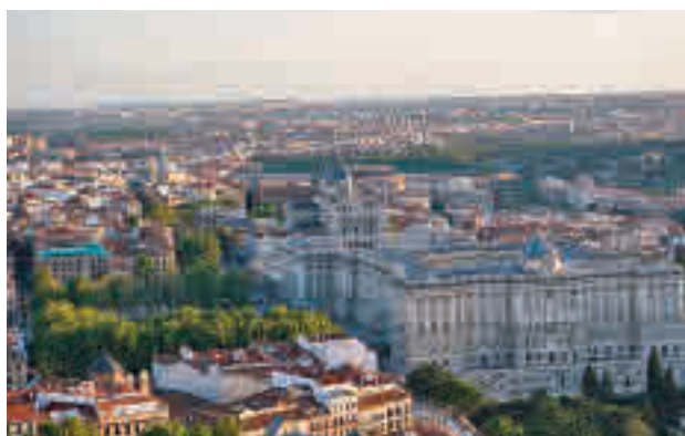
Una imagen aérea de la capital

el objetivo es mejorar la percepción de la Marca Madrid ante prescriptores externos, a través de la medición de su impacto en los medios de comunicación y su valoración en índices y rankings internacionales. Esta iniciativa está abierta tanto a creadores individuales como a agencias