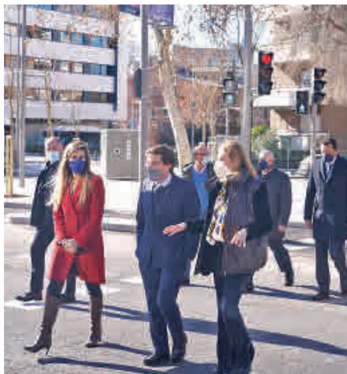
Un momento de la visita del alcalde de Madrid

LA ACTUACIÓN MUNICIPAL HA SUPUESTO LA INVERSIÓN DE 10,2 MILLONES