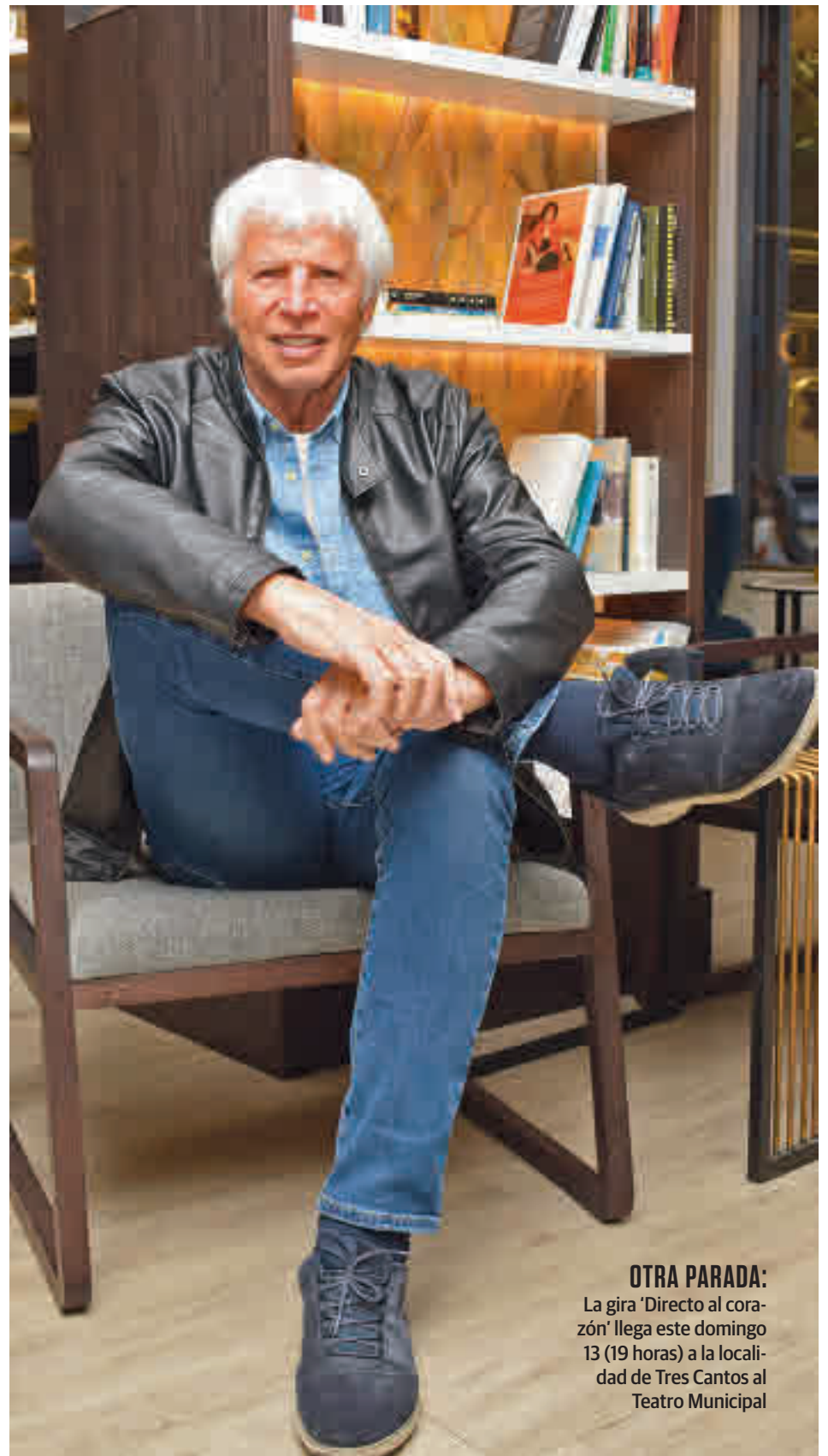
OTRA PARADA: La gira ‘Directo al corazón’ llega este domingo 13 (19 horas) a la localidad de Tres Cantos al Teatro Municipal

fue un éxito que nadie imaginábamos, tan grande que ha servido para que artistas como Sergio Dalma hicieran versiones y también ayudaran a que ‘El jardín prohibido’ estuviera siempre en el recuerdo”. Gracias a ese tema, el nombre de Sandro Giacobbe empezó a ser tremendamente popular en nuestro país, generando una legión de fans que protagonizaron anécdotas increíbles: “Me acuerdo que, en una ocasión, iba a actuar en ‘El gran musical’, un